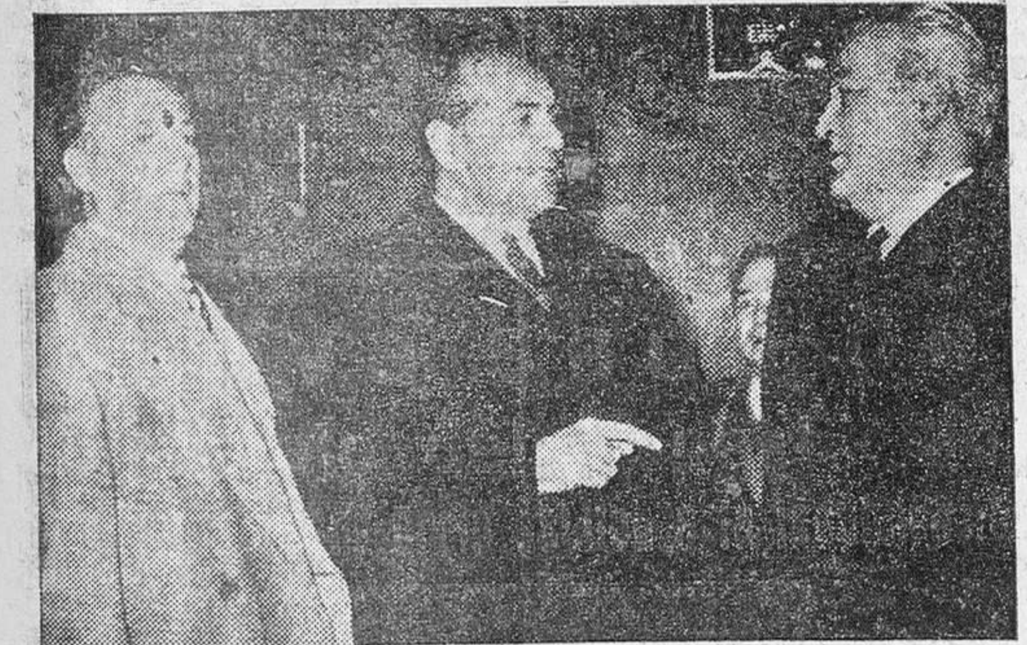
Los camaradas Solís Ruiz y Sanz Orrio, Ministros Secretario General y de Trabajo, respectivamente, conversan con el Jefe Nacional del Sindicato del Espectáculo durante la inauguración de los nuevos locales de este Sindicato, sitos en la madrileña calle de Castelló.