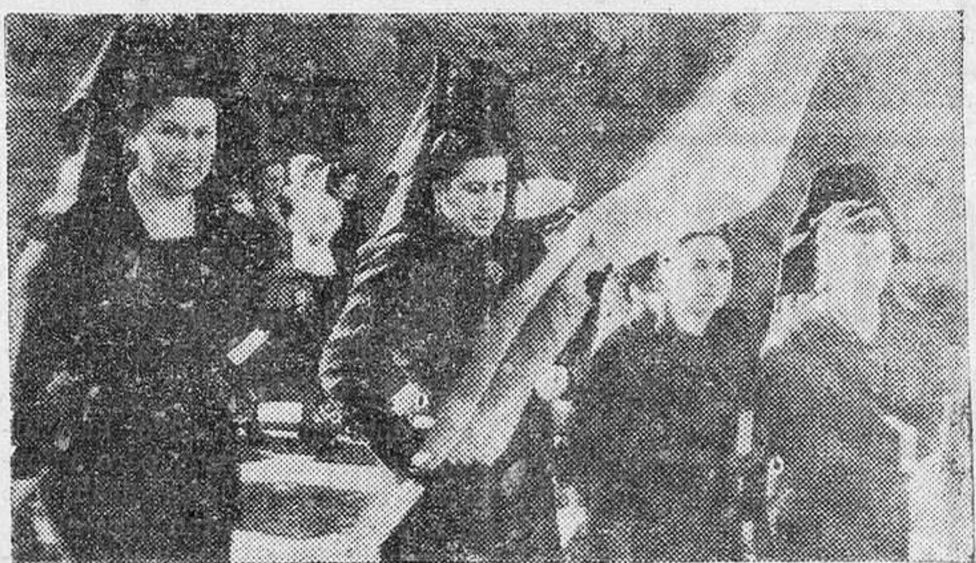
La madrina con sus damas de honor.

Autoridades y vecindario se trasladaron a la iglesia parro-