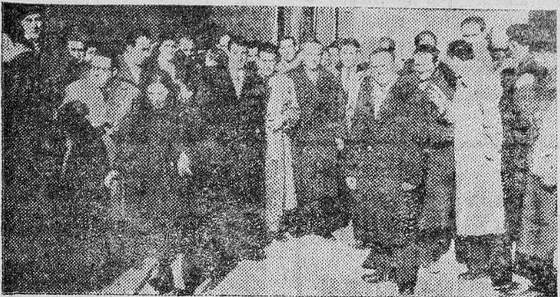
Los productores del Sindicato de Agua, Gas y Electricidad en la salida del templo, rodean a las jerarquías sindicales.