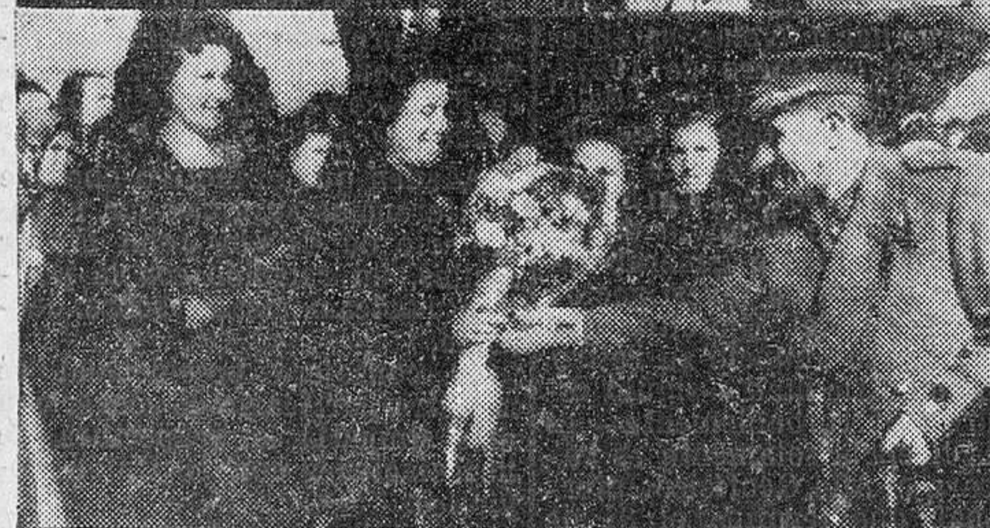
Continuando el reportaje gráfico, las fotografías nos muestran el momento en que la madrina hace entrega de la bandera al Teniente Coronel Jefe de la Comandancia; la entrega que este hace al Teniente que mandaba la Sección y, finalmente, el Teniente Coronel obsequia a la madrina con un ramo de flores.

su celo y vigilancia, mantiene la tranquilidad de los hogares y la paz del pueblo. Amor y cariño hacia ellos —prosiguió— y sus familias que conviven con nosotros, participando de nuestras penas y alegrías, y respeto a la autoridad que representan. Estos sentimientos van recogidos entre los pliegues de nuestra gloriosa Bandera, como ofrenda que hace el pueblo de Villardecierros a la heroica Guardia Civil de Fronteras. Y cada vez que ondee al viento, sea su tremolar como un lazo que nos une a todos en un mismo sentir y en unos mismos amores: Dios y Patria, a los cuales debemos dirigir nuestras actividades, como buenos hijos de Villardecierros, integrantes de la gran familia que formamos los españoles.