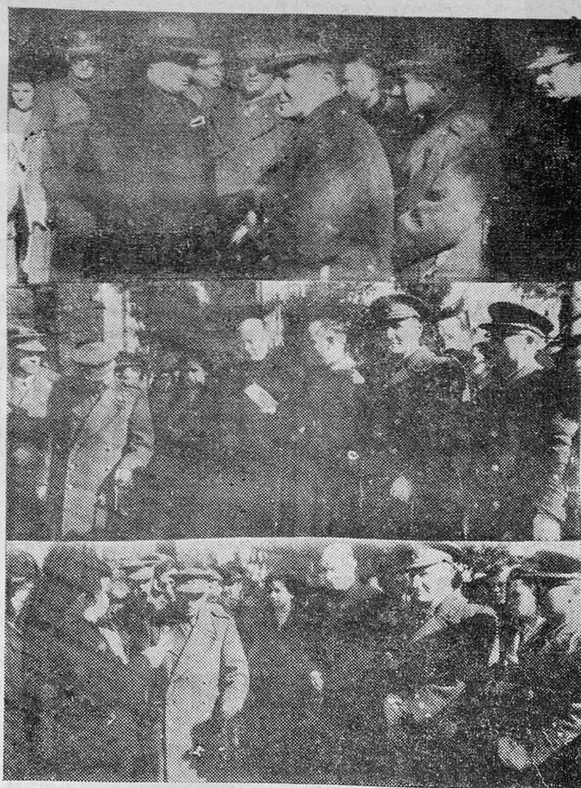
Ofrecemos algunos documentos gráficos del acto: De arriba abajo, el señor Gobernador Civil conversando con el Coronel del Tercio y el Teniente Coronel Jefe de la Comandancia, a su llegada a Villardecierros. Sucesivamente, presentamos al Alcalde y a la madrina durante sus discursos.

en TECHNICOLOR con Tony Curtis - Janet Leigh