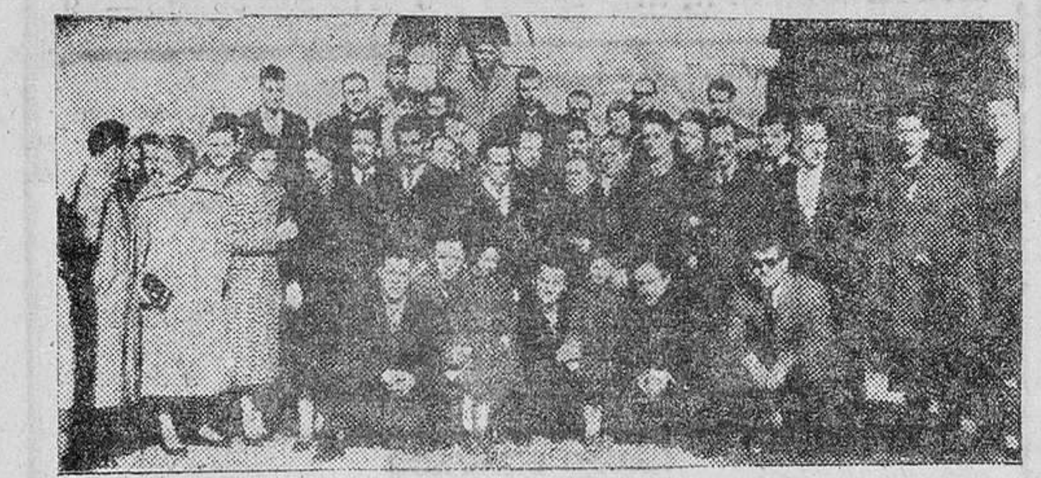
Los montañeros zamoranos.