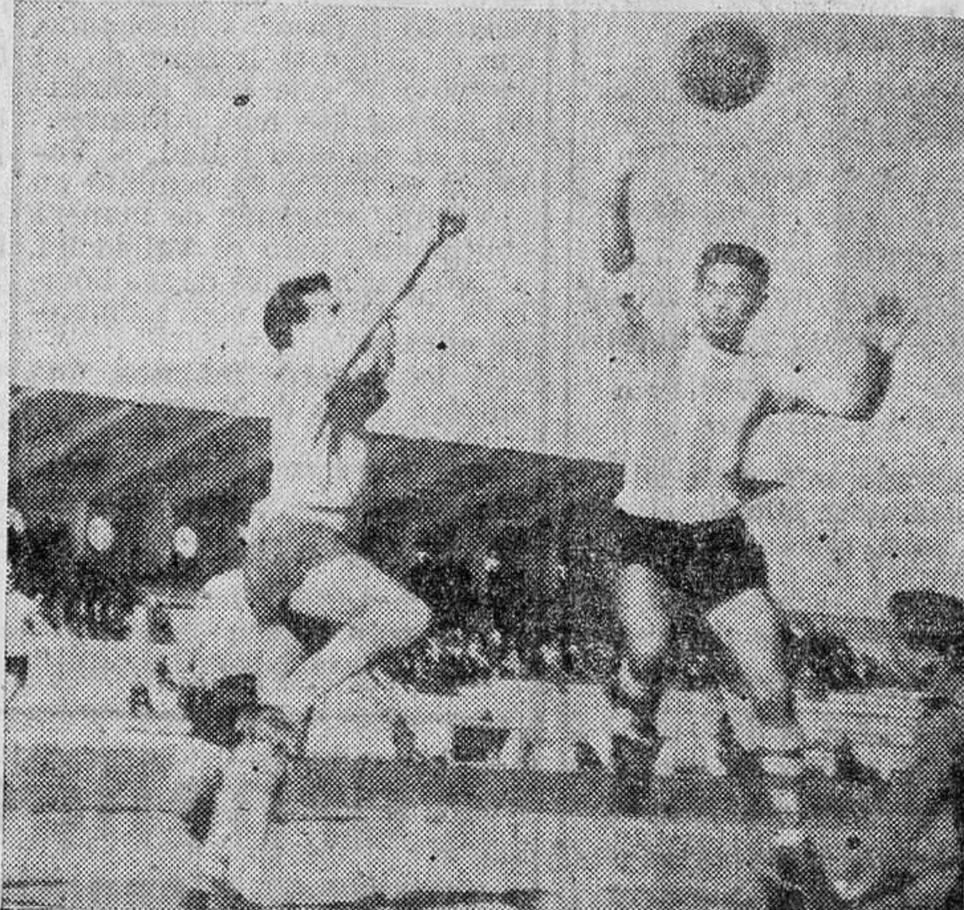
El meta del Plaseñcia, anticipándose a la acción de Taular, despeja con el puño derecho un balón que intentaba rematar el interior izquierdista rojiblanco.

lucha con varios contrarios, que intentan interceptarle. A todos esquivó Puskas, como igualmente al meta, que trata de detenerlo con los brazos, en unión de uno de los defensas. Ambos, en sus intentos, caen al suelo, y Puskas, libre de adversarios y a