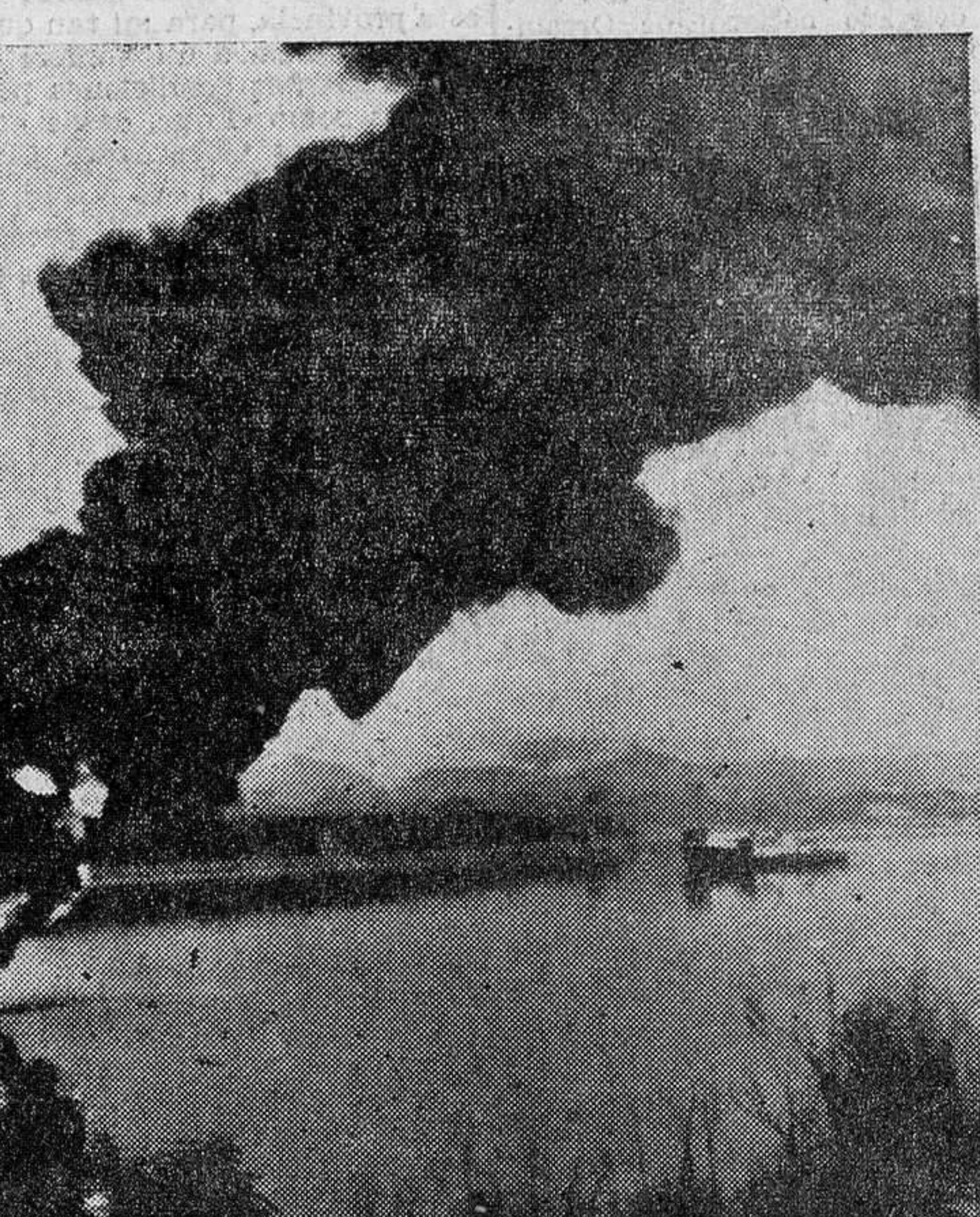
Una demostración del nuevo anti-fuego flotante ha sido realizada en el puerto departamental de Gennevilliers. El aparato está formado por dos elementos flotantes estabilizadores. Una alfombra de siete mil litros de mezcla de fuel-oil doméstico y de gasolina flamea, contenida por la barrera flotante.

ciat saludó al Ministro y le hizo entrega de los estudios y proyectos económicos, sociales y asistenciales de la Organización Sindical. Después de hacer entrega de las credenciales a los jefes de los Sindicatos, pronunció el señor Solis unas palabras en las que hizo visible el gran esfuerzo de los Sindicatos y de sus hombres en un elevado afán por el engrandecimiento nacional. Hizo notar después el Ministro la responsabilidad de los mandos y jerarquías, y en este momento fue interrumpido por los aplausos y vítores de los asistentes. Al final, el señor Solis recibió una cálida y prolongada ovación. En este acto, también dio posesión el Ministro Secretario General del Movimiento a los nuevos presidentes de entidades provinciales sindicales elegidos últimamente.