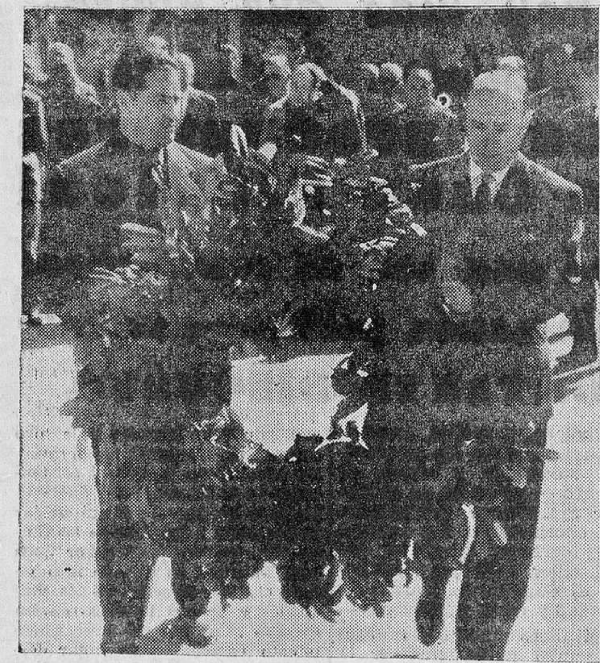
Ofrenda de la corona de laurel ante la Cruz de los Caídos.