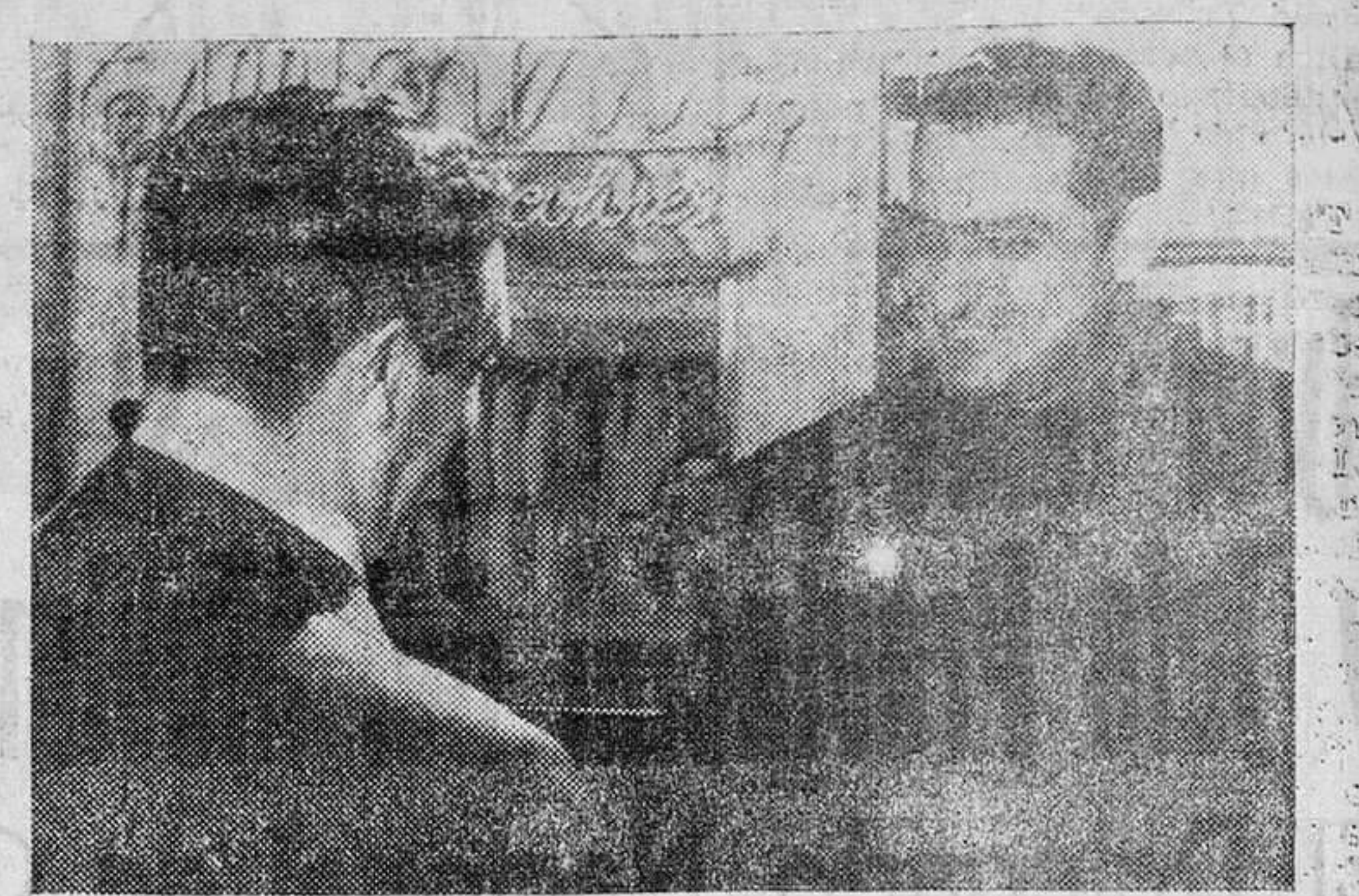
El Alcalde da la bienvenida de la ciudad al nuevo Gobernador Civil.

Finalmente, el camarada Hellín Sol comenzó diciendo que sabía la responsabilidad que contraía al hacerse cargo del