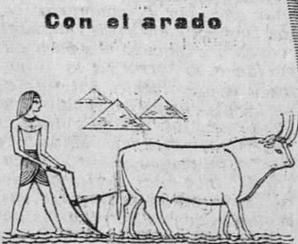
se afirmaron las primeras civilizaciones, como la del Antiguo Egipto hace 6.000 años.