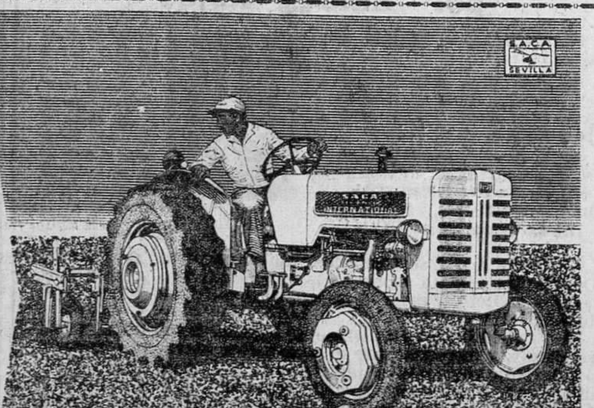
TRACTOR SACA S-432 de 35 CV de potencia al motor de cuatro cilindros.

los técnicos norteamericanos e ingleses van en vanguardia de la mecanización agrícola mundial. El tractor SACA S-432 es el producto más reciente de los últimos progresos de ambos. Fabricado por SACA, bajo licencia de INTERNATIONAL HARVESTER CO.