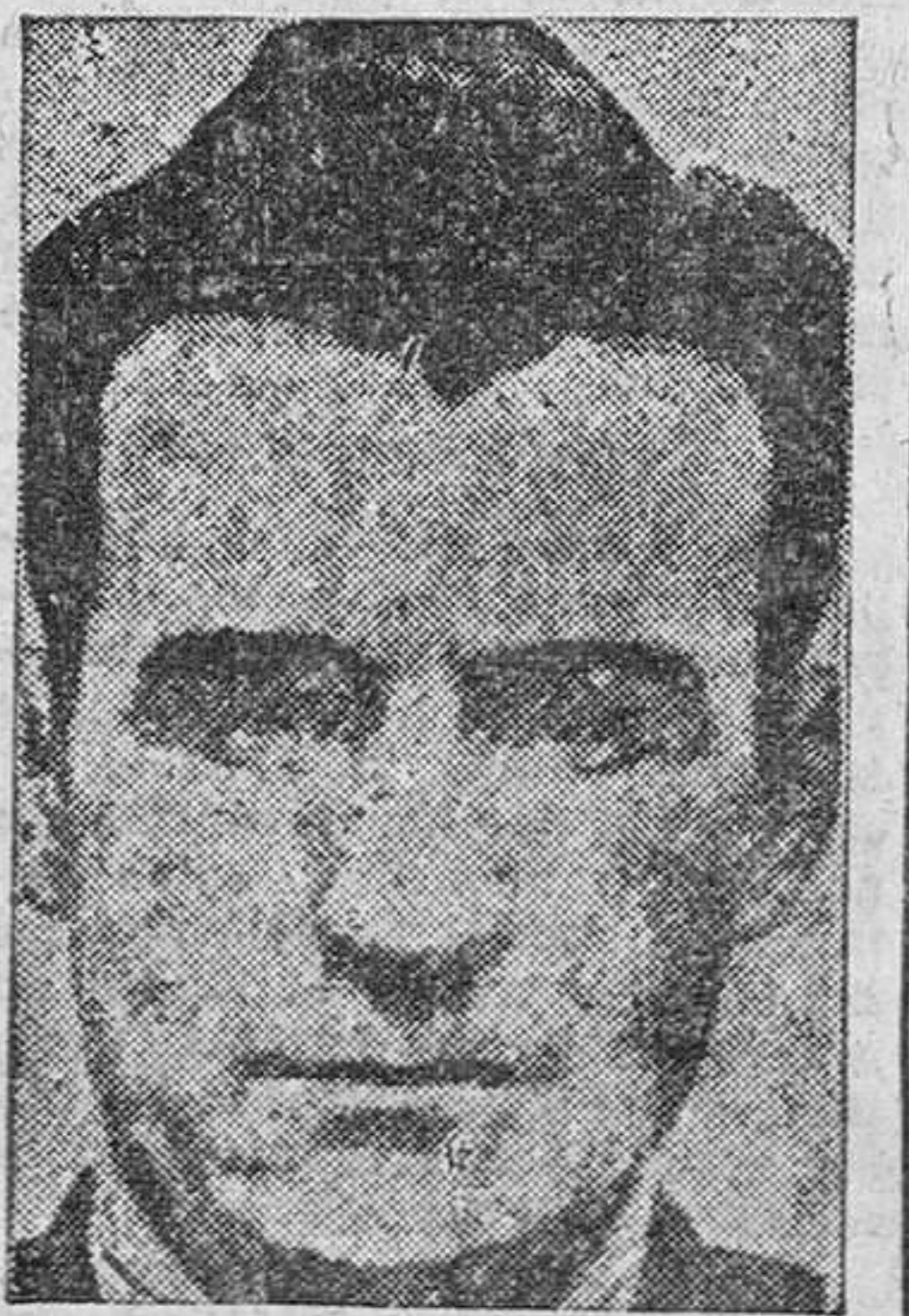
Peter Thomas Anthony Manuel

Glasgow, 11.—Peter Anthony Manuel, uno de los más alevosos criminales de la historia de Inglaterra, ha sido "colgado hasta la muerte" en el patio de la prisión de Barlinnie, esta mañana. Fué declarado culpable de siete asesinatos.