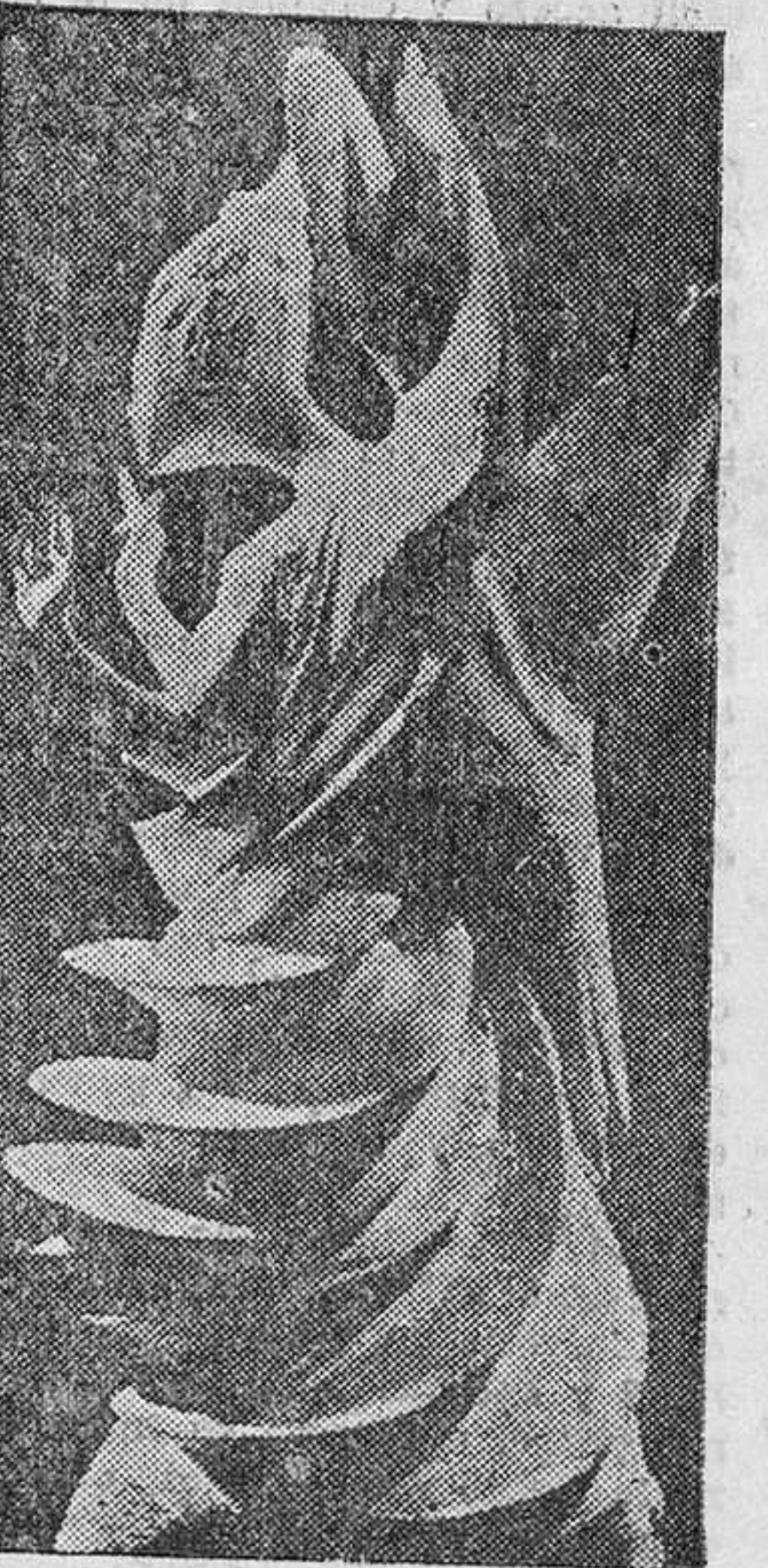
He aquí una escultura modernista cien por cien. Ha sido presentada por los americanos en Roma, bajo el motivo de ondas magnéticas, y se trata del Arcángel San Gabriel en un programa de TV. Es obra del escultor italiano Guarino Roscioli.