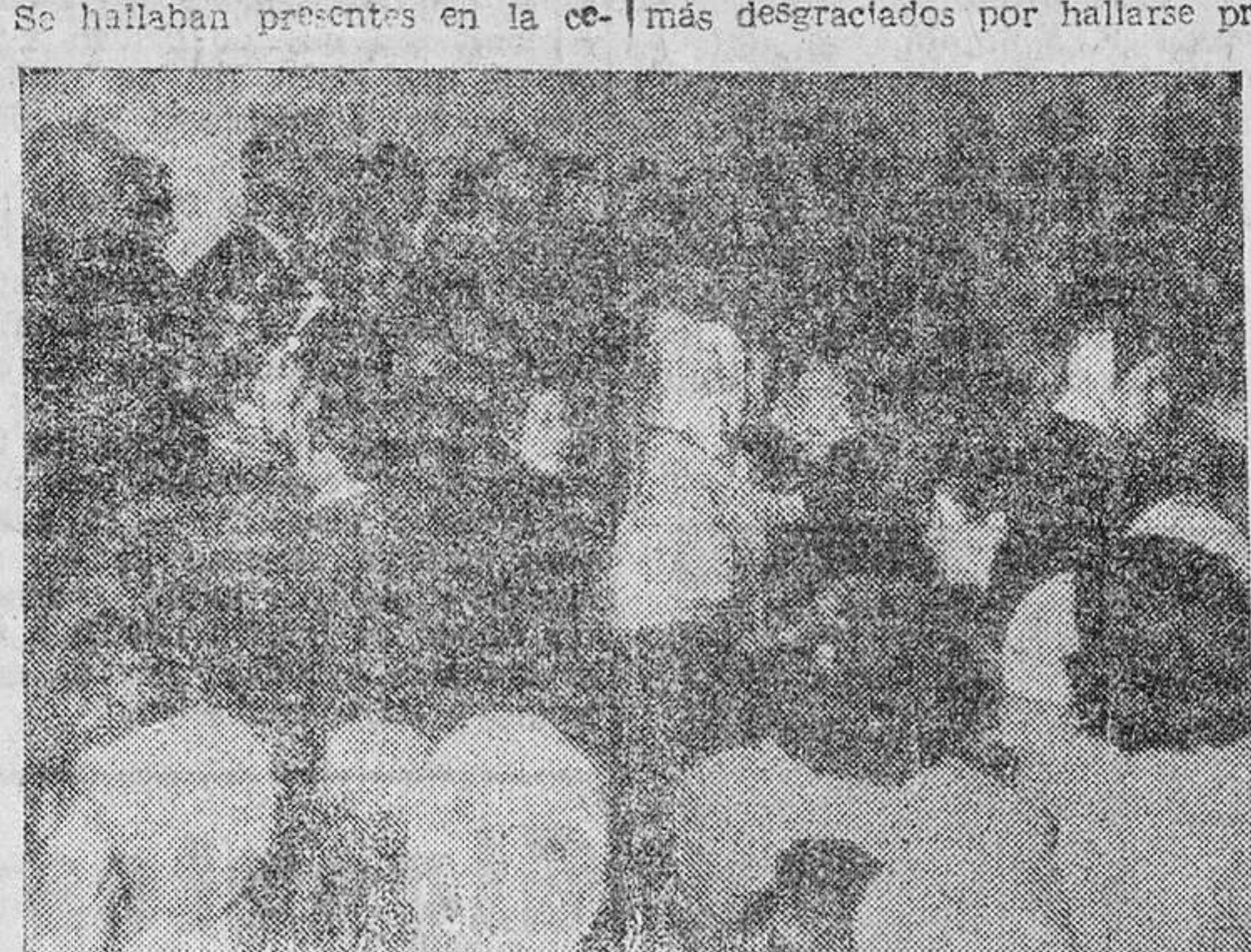
El señor Magistral pronuncia unas palabras ante el numeroso público asistente al acto.