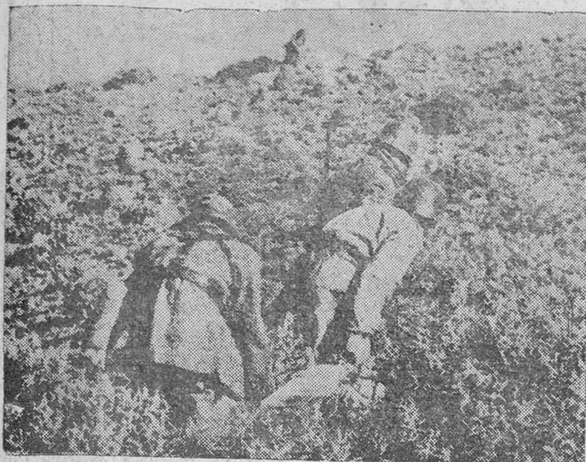
Un grupo de soldados durante su avance contra los rebeldes, protegiéndose entre las altas plantas tropicales.

Nuestros soldados, en sus puestos, por el honor nacional