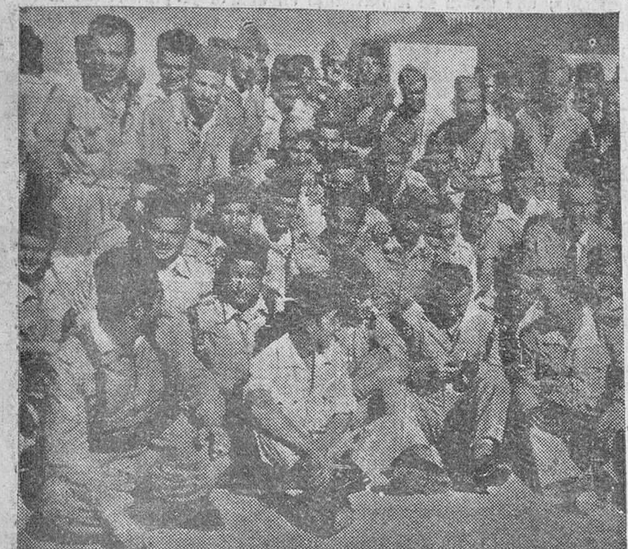
En la fotografía, oficiales y soldados reunidos para celebrar la Nochebuena con el aguinado llegado de España, durante una tregua en la lucha.