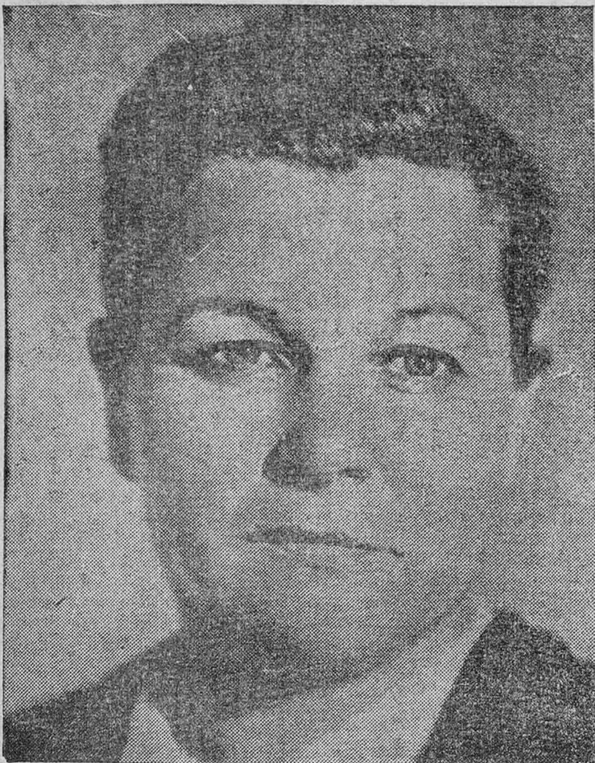
Una reciente fotografía de la Furtseva, considerada la primera mujer de la U. R. S. S.

Pocas, verdaderamente, han sido las mujeres que pueden vanagloriarse de haber representado un papel histórico en los anales del Partido Comunista soviético. Los nombres de Ana Pauker, Dolores Ibarruri "La Pasionaria", y otro par de ellas más, brillaron precisamente por el detalle de que su presencia en los altos escaños de los soviets era rara, sobrepasada. Pero si, a pesar de todo eso, la presencia femenina en los destinos del comunismo es algo extraordinario, quizá la mujer que más ha jugado hasta el presente dentro de los mismos ha sido Ekaterina Alexandrovna Furtseva, la única mujer que logró gozar de toda la confianza del más poderoso de los zaros rojos: Nikita Jruschef. Esta, en unión de la propia mujer del dictador, Nina Kruschcheva, se repartía la primacía de la magistratura femenina de las vastas Repúblicas soviéticas.