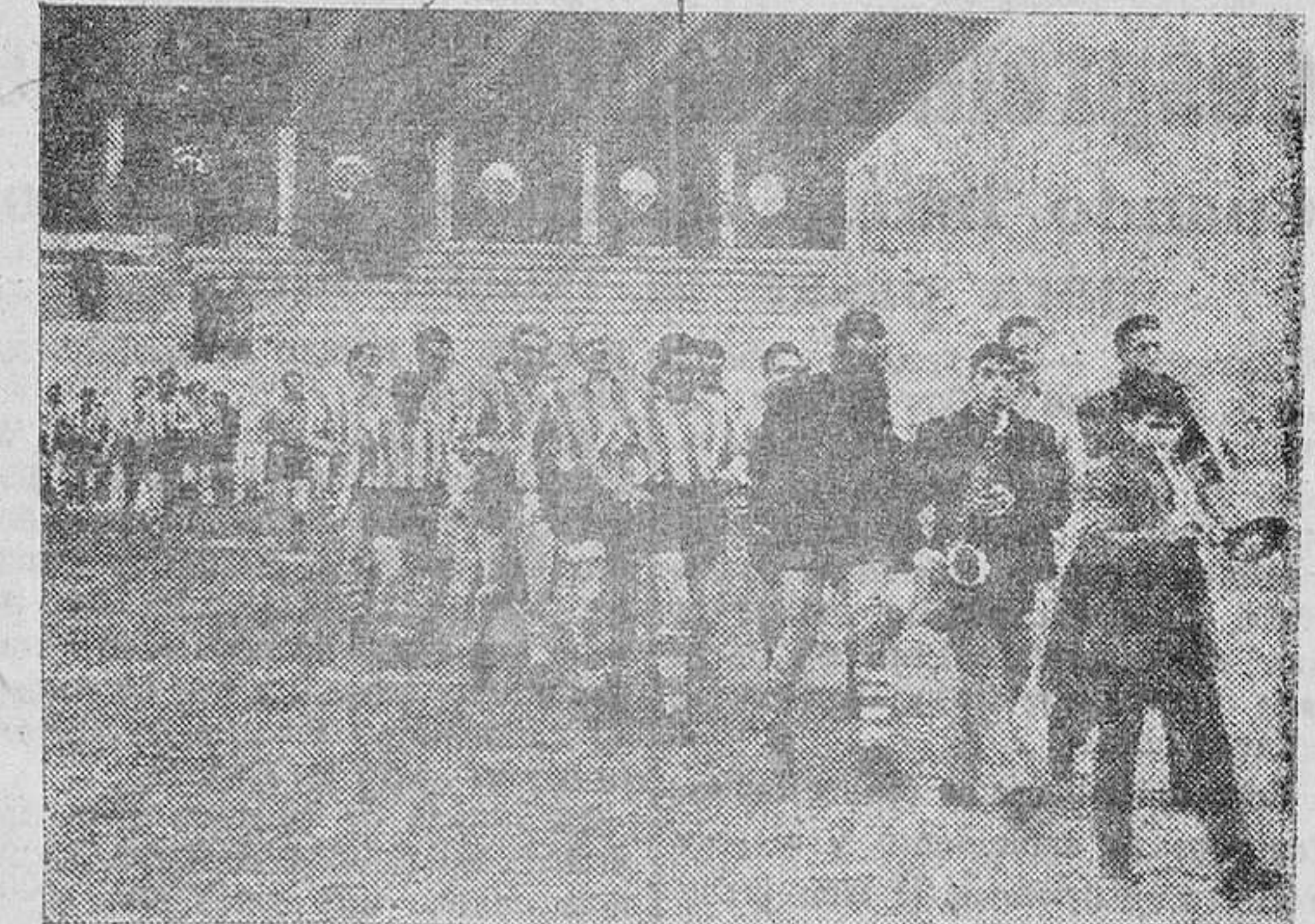
MUSICA TORERA. —Precedidos de una banda de música, con las notas alegres de un pasodoble torero, ambos equipos "saltan" al campo, al frente de los capitanes respectivos.