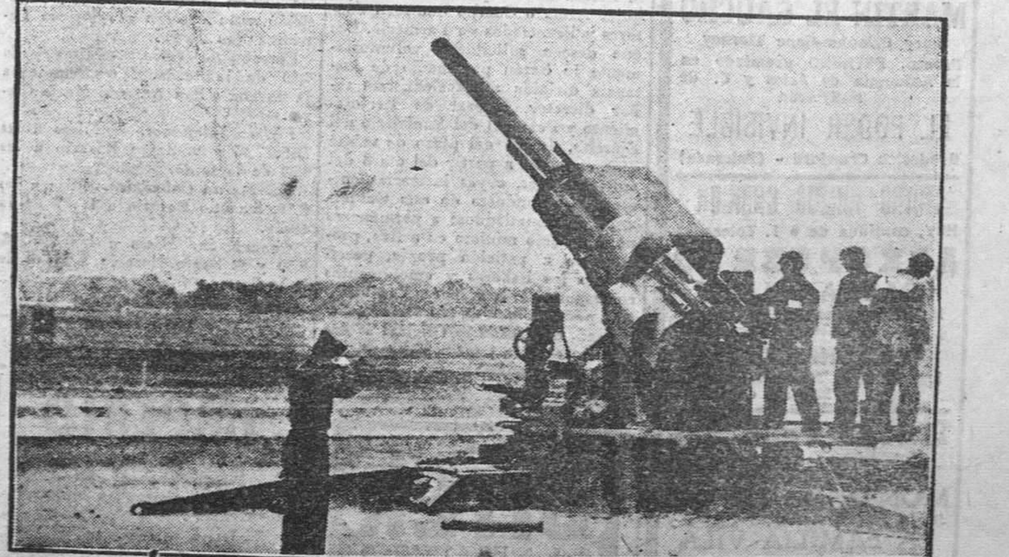
En Aberdeen se han realizado diversas pruebas en relación con las nuevas piezas de artillería antiaérea, calibre 120 milímetros. Según explican los técnicos, se trata de la tormentaria más pesada, dentro de su existencia, hasta ahora conocida.