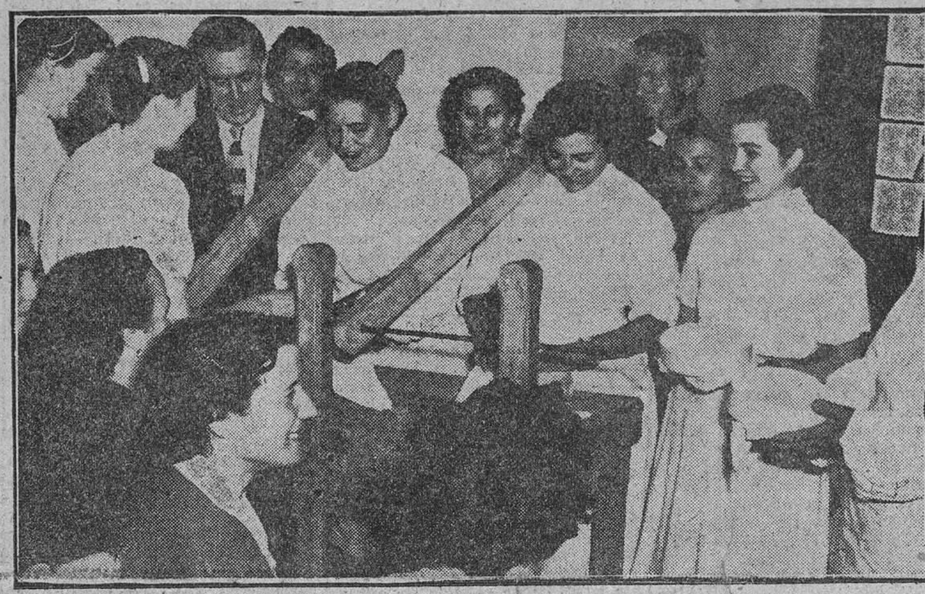
En las fotografías, grupo de cursillistas con el director del cursillo y al calde de Olmedo, y en la otra, fabricación de quesos por las alumnas.