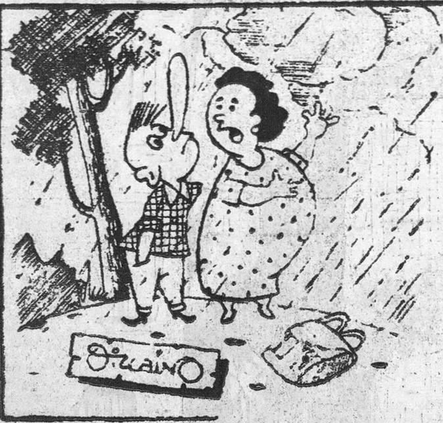
—Por Dios, Pepe! No levantes tanto la noria, que puedes atraer algún rayo...

Cerca de Munich, el Ministerio alemán de la Reconstrucción ha instalado una verdadera ciudad fantasma, que sirve para controlar científicamente la resistencia de los materiales de construcción.