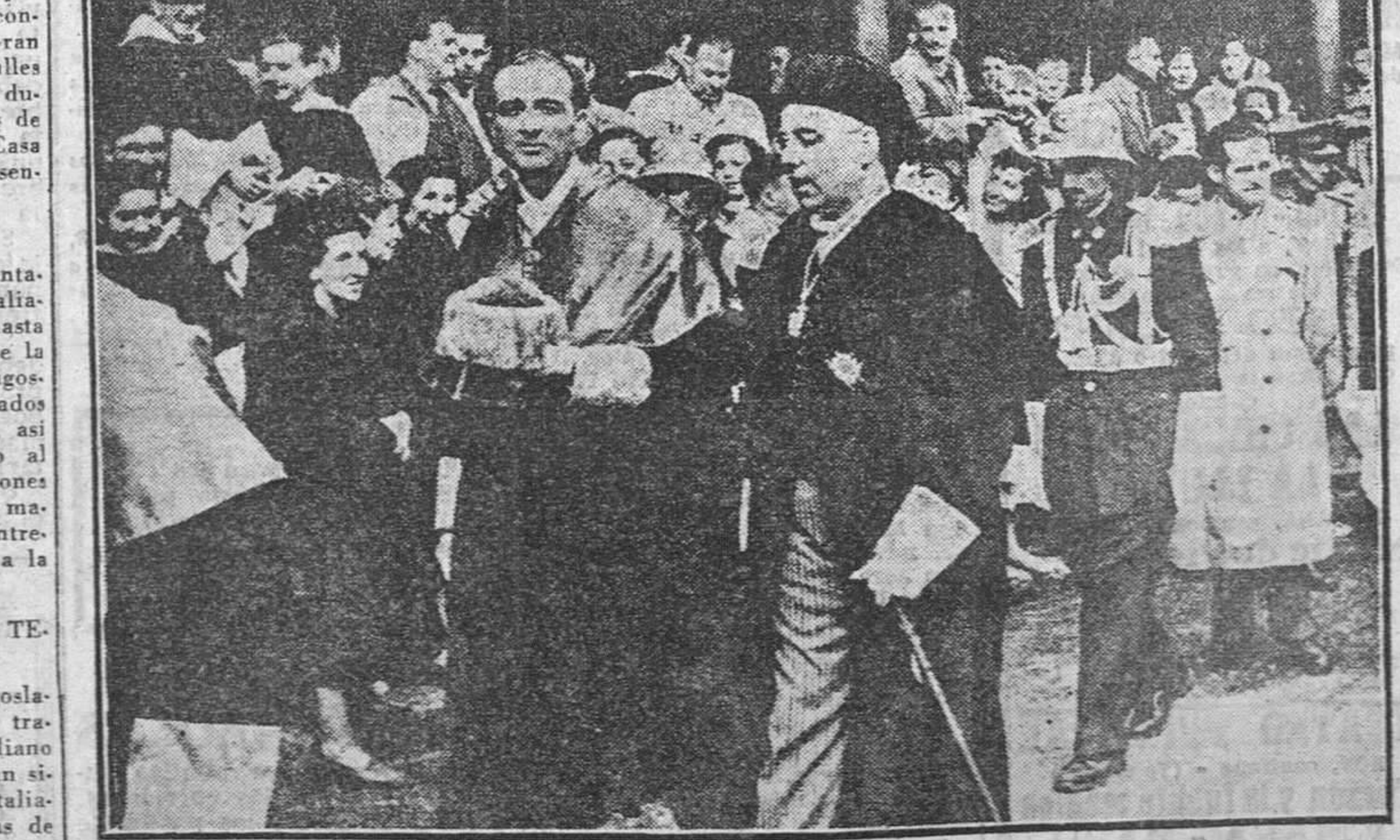
En el desfile procesional de los universitarios de todo el mundo, en homenaje a la Universidad de Salamanca, participó el ministro de Educación Nacional, señor Ruiz-Giménez, que aparece en la fotografía acompañado del rector, nuestro camarada Antonio Ibarra. (MAS INFORMACION GRAFICA EN LA PAGINA TERCERA.)