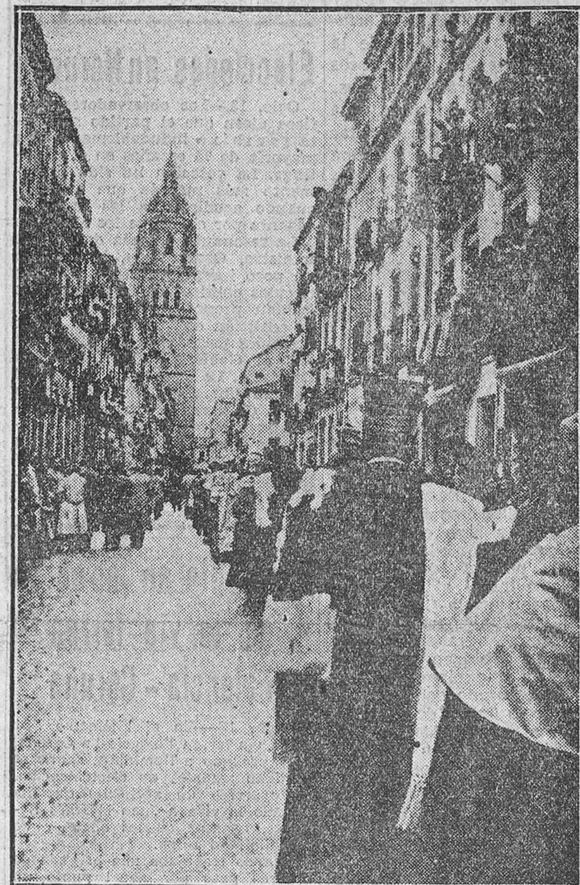
Uno de los actos más espectaculares de los celebrados en Salamanca, en las fiestas del séptimo centenario de su Universidad, ha sido la procesion universitaria. Representantes de todas las Universidades del mundo, ataviados con sus trajes académicos y sus birretas, recorrieron las calles de la ciudad, en solemne desfile, hacia el edificio de la Universidad salmantina. Nuestras fotos recogen diversos aspectos de este desfile procesional.