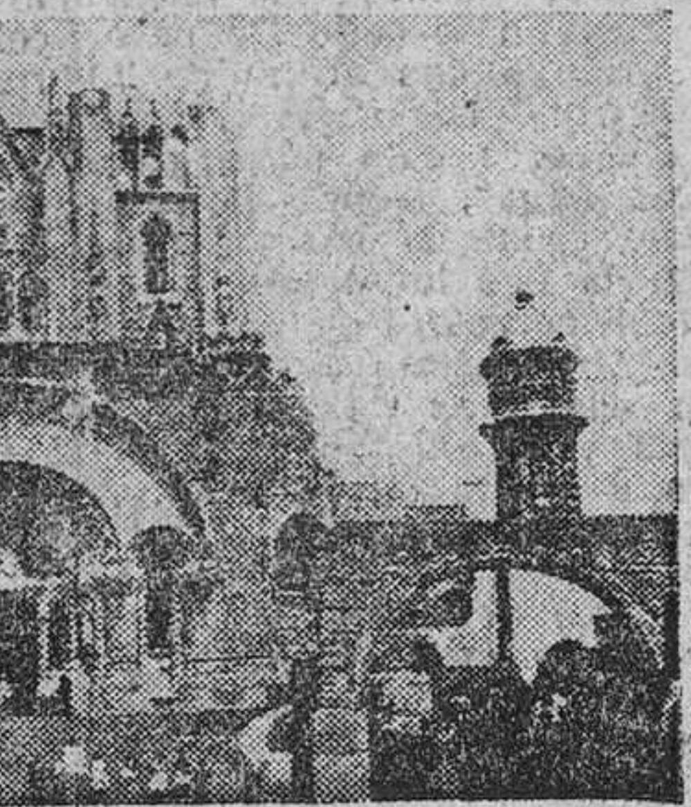
LA CUMBRE DEL TIBIDABO.

No conocía Satanás a Jesucristo, y aquí los ángeles, sus servidores, exaltan la Persona Divina de Jesucristo. ¡Bendita tradición, que glorifica estas santas alturas con la presencia humana de Jesucristo y que perpetúa con la vigencia del testimonio de su nombre: TIBIDABO! Es, pues, la suya una cima bíblica, y aquí estuvo Jesucristo, tentado por Satanás y servido por los ángeles. Fue el monte de la tentación y es hoy el monte de la exaltación de Cristo. La tradición entraña una promesa vindicadora, San Juan Bosco lo vio en profecía, y felizmente nosotros poseemos la hermosura de su realidad. Sobre la cima del Tibidabo, nosotros le erigimos el trono de su exaltación, aclamándole como a nuestro Rey Eterno, y aquí, como ángeles, llegamos y le servimos, y El reina sobre "todos los reinos del mundo y su gloria".