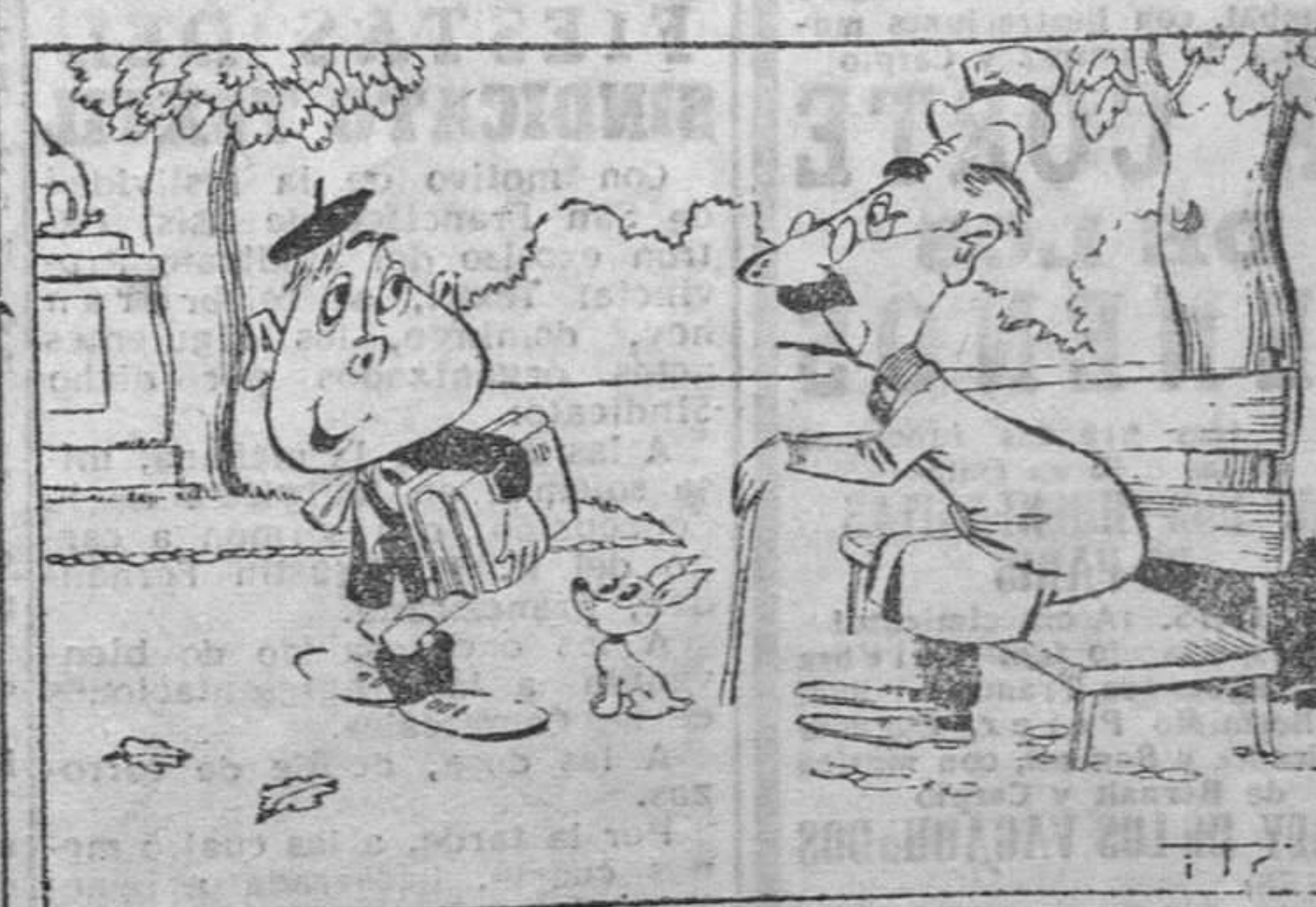
—¿Te gustará ir al Colegio? —Ir, sí, señor; lo que no me gusta es quedarme