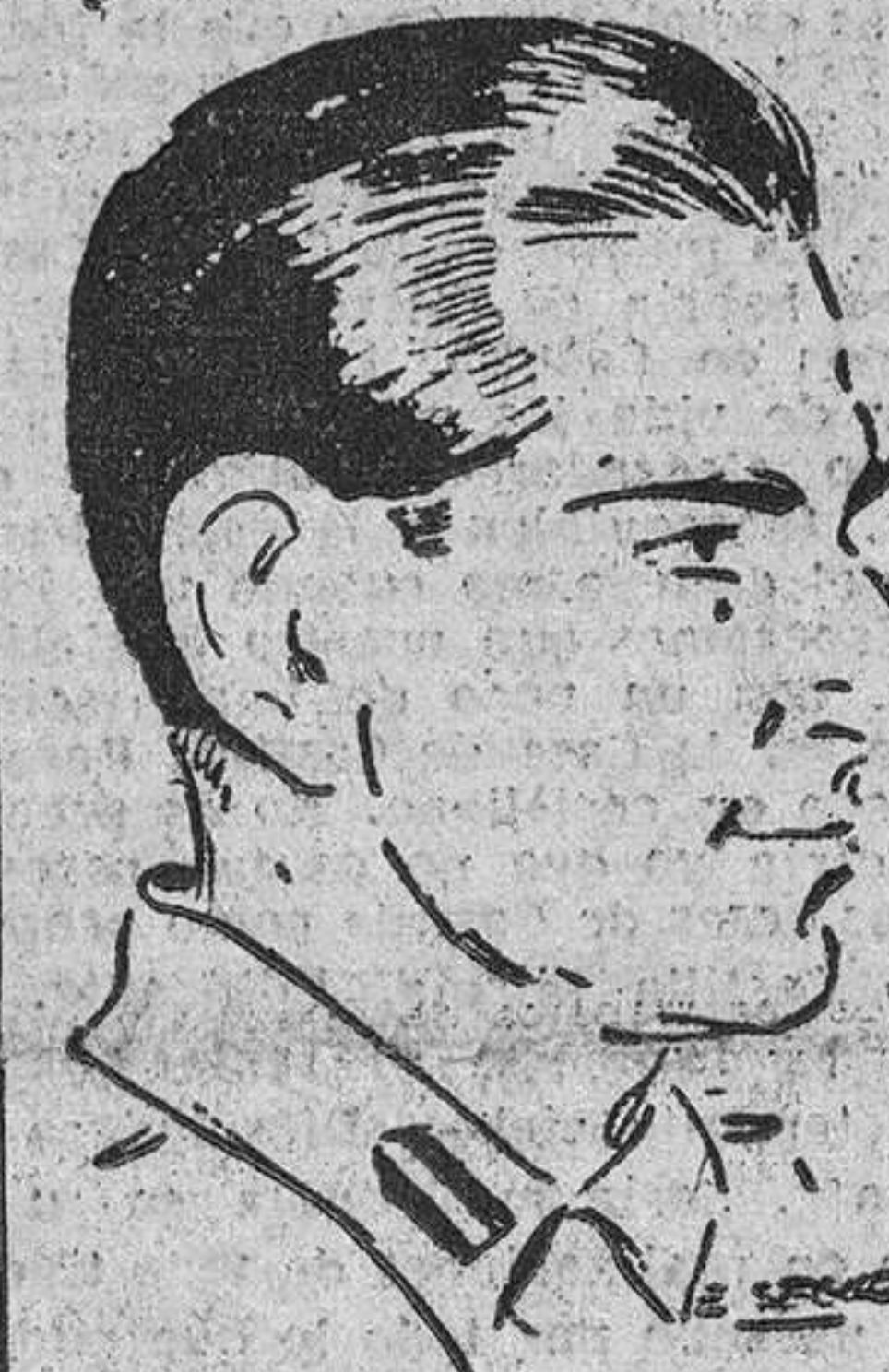
PEDRO DE YUGOSLAVIA

Dos meses más tarde Pedro II y Alexandra se prometen en matrimonio.