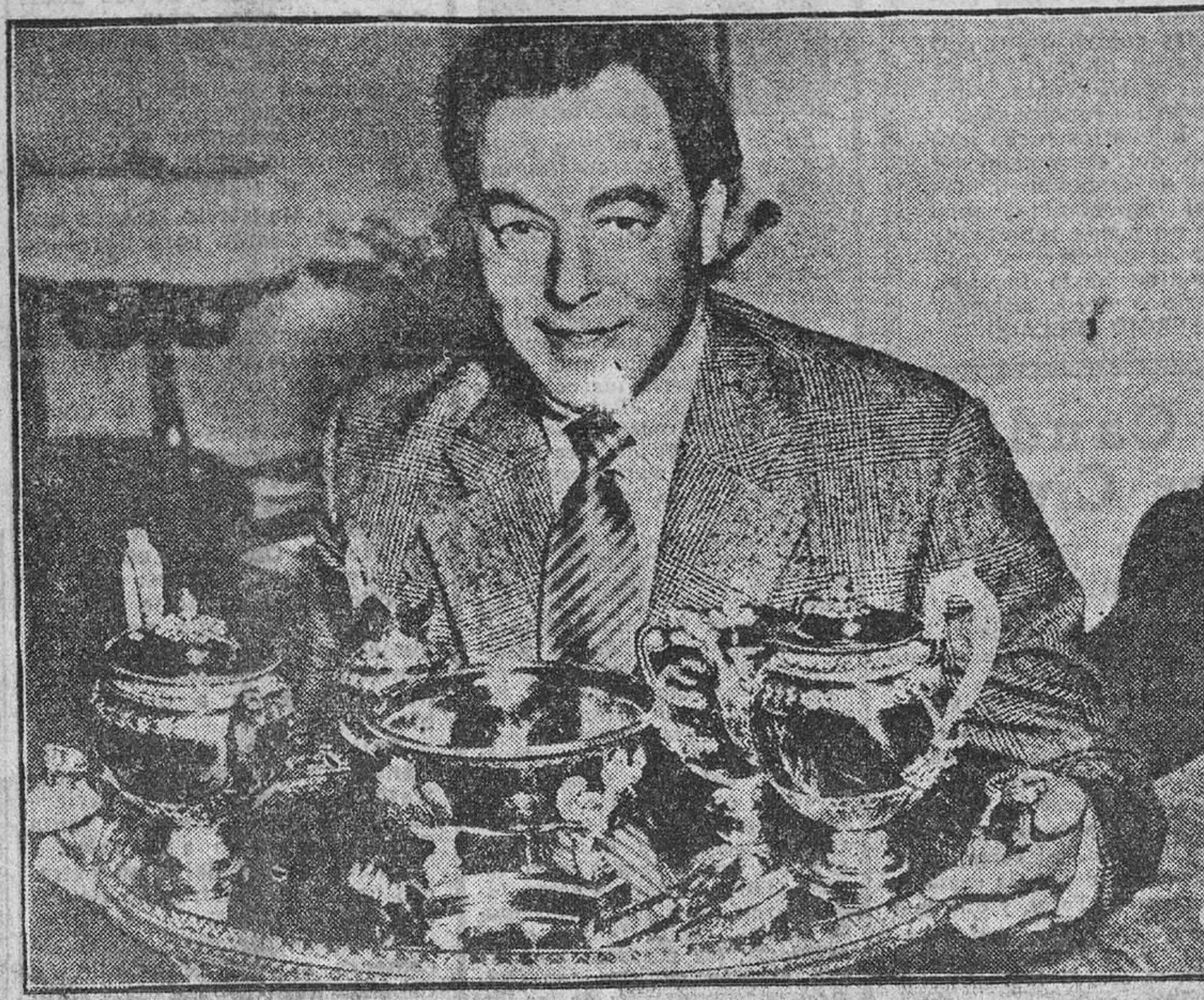
Se jugó el juego de cartas y se valorado en una suma equivalente a cuatro millones de pesetas, que ha sido vendido en Estocolmo. Perteneció al zar de Rusia y fue realizado en 1825 por el famoso orfebre ruso Kleber. Es de oro macizo y pesa diez kilos