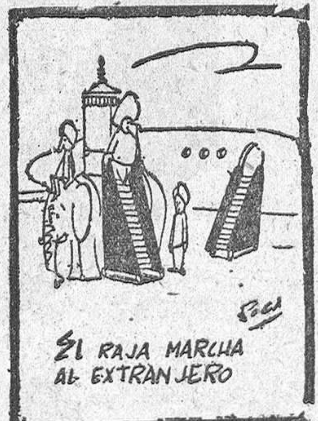
EL RAJA MARCHA AL EXTRANJERO

Torso desnudo, toalla al cuello, una morena y una rubia contemplándole con gesto gentil y al fondo el mar, en crepado en olas blanquiazules bajo el sereno cielo de Georgia. No se puede pedir más a la vida para ser feliz. Es decir, no pueden pedirle más los Principes, los que no siempre pueden gozar estos momentos. Los otros, quienes ni siquiera poseen un principado para divertirse de vez en cuando, si que tienen derecho a solicitar los favores de la fortuna. Claro que para turbar este sosiego siempre hay un fotógrafo a punto, como si el agente artístico de la excentriz siguiese manejando en el incognito los sutiles hilillos de la propaganda. Pero eso es peccata minuta. Lo que importa—para el protagonista de la "foto"—para nosotros, al servicio de la actualidad—es el ademán sonriente, expresivo de quien por influencia de su consorte (en espera de dos mellizos) pudiera ser confundido con un norteamericano cualquiera, aunque no se le haya ocurrido cambiar de nacionalidad ni pensando en los millones de su suegro. Un norteamericano llamado Rainiero.—V.