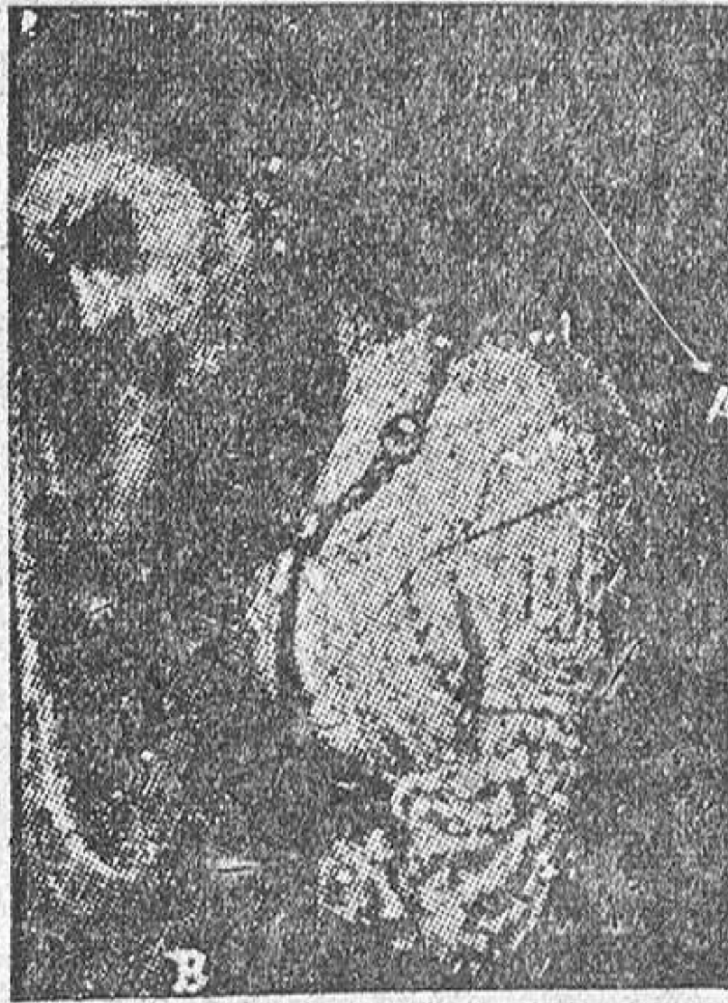
Un famoso cuadro de Rembrandt

Pero es que Saskia discurre, siente, piensa y ama como él. Y ella misma le anima, provoca en