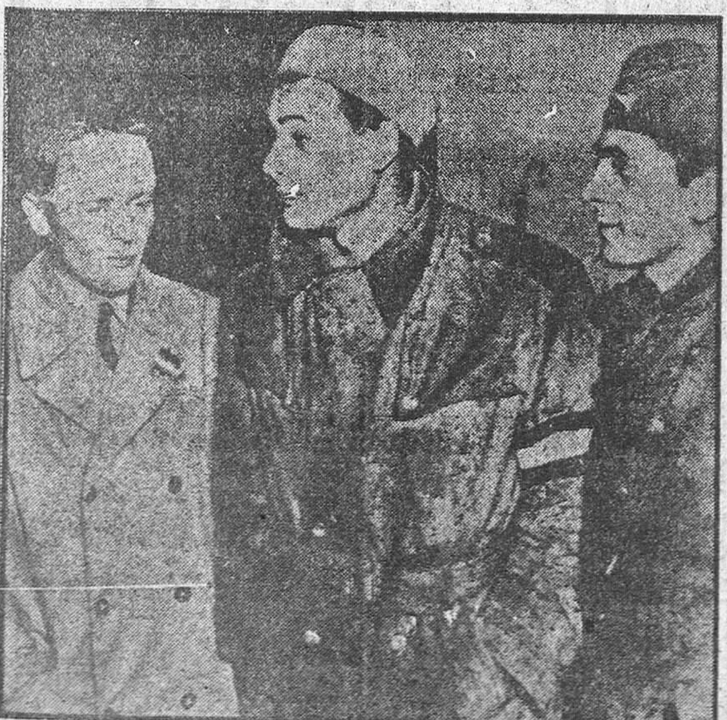
Un paisano, un guerrillero y un soldado, los tres combatientes, refugiados en Austria, huyendo del terror implantado en Hungría por las hordas del Kremlin.