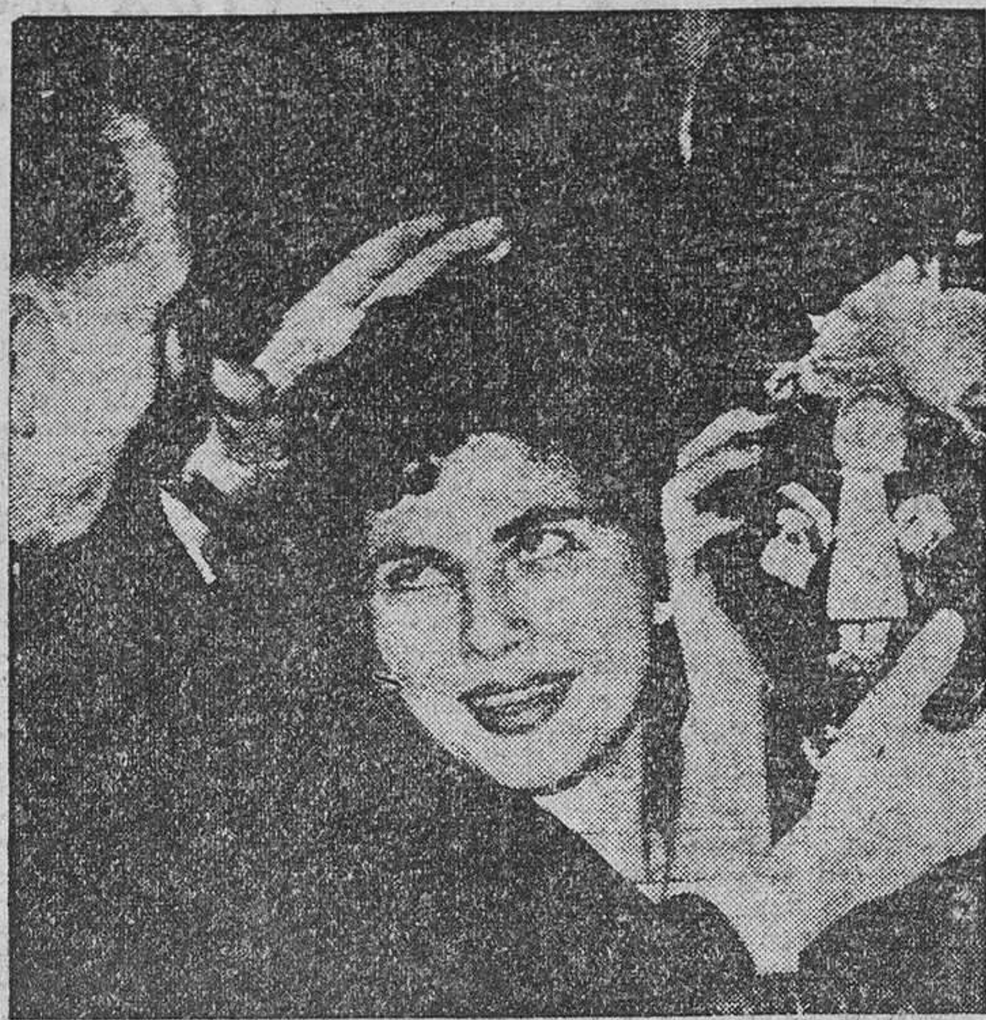
SORAYA, la bella Emperatriz de Persia, ha sido muy bien recibida en Alemania. Concretamente en Múnich, el entusiasmo sobió de punto cuando el alcalde, doctor Thomas, entregó a la augusta dama un colosal corazón de chocolate.