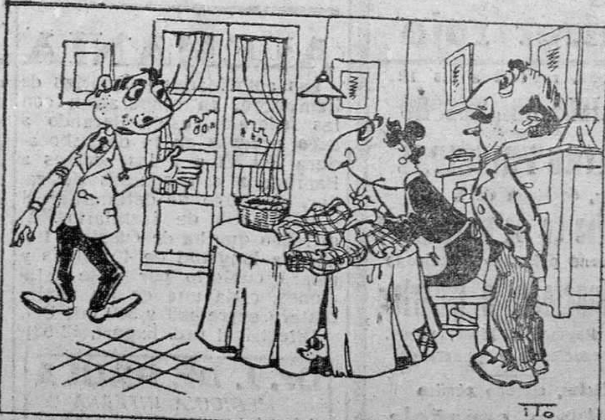
—¡Nunca me habéis querido; no y no! ¡Si hasta cuando nací me pusisteis de nombre Beremundo...!