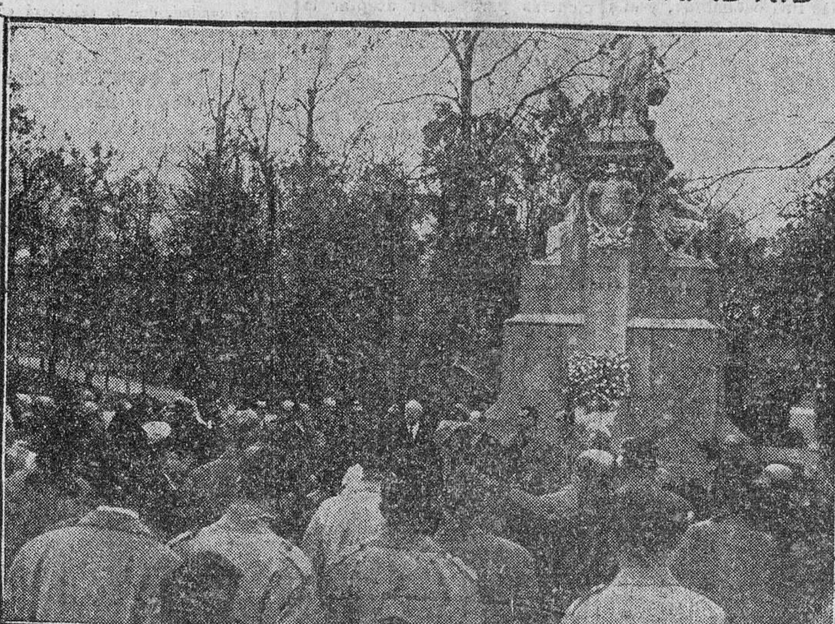
Con motivo de la Semana dedicada a Cuba, el político cubano Orestes Ferrara, con la colonia, y de los estudiantes que cursan sus estudios en Madrid, depositan una corona de flores ante el monumento a Cuba que se levanta en el Retiro. (Foto Contreras).