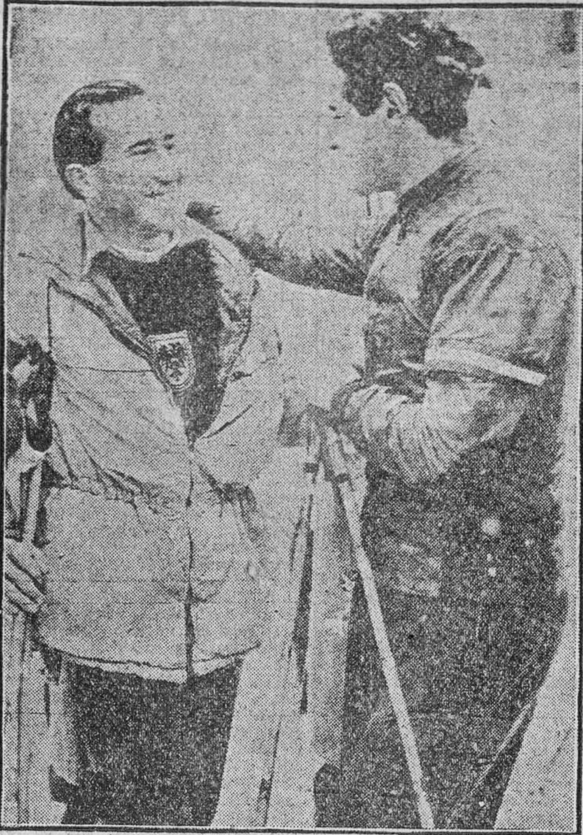
He aquí los dos mejores esquiadores del momento saludándose alegres tras del inflexible reparto de laureles que vienen realizando en la presente temporada. A la izquierda sonríe Pravda, y a la derecha responde, con idéntico gesto risueño, el gran Toni Spiess con su bandera como brazalete.