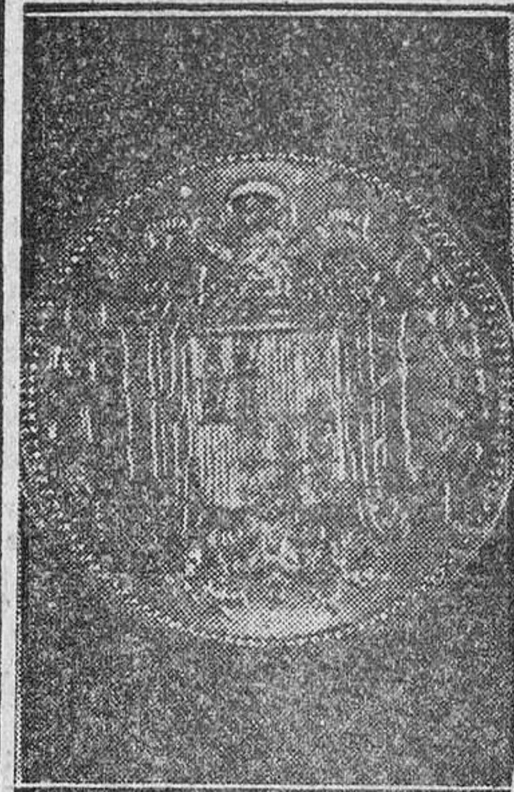
Anverso y reverso de la nueva moneda de dos cincuenta que se pondrá en circulación próximamente en España.