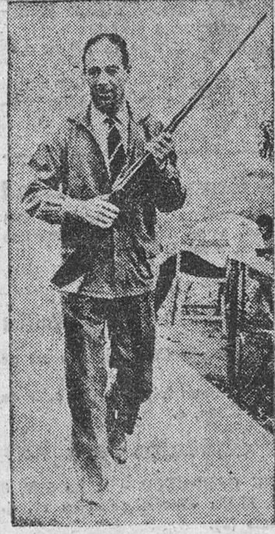
Nuevamente el conde de Teba, cuyas actuaciones en los Campeonatos del Mundo no fueron tan felices como de costumbre, acaba de proclamarse campeón de España en las pruebas de tiro al pichón de Gudamendi, ante 83 escopetas.