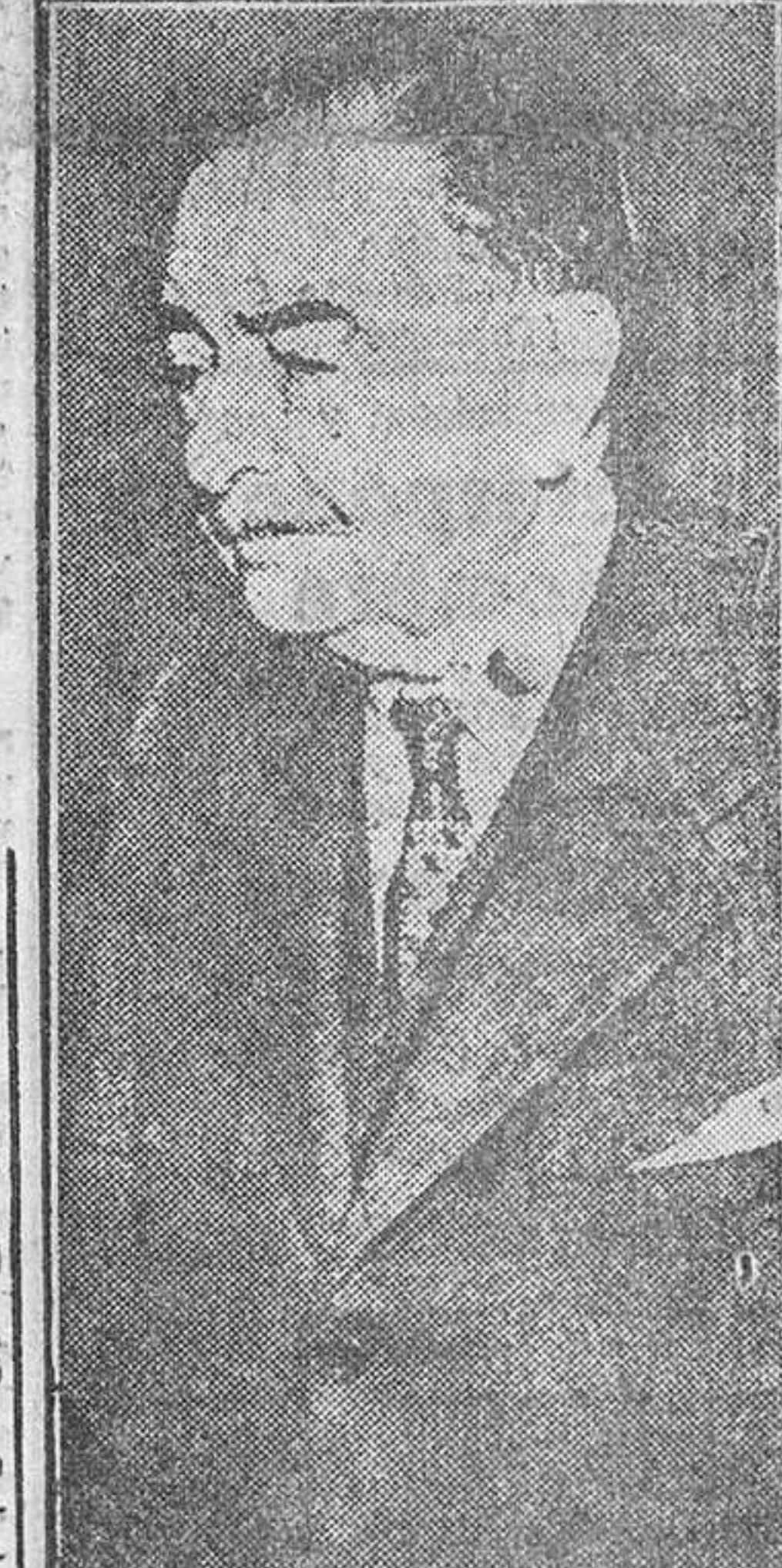
amistades que dejo aquí. Me gustaría añadir que, al igual que muchos amigos norteamericanos, creo profundamente que la amistad hispano-norteamericana es vital para la seguridad de Europa."

Washington, 30.—Poco antes de su partida para Nueva York, camino de España, el embajador saliente, don José Félix de Lequerica, declaró a la agencia United Press: "Es mi intención al regresar ahora a España hacer todo lo que pueda por continuar mis esfuerzos en pro de aumentar las excelentes relaciones entre Estados Unidos y España. Creo que en la muy crítica situación que se cierna sobre Europa, la amistad hispano-norteamericana es de vital importancia. También creo es importante que los Estados Unidos comprendan que pueden confiar absolutamente e inequívocamente en esa amistad, y también que se den cuenta de que no es hábito español el de dudar o dar excusas cuando es necesario enfrentarse con el peligro común del comunismo, especialmente ante los esfuerzos comunistas por amorrar el ardor de las naciones libres en pro de la causa común. En vísperas de mi partida de los Estados Unidos, no creo haga una despedida definitiva, sino más bien que mi ausencia sea temporal y que de cuando en cuando pueda volver a continuar las