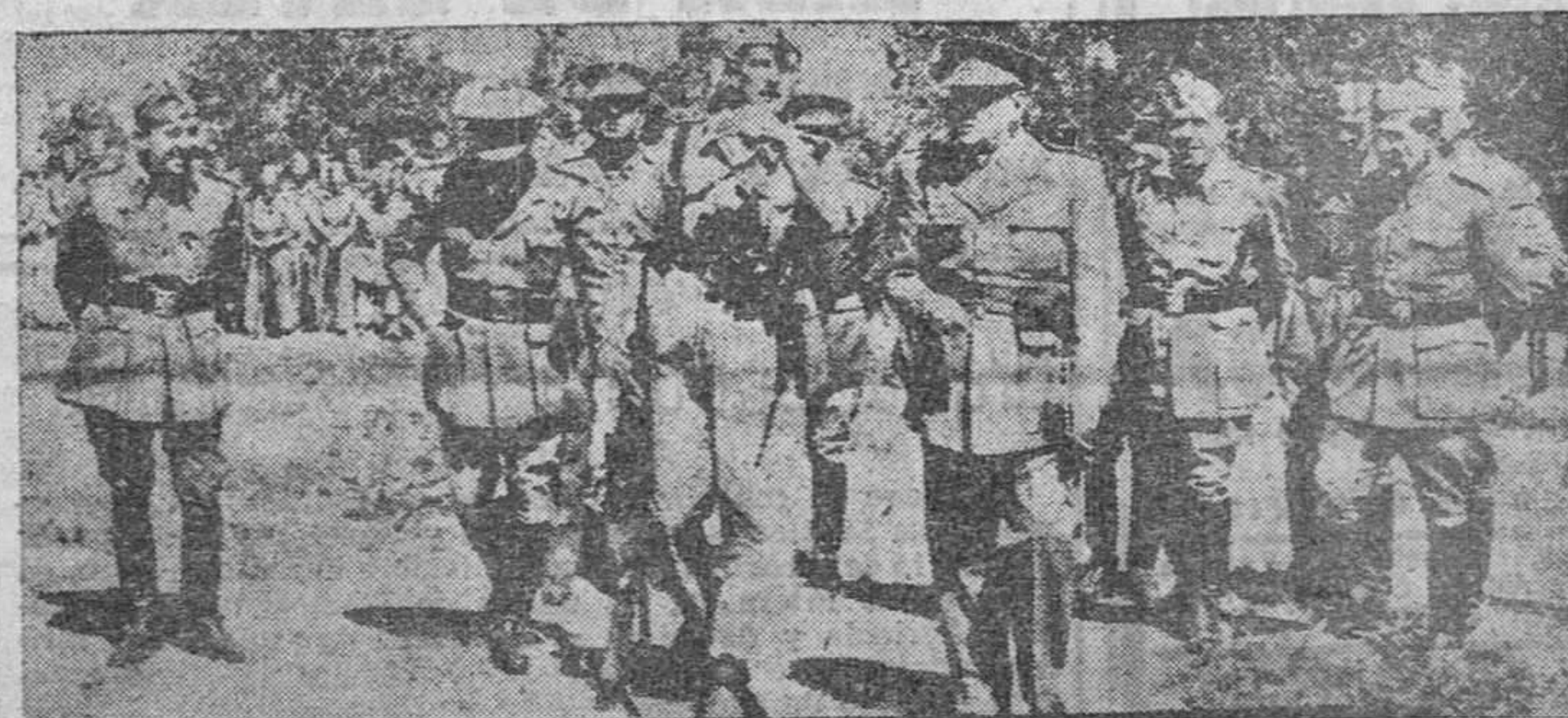
El ministro del Ejército, teniente general Muñoz Grandes, en su visita al Campamento de la Milicia Universitaria de La Granja, en el transcurso de la cual presenció los ejercicios de sus prácticas militares y pronunció un importante discurso.