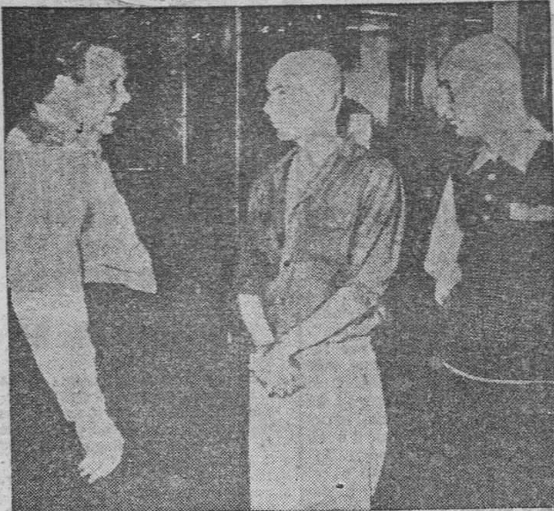
El conocido y temido castigo de aplicar la máquina del cero a la cabeza ha sido administrado en Michigan a estos dos muchachitos americanos, a los que aún se les ha afeitado luego para completar el castigo por sus abundantes pillerías.

El anuncio del Almirantazgo dice que la fuerza naval soviética consta de tres cruceros y doce destructores y se dirige probablemente al mar Báltico, navegando a unas veinte o treinta millas de la costa. Recientemente se anunció que la Flota soviética es la segunda del mundo, después de la norteamericana. Se dice que consta, entre otras unidades, de 22 cruceros. En tres años esperan tener, además, 150 destructores, 500 submarinos, 500 torpederos y mil dragaminas. —Efe.