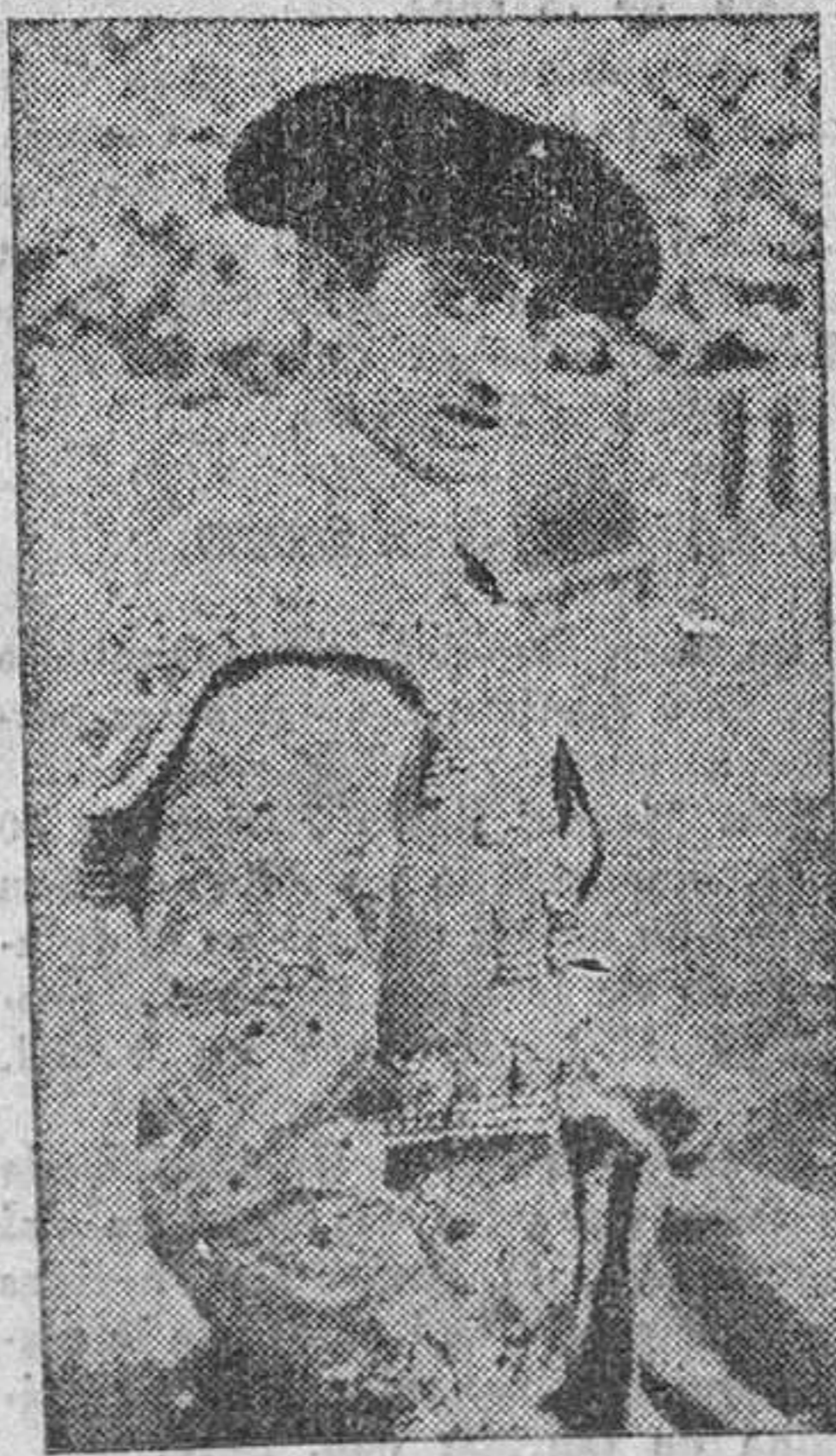
Al filo de la madrugada última, hoy hace siete años, exhaló el último suspiro de vida, quien en la vida fue caballero y señor del arte de la tauromaquia. Siete años, son muy pocos años todavía para que no vibre en la memoria de todos lo que ha de tener proyección de siglos en la historia taurina. Hoy se cumple el séptimo aniversario de la tragedia de Linares. Siete años, ya, que el cordobés Manuel Rodríguez Sánchez, «Manolete», consumió en el ruedo, con la muerte, la supremacía de su arte y su pundonor de caballero.

Santander, 28.—En la Universidad Internacional Menéndez y Pelayo se ha celebrado la clausura del Curso de Periodismo. Presidieron el acto el Director General de Prensa, Director General de Enseñanza Universitaria, Gobernador Civil y el Rector de dicha Universidad.