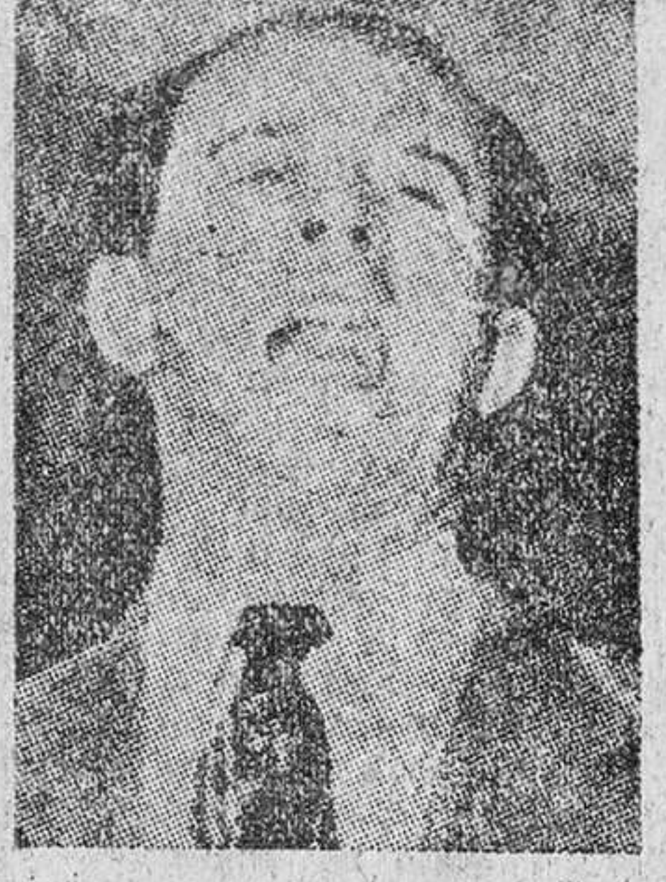
El expresidente comunista Arbenz, que se ha refugiado en la Embajada de Guatemala en San Salvador.

San Salvador, 29.—El expresidente de Guatemala, Jacobo Arbenz, ha llegado hoy a esta ciudad. Se dirigió inmediatamente a la Embajada de Guatemala.—Efe.