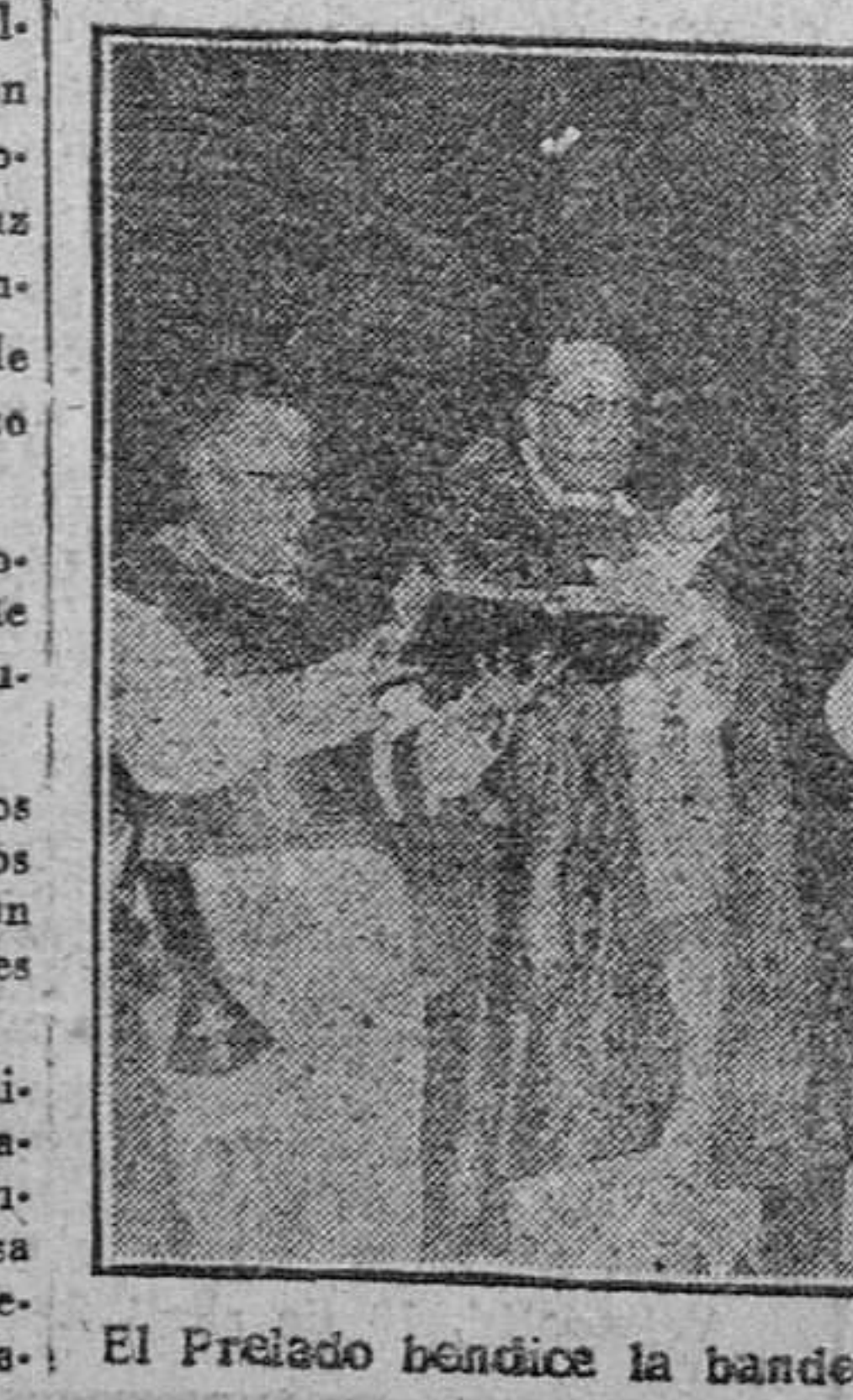
El Prelado bendice la bandera de la Junta pro Semana Santa.