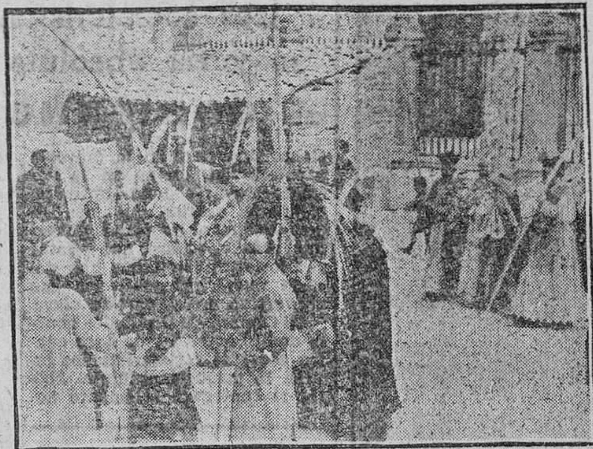
La procesión de las palmas. (Foto Juanes.)

Abria marcha la Banda de cornetas y tambores de la Cruz Roja, a la que seguía el típico Barandales, y figuraban también en este desfile procesional, la Banda Provincial, la del Colegio de San Fernando, de Madrid, y la del Regimiento de Toledo.