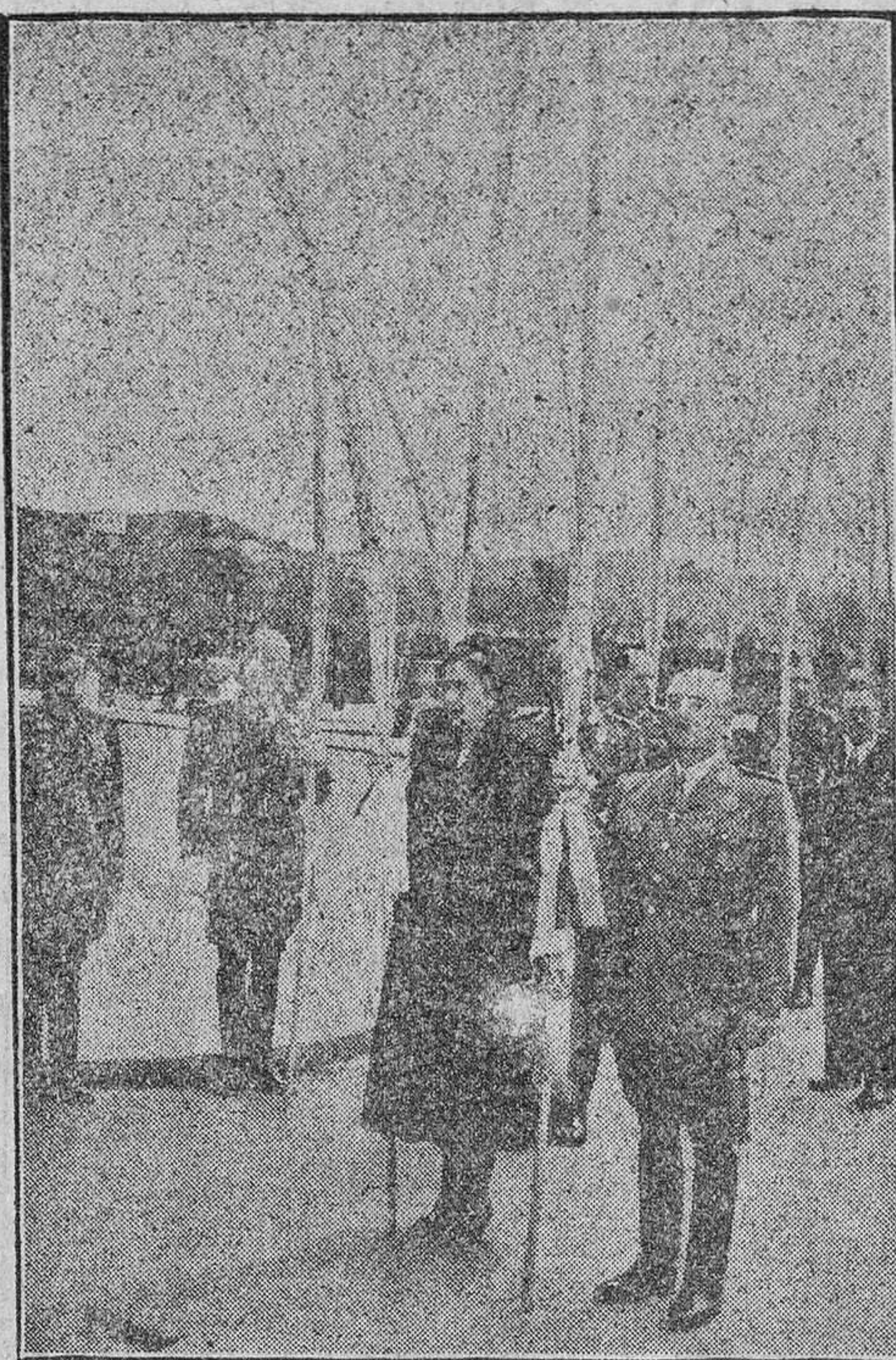
El Caudillo y su esposa durante la procesion del domingo por los jardines del Palacio de El Pardo.