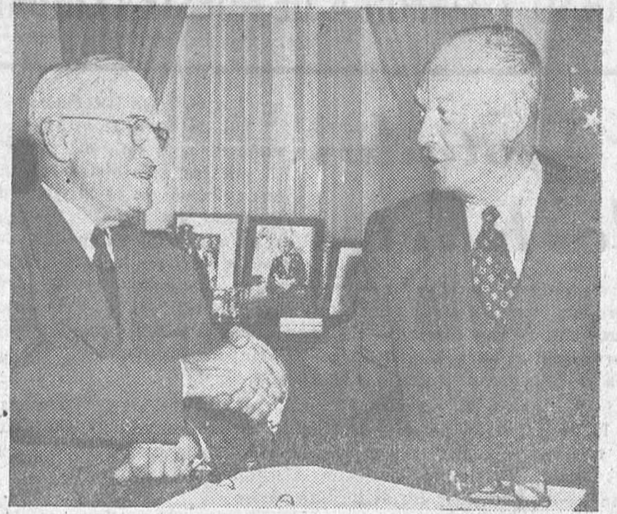
El presidente Harry S. Truman y el presidente electo Dwight D. Eisenhower conferencian en la Casa Blanca de Washington. Después de hablar a solas se reunieron con los Secretarios de Estado, Defensa, Hacienda, el director de Seguridad Muja, y los ayudantes del general Eisenhower, senador Lodge y Joseph M. Dodge. Después de la reunión se facilitó una nota en que se decía que se había tratado de algunos de los más importantes problemas relacionados con los Estados Unidos en la esfera de las relaciones internacionales, poniendo al general Eisenhower al corriente de los mismos.