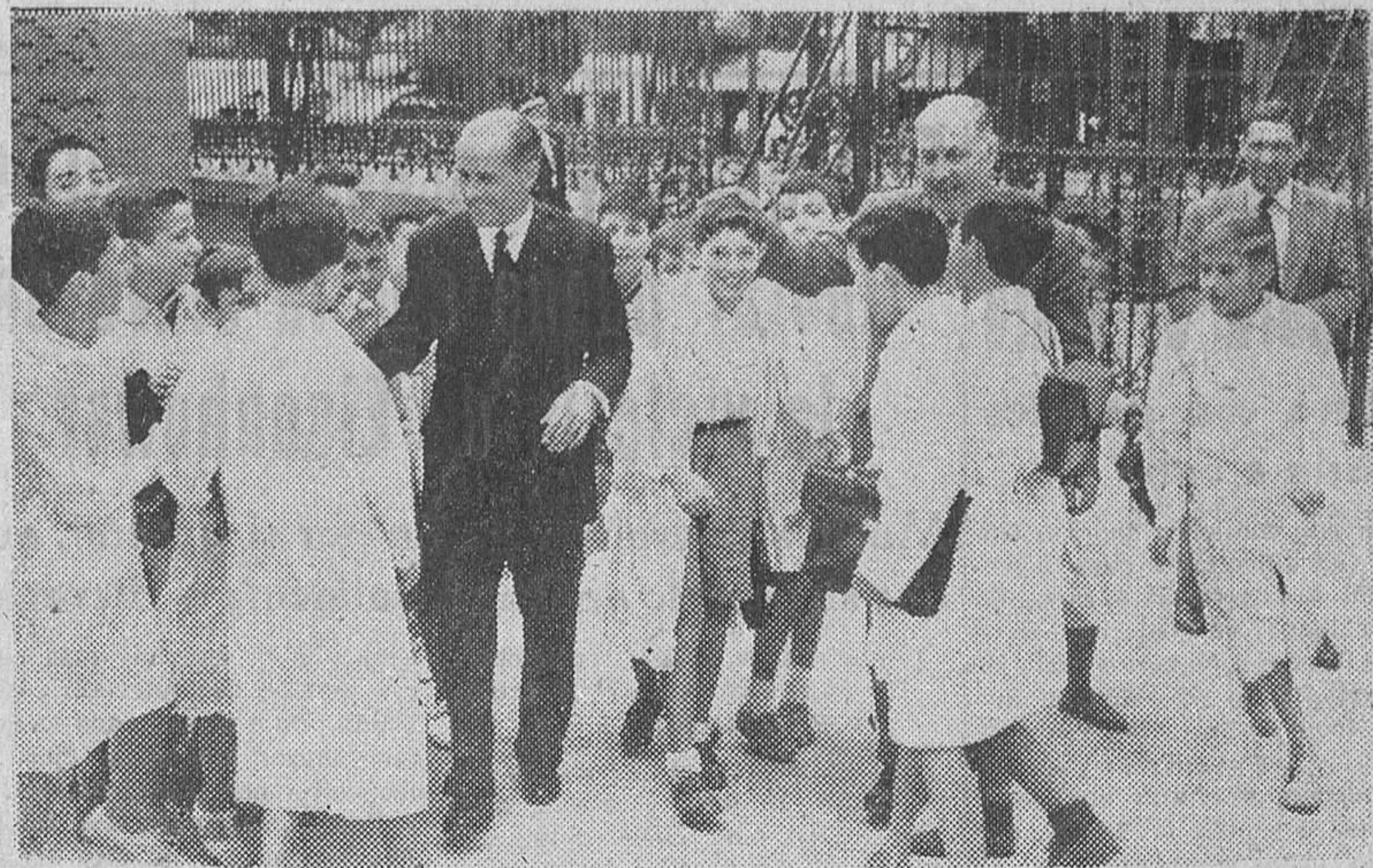
Han dado comienzo las clases en las escuelas públicas.—En la "foto", un grupo de alumnos acude presuroso a saludar a sus profesores en un colegio madrileño tras el paréntesis estival.