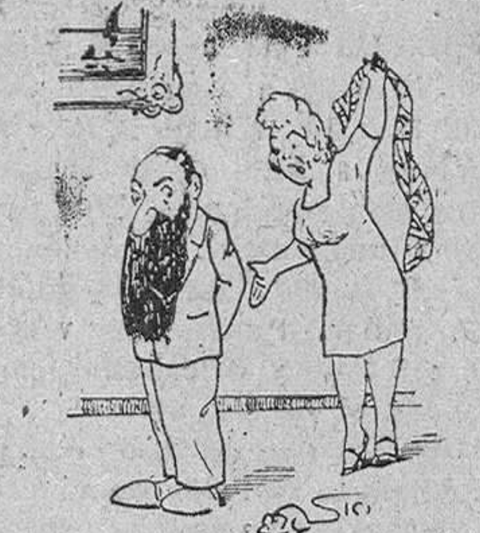
—Como te pongas esta corbata no salgo contigo.