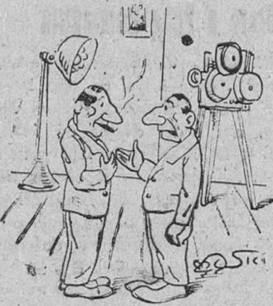
—Lo que no me explico es que haciendo el doble de Vd. gano la mitad.

Recordamos que al respecto, el filósofo Nietzsche, ha dicho: «Si vas con las mujeres no olvides la fusta». No se ha podido averiguar si este doctor está casado o no.—MAPA.