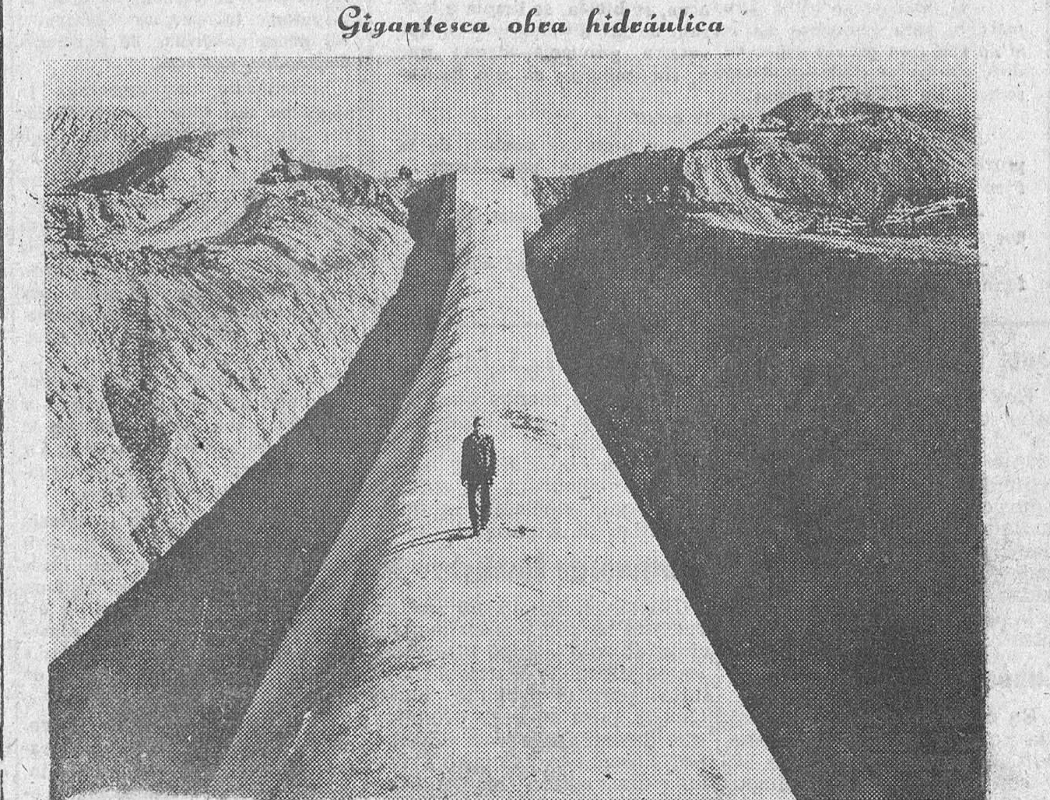
Gigantesca obra hidráulica

ALICANTE, 6.— Un soldado del Regimiento de Infantería de San Fernando número 11, de guarnición en esta capital, se ha quedado completamente ciego por espacio de varias horas a consecuencia de la impresión que le produjo el tomar su primer baño en la playa del Postiguet de esta ciudad. Ante lo inusitado del caso, fué trasladado rápidamente a la Casa de Socorro donde se le prestó asistencia facultativa. El médico de guardia dicta-