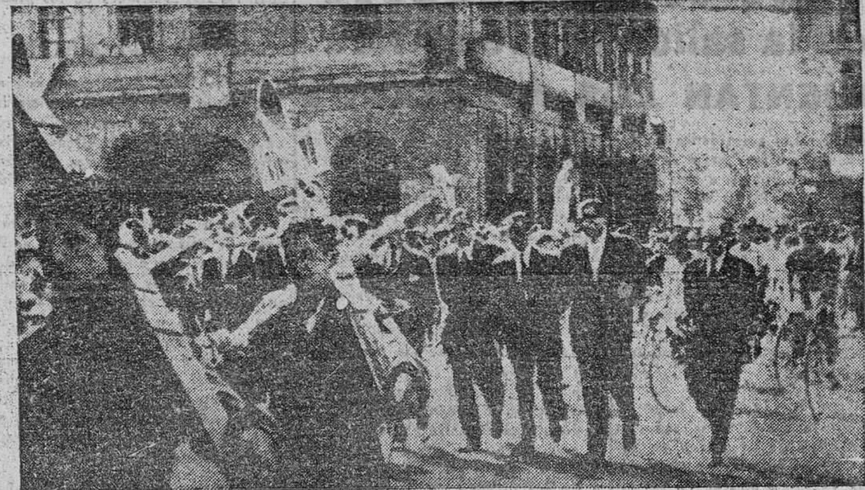
Con motivo de la consagración de Navarra al Inmaculado Corazón de María, los deportistas de Pamplona y su provincia tomaron parte en un desfile incluido en los actos celebrados.