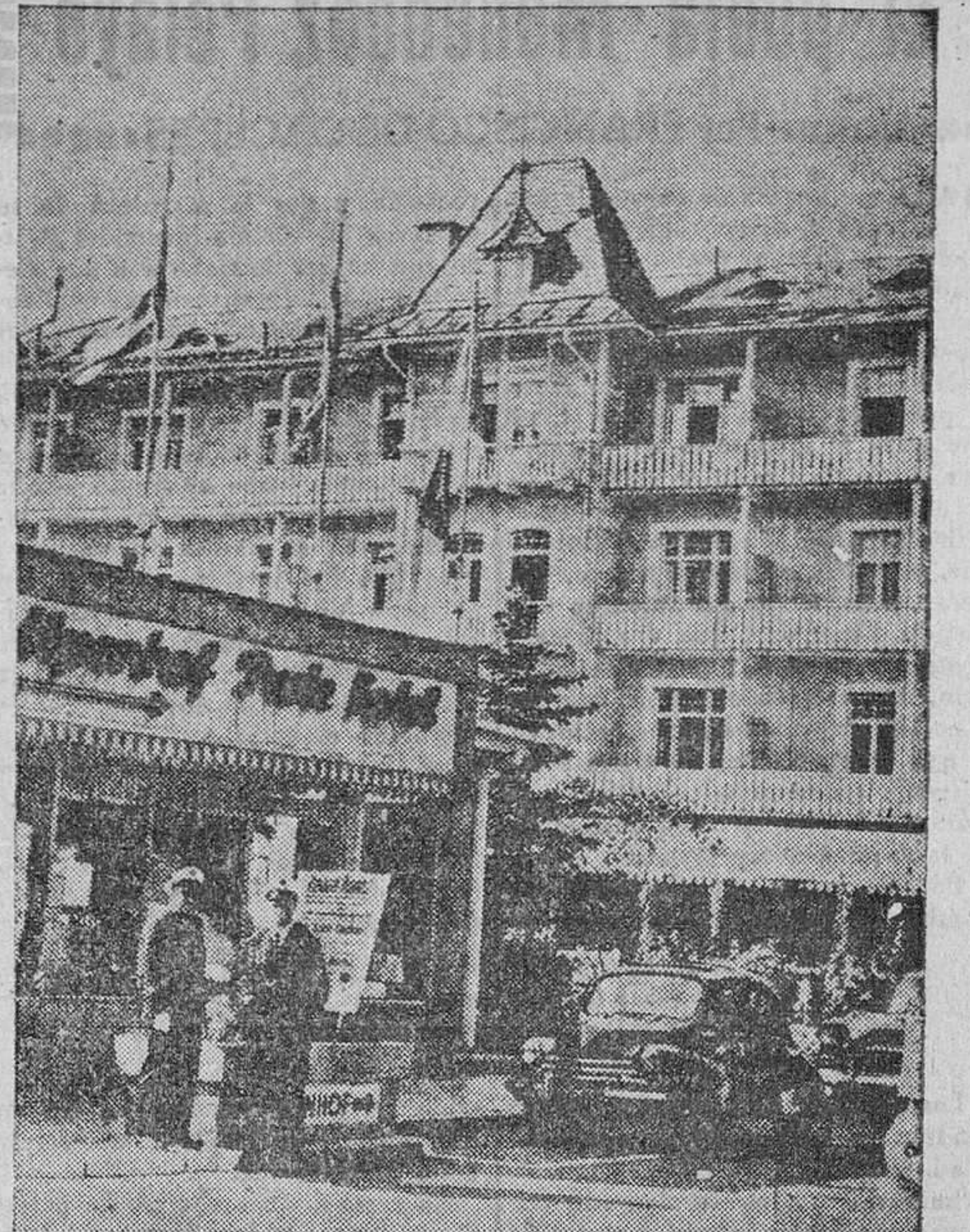
En los últimos días de septiembre se ha iniciado una conferencia secreta entre diplomáticos del Este. He aquí la sede de las reuniones en el Alpenhof, de Garmisch-Partenkirchen.