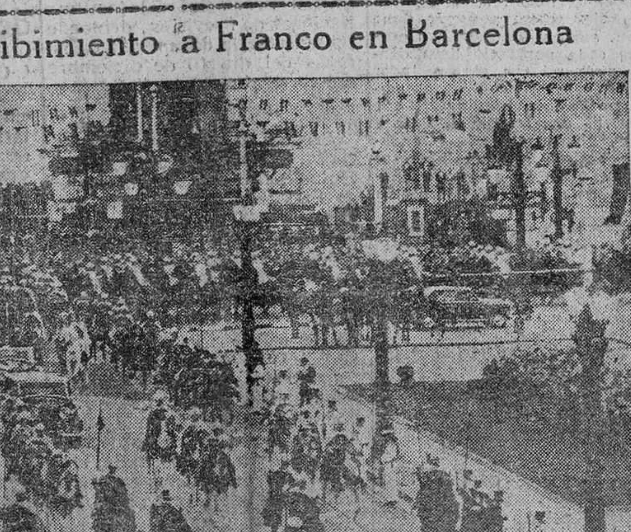
Triunfal recibimiento a Franco en Barcelona

Parece que por redactar a bordo del cañonero un mensaje al pueblo argentino, violando la doctrina de hospitalidad