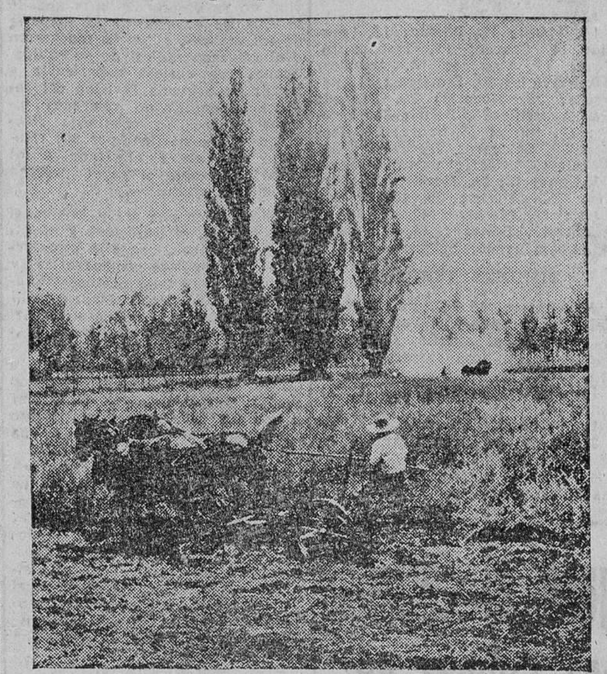
Sobre el campo h'ende la grama el arado para dejarla pudrirse sobre la propia tierra, que luego quedará favorecida con elementos fertilizantes de lo que en ella misma nació y que más tarde servirá para favorecer el crecimiento lozano de lo que para el otoño se siembra.