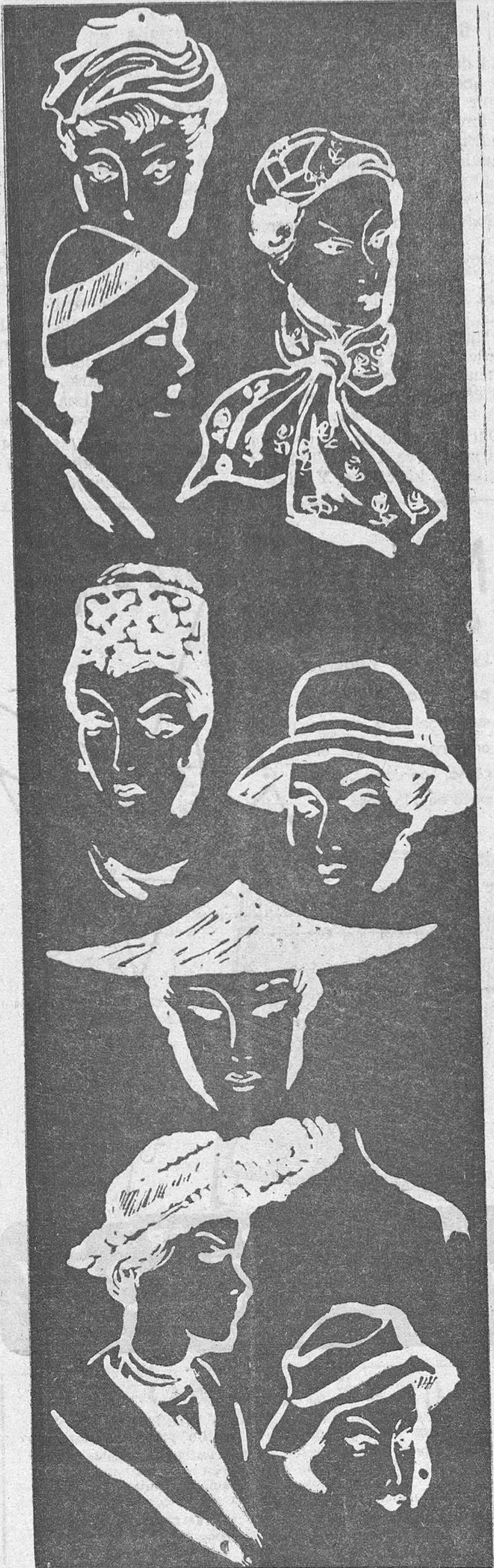
Un sombrero para cada rostro

Se escaman y se limpian 600 gramos de salmonetes, se ponen en adobo con aceite y limón después de sazónarlos con sal y se asan a la parrilla. Luego se colocan en el centro de una fuente y se esparce por encima perejil picado. A su alrededor se ponen patatas fritas muy finitas. En una salsa se sirve salsa de tomate.