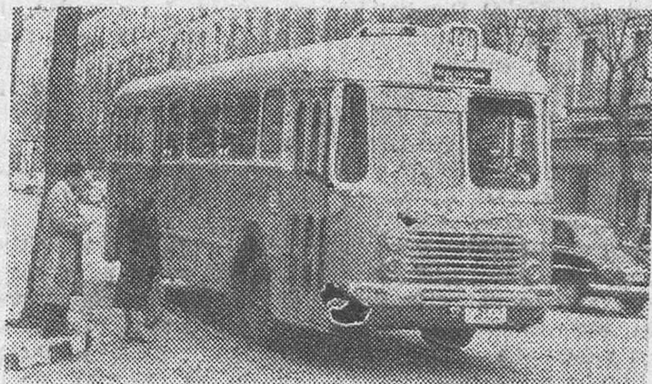
HA SALIDO EL "101 A" He aquí uno de los nuevos autobuses adquiridos por la Empresa Municipal de Transportes de Madrid, que presta servicio en la línea suplementaria "101 A", establecida con objeto de reforzar la línea número 1. Cubre el trayecto plaza del Callao-San Cayetano.

Desde hoy en adelante vamos a decirnos todo lo que nos ocurra a unos y a otro que para eso hablamos el castellano, que es hijo del latín, nieto del griego y biznieto del sánscrito. Y sería una pena no entenderse con tanta nobleza encima de la voz. El "Chaquetas" y el "Pinocho", como yo, como todos los que confundimos las flores con los piropos, sabemos que a una vida mejor—como a las mejores mujeres—hay que acercarse con cultura. Y allá vamos.