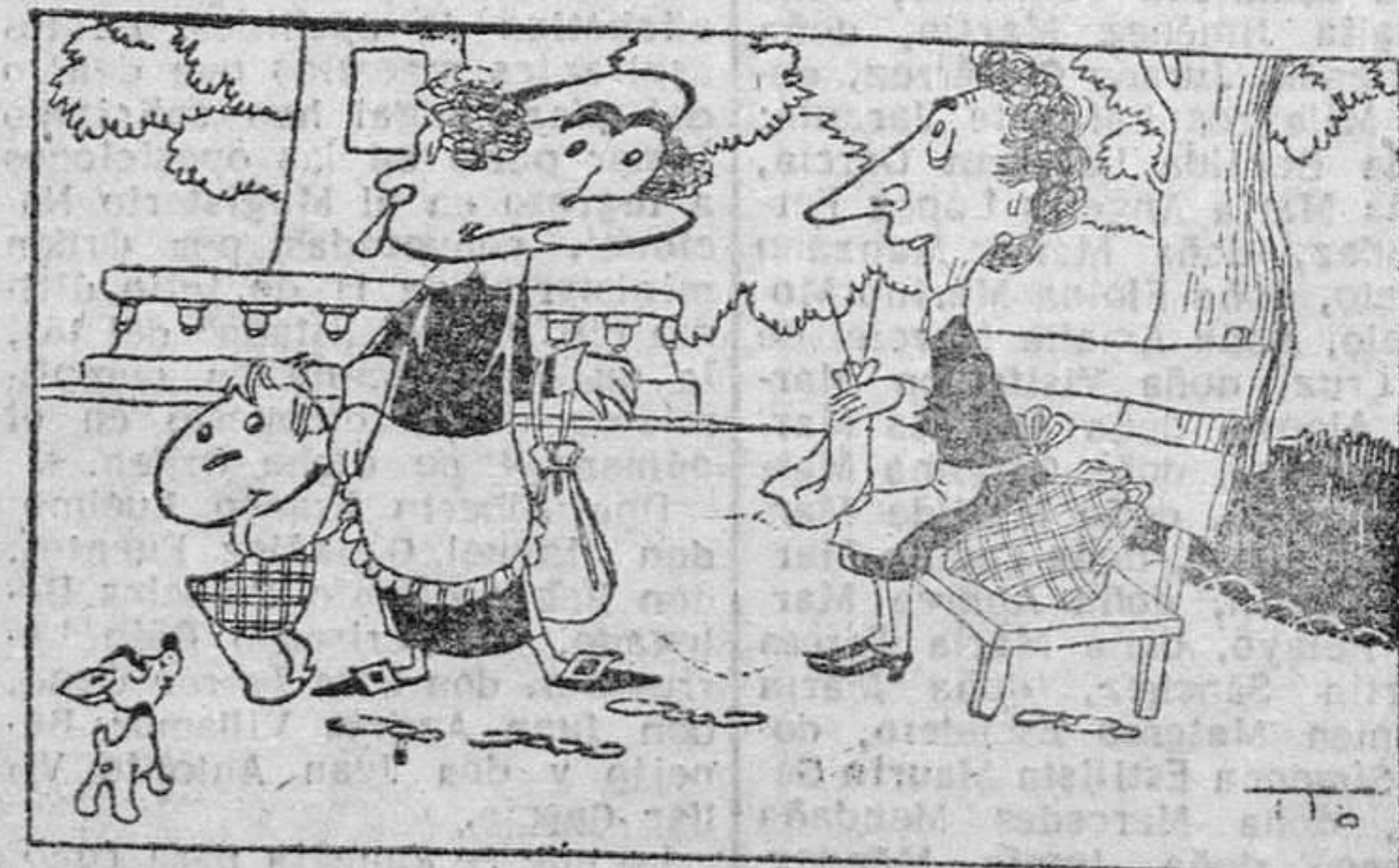
—Si, antes era eso, pero desde que está el tiempo así, soy zma seca.