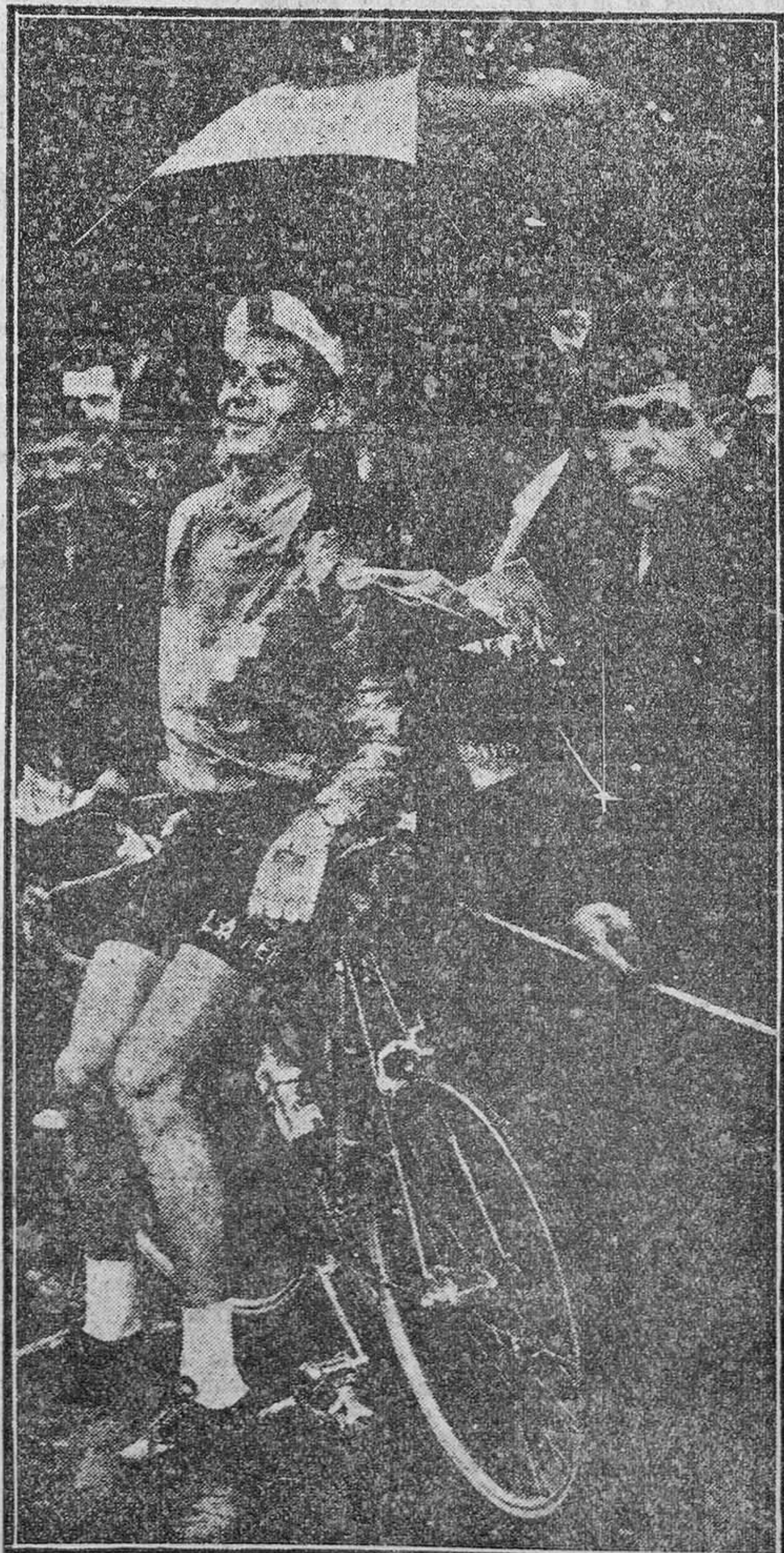
Ahora que el "Tour" está en su punto culminante damos esta foto del suizo Hugo Kohlet, gran favorito hasta que quedó tendido sobre el asfalto, lesionado de gravedad. Entonces la lluvia le hacía sonreír, bien ajeno, indudablemente, a que poco después tendría que seguir la Vuelta a Francia desde las primeras páginas de los periódicos.