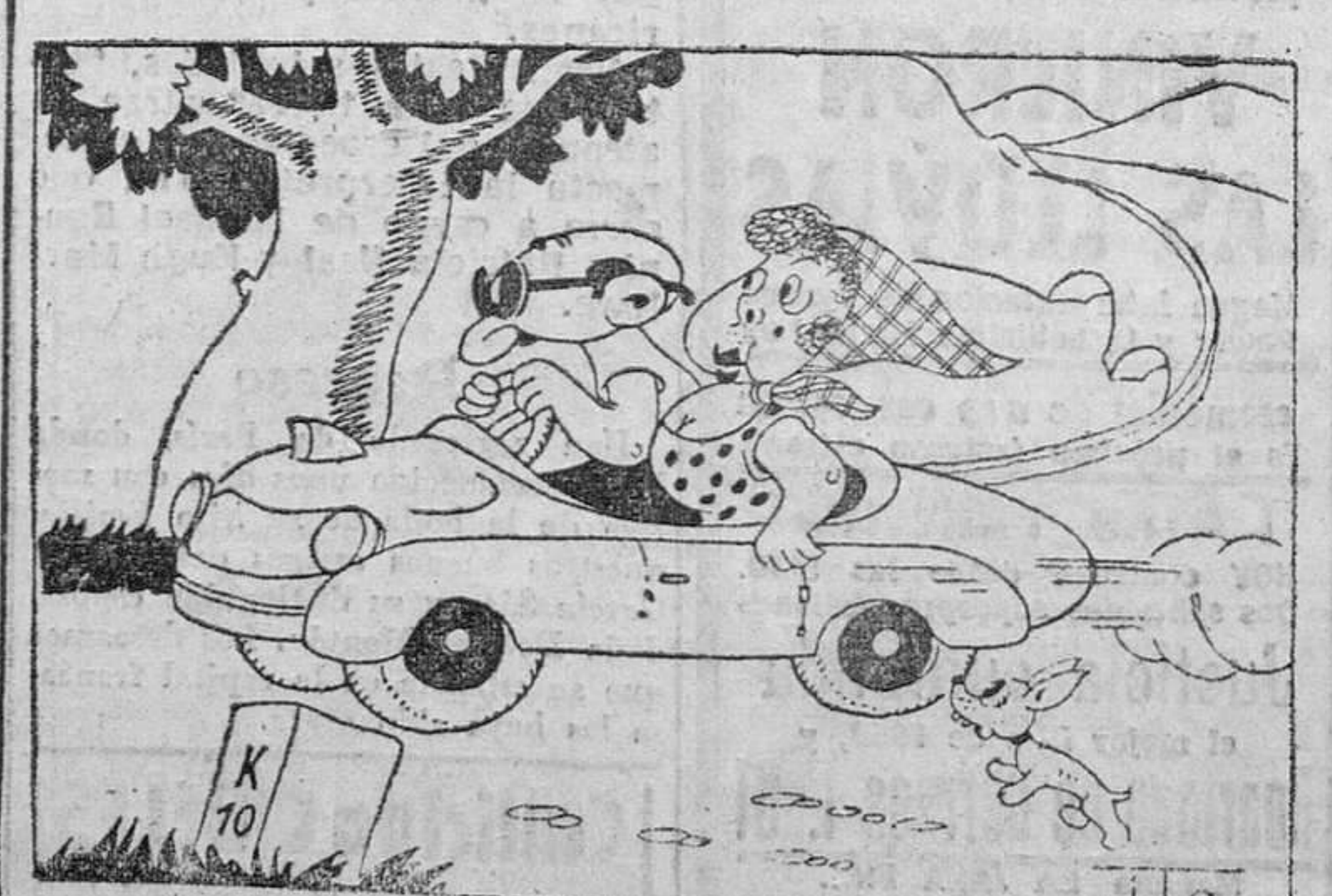
—¡Por favor, Pepe, no corras así; sabes que no me gusta pasar de los treinta!