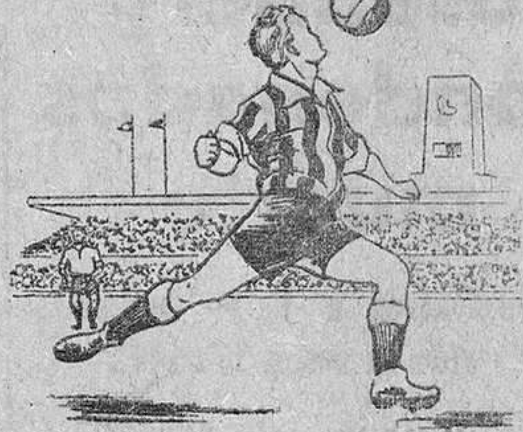
avanza con el balón y su caballo al viento.