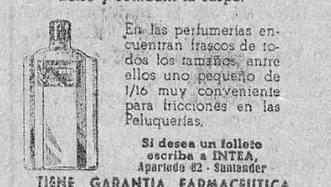
TIENE GARANTIA FARMACEUTICA

Muchos médicos la usan y recomiendan para cuidar el cabello y combatir la caspa.