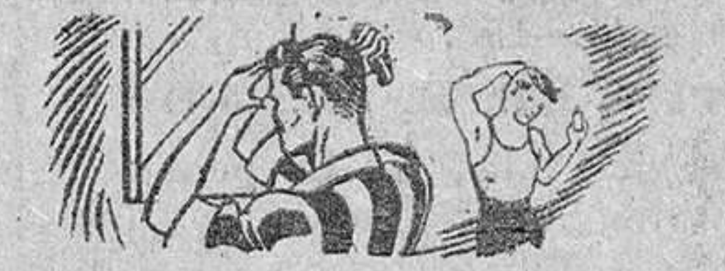
Unas gotas diarias de