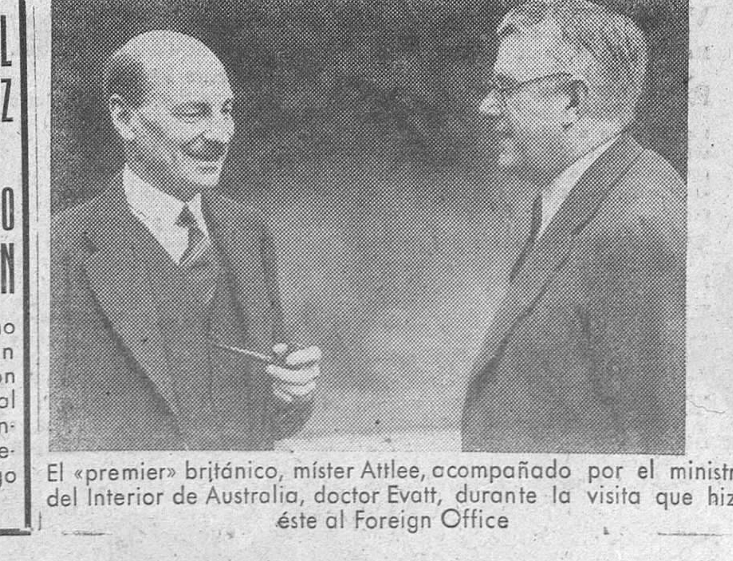
El «premier» británico, mister Attlee, acompañado por el ministro del Interior de Australia, doctor Evatt, durante la visita que hizo éste al Foreign Office