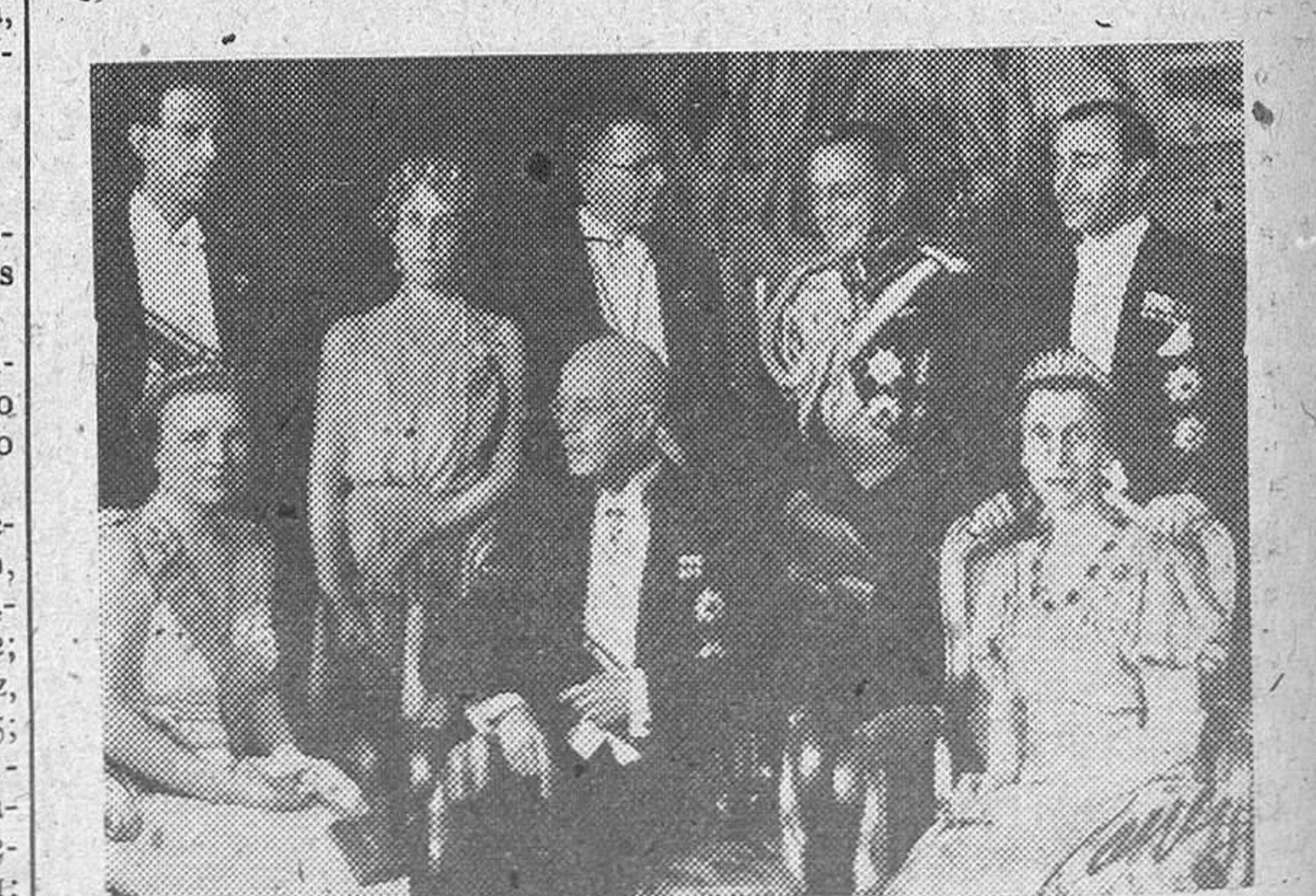
La figura del rey Gustavo de Suecia, representante de aquella Monarquía nórdica, se ve siempre con simpatía en todas las manifestaciones de su vida pública y privada. Con motivo de la reciente visita de los príncipes de Holanda, el rey de Suecia ofreció una comida en su honor en el Real Palacio de Estocolmo. Aparecen en la foto en primer término, la princesa Juliana de Holanda, el rey Gustavo y la princesa Luisa, heredera del Trono de Suecia; de pie se hallan el príncipe Guillermo, la princesa Ingeborg, Gustavo Adolfo, príncipe heredero de Suecia, Bernardo, príncipe consorte de Holanda y el príncipe Gustavo Adolfo.