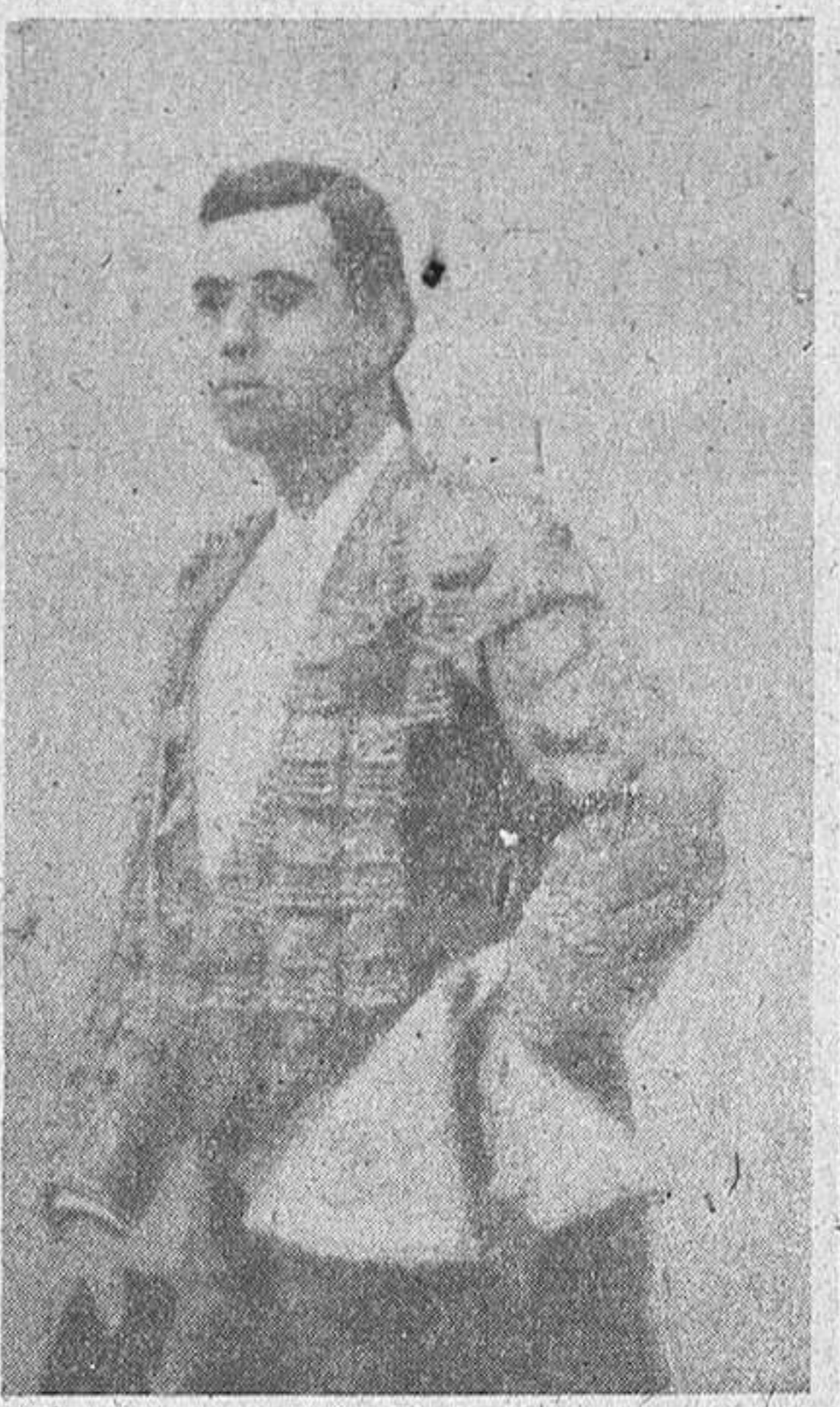
«Serranito», el torero sevillano muerto en Madrid en 1908, a consecuencia de la grave cornada que le infligió en Astorga un toro de la ganadería zamorana de don Santiago Neches.

Santiago Neches tuvo la atención de saludar en su pensión de la calle del Prado 10, hotel de doña Mercedes Rendón, a cinco paisanos, estudiantes todos a los cuales las fiestas de la coronación les sorprendieron sin blanca y sin recursos ya para adquirirla. Estaban resignados a los festejos callejeros y a corretear