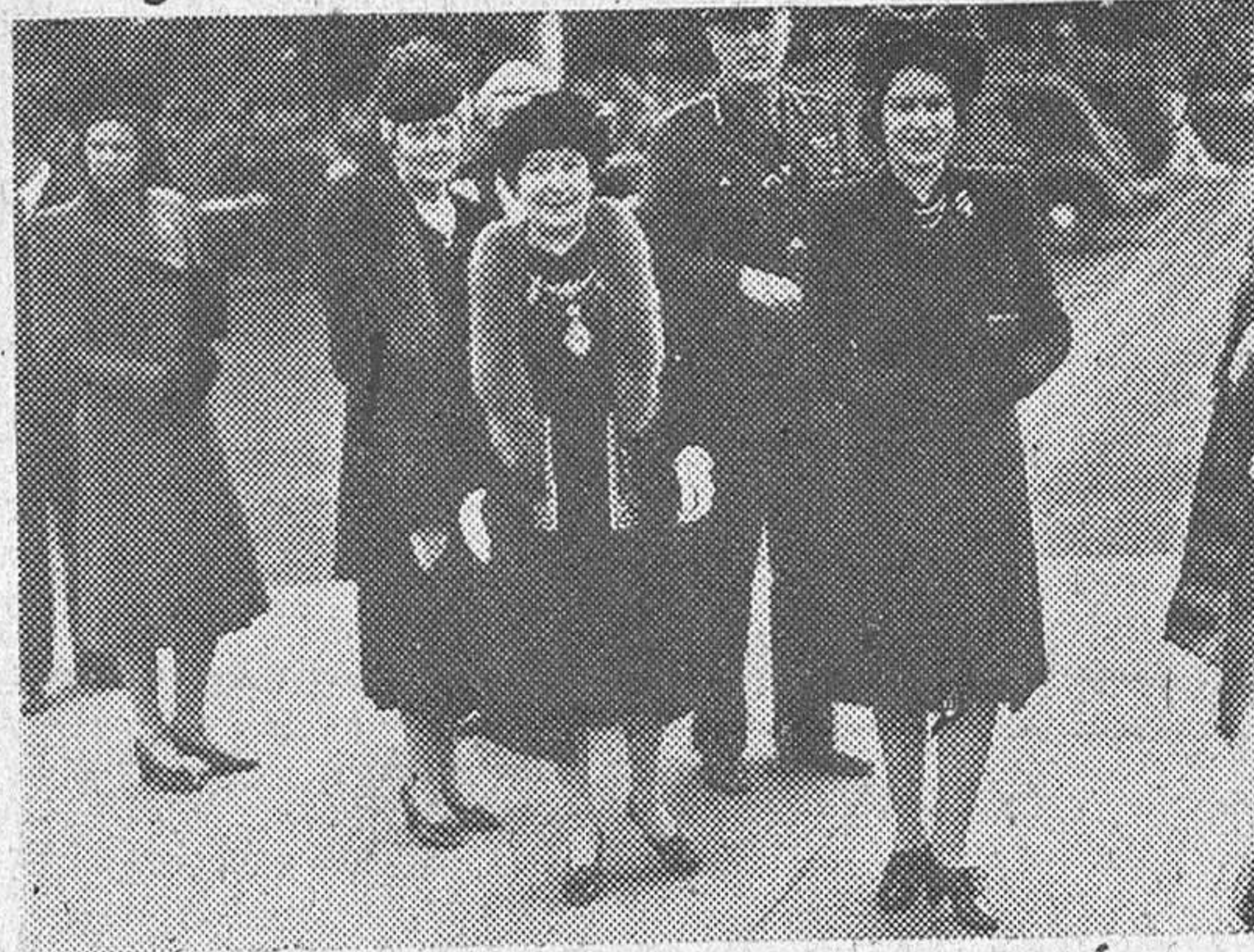
He aquí a la princesa Isabel de Inglaterra que realiza una vida activa de constante contacto con su pueblo. La princesa ha sido aclamada últimamente en Nottingham donde fué tomada la foto que publicamos. Acompañan a la joven heredera del trono británico el lord mayor de la ciudad y otras altas personalidades.