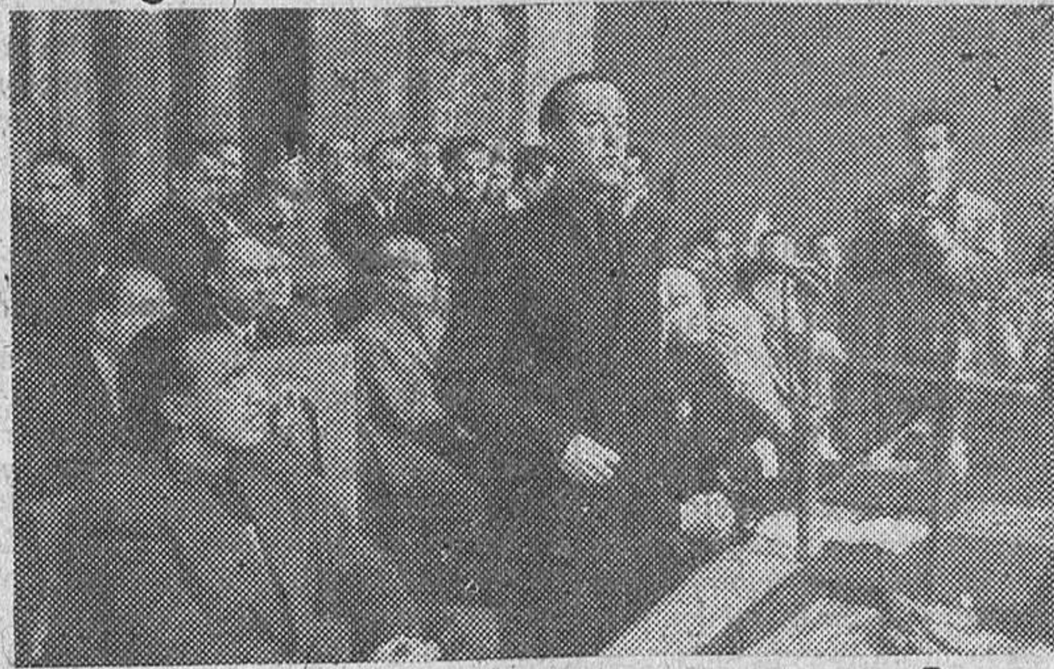
En el Frontón Recoletos de Madrid se celebró un grandioso acto sindical en el que fueron proclamados los representantes de las organizaciones sindicales en las Cortes Españolas. El delegado nacional de Sindicatos pronunció un interesante discurso entre el entusiasmo de los productores.