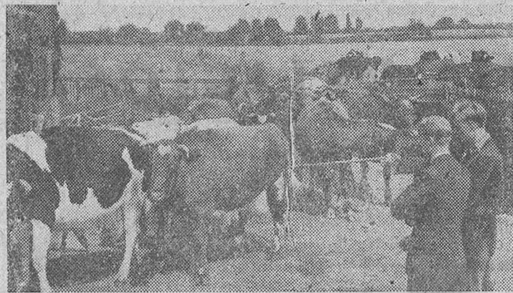
Algunas Universidades inglesas poseen sus propias haciendas para las clases prácticas de la Agricultura. Aquí vemos a dos estudiantes ingleses examinando las reses