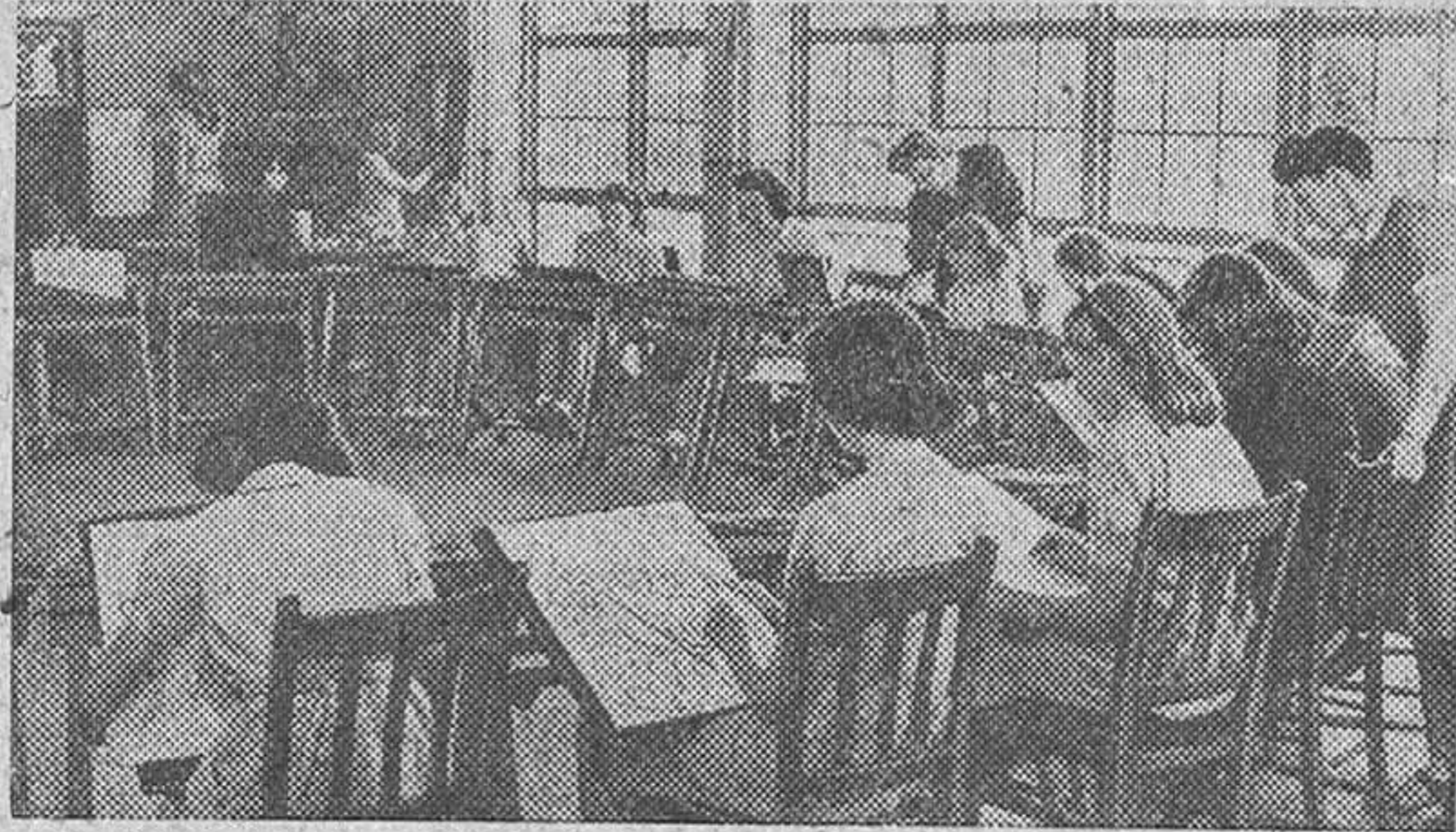
La clase de pintura de una escuela femenina inglesa de Kendrick