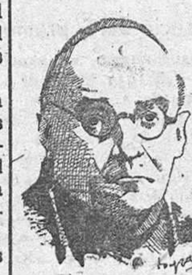
El arzobispo de Toledo, Primado de España, doctor Plá y Deniel