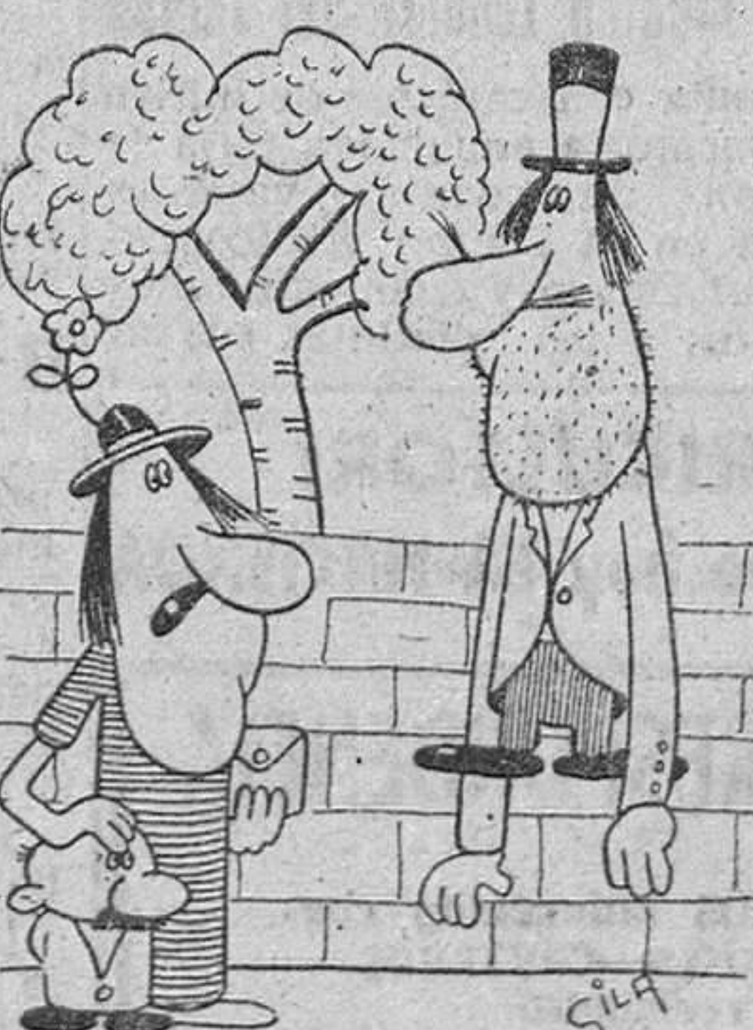
—Parece mentira que con las piernas tan cortas sea usted tan alto...

Los niños, que lucían hermosos trajes blancos, recibieron la comunión de manos del señor párroco de Muelas de los Caballeros, quien les dirigió una sentida plática. Los pequeños comulgantes fueron acompañados en la Sagrada Mesa por sus padres, a los que expresamos nuestra enhorabuena.