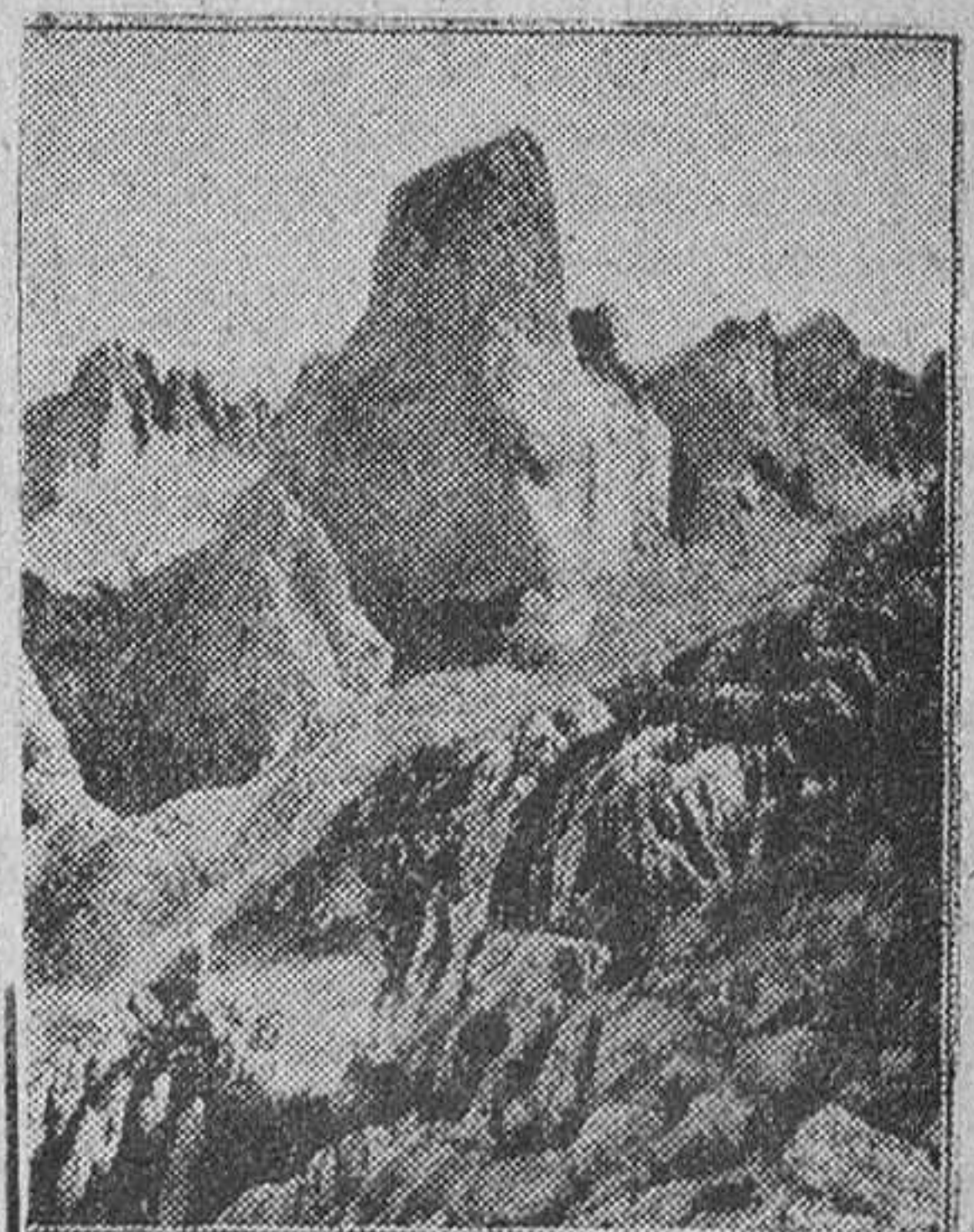
EL NARANJO DE BULNES

En cada marcha nos evadimos de las delicias del valle para recluirnos, a las veces por tres días consecutivos, en aquella soledad de cumbres blancas sólo turbada por tempestades petrificadas. En