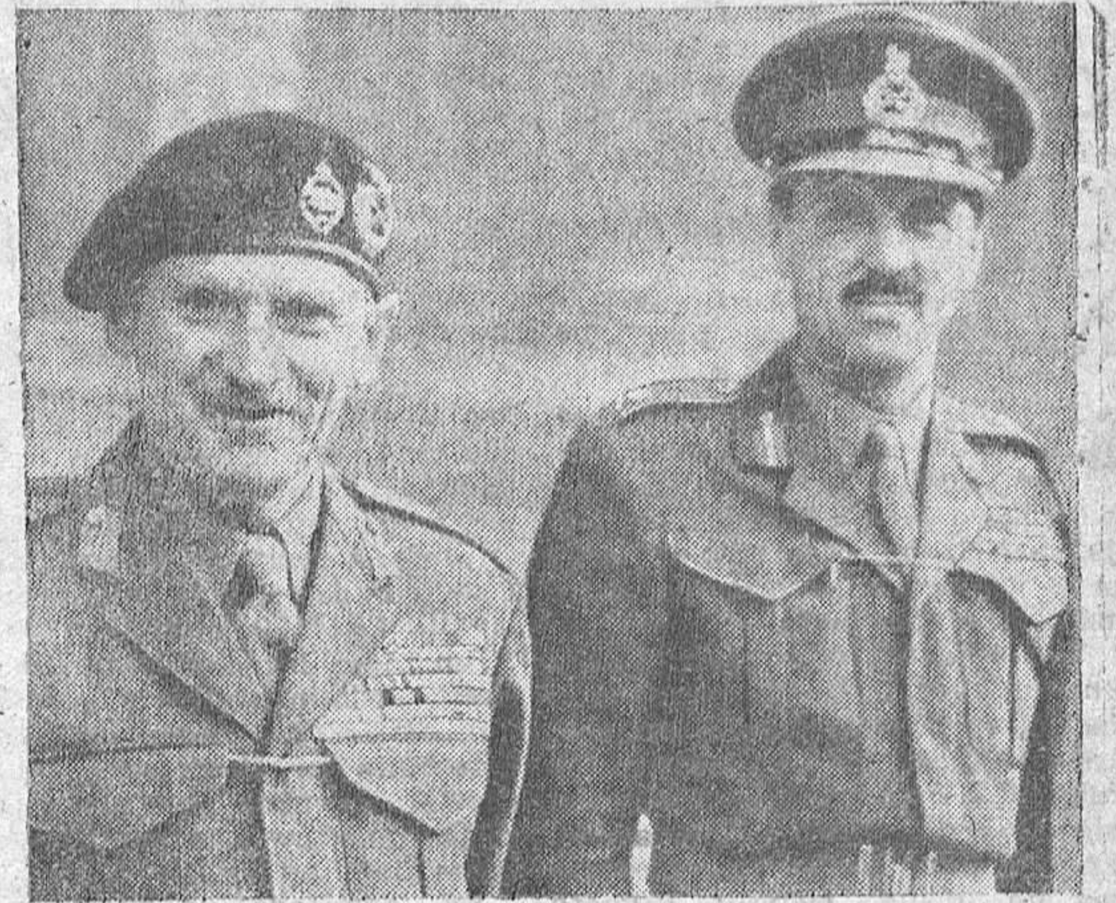
El Mariscal Vizconde Montgomery con el Jefe de su Estado Mayor, Brigadier Ronald Bolham, el General más joven del Ejército Británico

Igual que el héroe de "Adiós a las armas", combatió en el ejército Italiano de 1914 a 1918. En 1944 encontró, estropeada por el tiempo, una