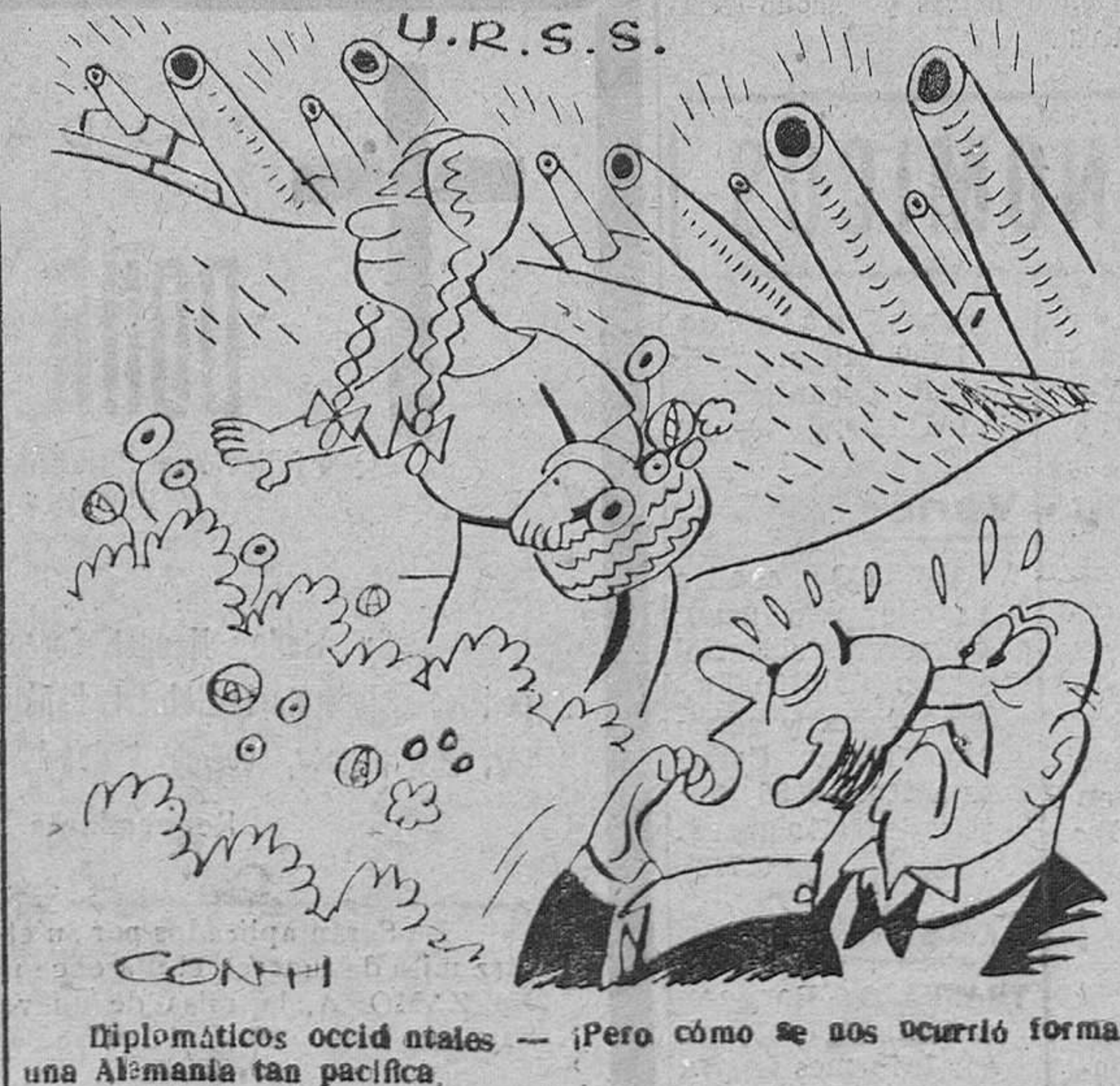
Diplomáticos occidentales — ¡Pero cómo se nos ocurrió formar una Alemania tan pacífica.