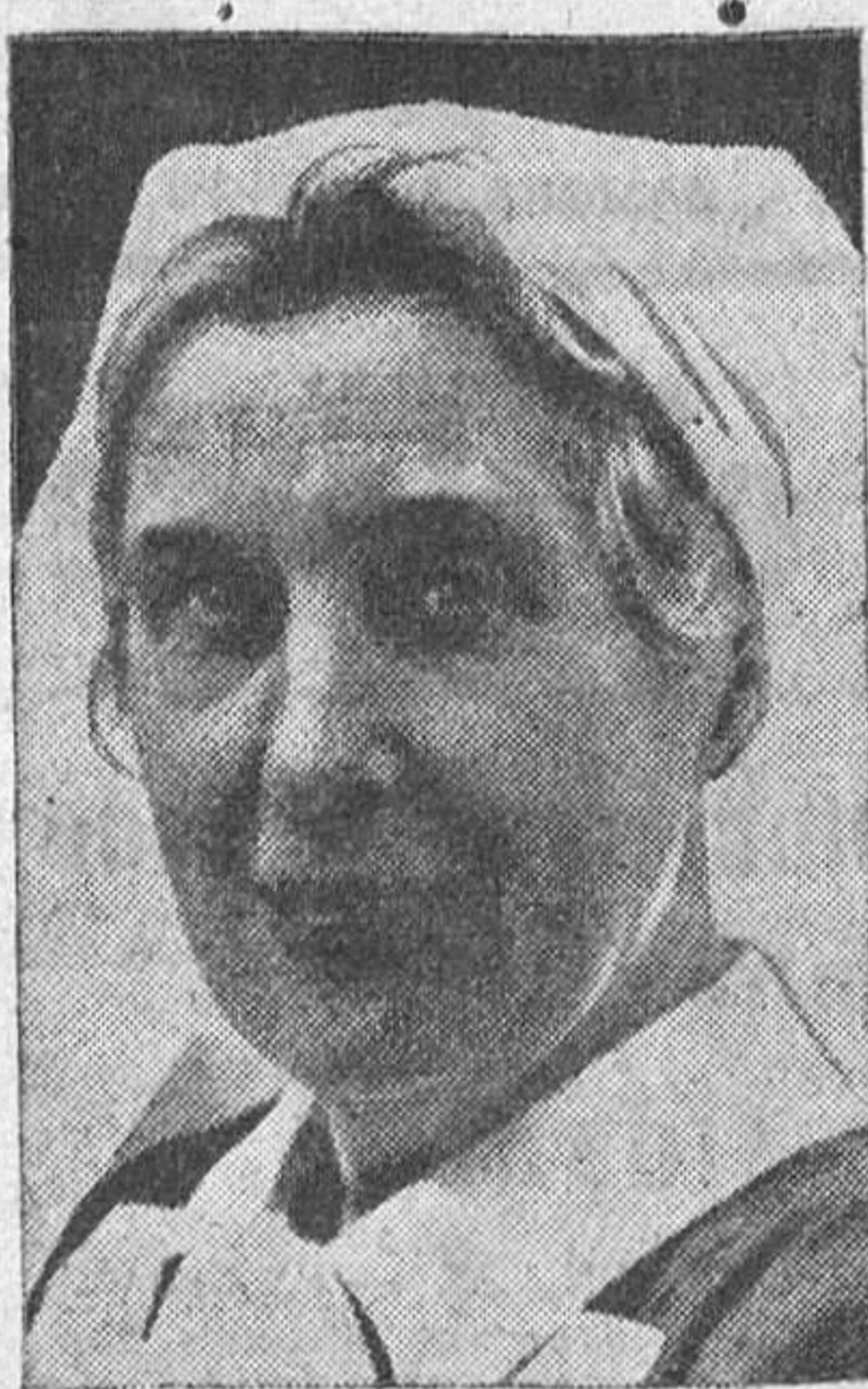
La Hermana Kenny realiza una labor constante para combatir la parálisis infantil. Ella ha ideado uno de los más interesantes procedimientos para lograr la recuperación funcional de los miembros que la enfermedad dejó paralizados.

El agente productor de esta enfermedad es un virus filtrable de los más pequeños, ya que su talla