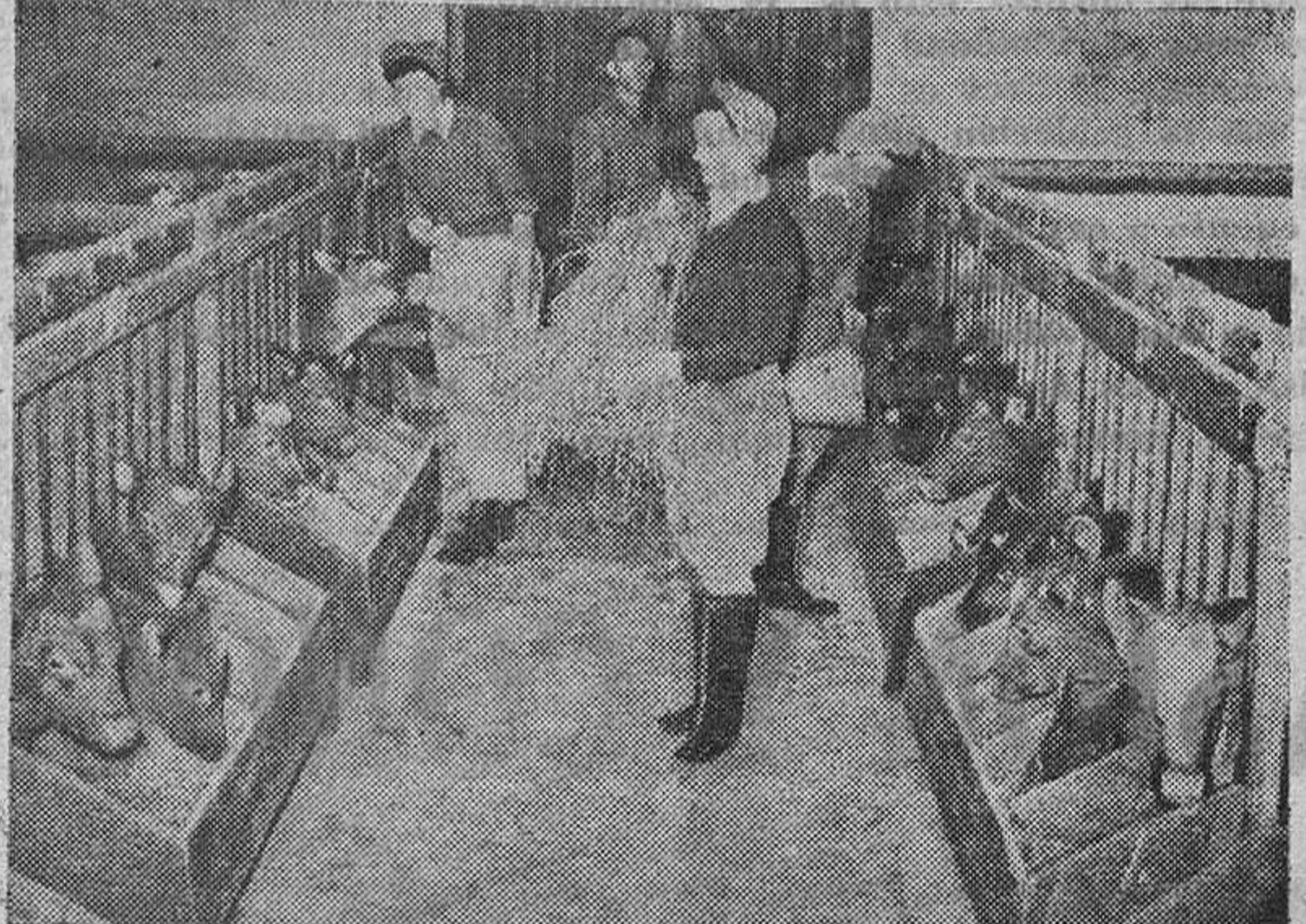
Un buen establo—como el del grabado, que puede reputarse modelo—es indispensable en ciertas explotaciones ganaderas. Las lindas granjas que aparecen en la fotografía no son absolutamente imprescindibles

Pero estas cualidades o aptitudes económicas que llevan los animales en la masa de su organismo son variables de unas reses a otras, y asimismo se transmiten de los padres a las crías en virtud de la llamada "herencia biológica". Y lo mismo se transmiten las buenas que las malas aptitudes económicas, cuyo modo de transmisión se conoce ya con alguna extensión, aunque se continúa trabajando en estaciones pecuarias y granjas experimentales en el estudio de esa transmisibilidad a fin de difundir sus resultados entre los ganaderos y que éstos puedan utilizar esos conocimientos en la obra de mejora ganadera. Mas considerando de modo sencillo la actuación del ganadero frente al problema de mejorar las cualidades de sus reses, debemos resaltar que esta mejora solamente se obtiene con el tiempo, y siempre se apreciará si efectivamente se ha logrado comparando la productividad individual de los padres con la de sus hijos adultos, o la producción global del rebaño cada cierto intervalo de