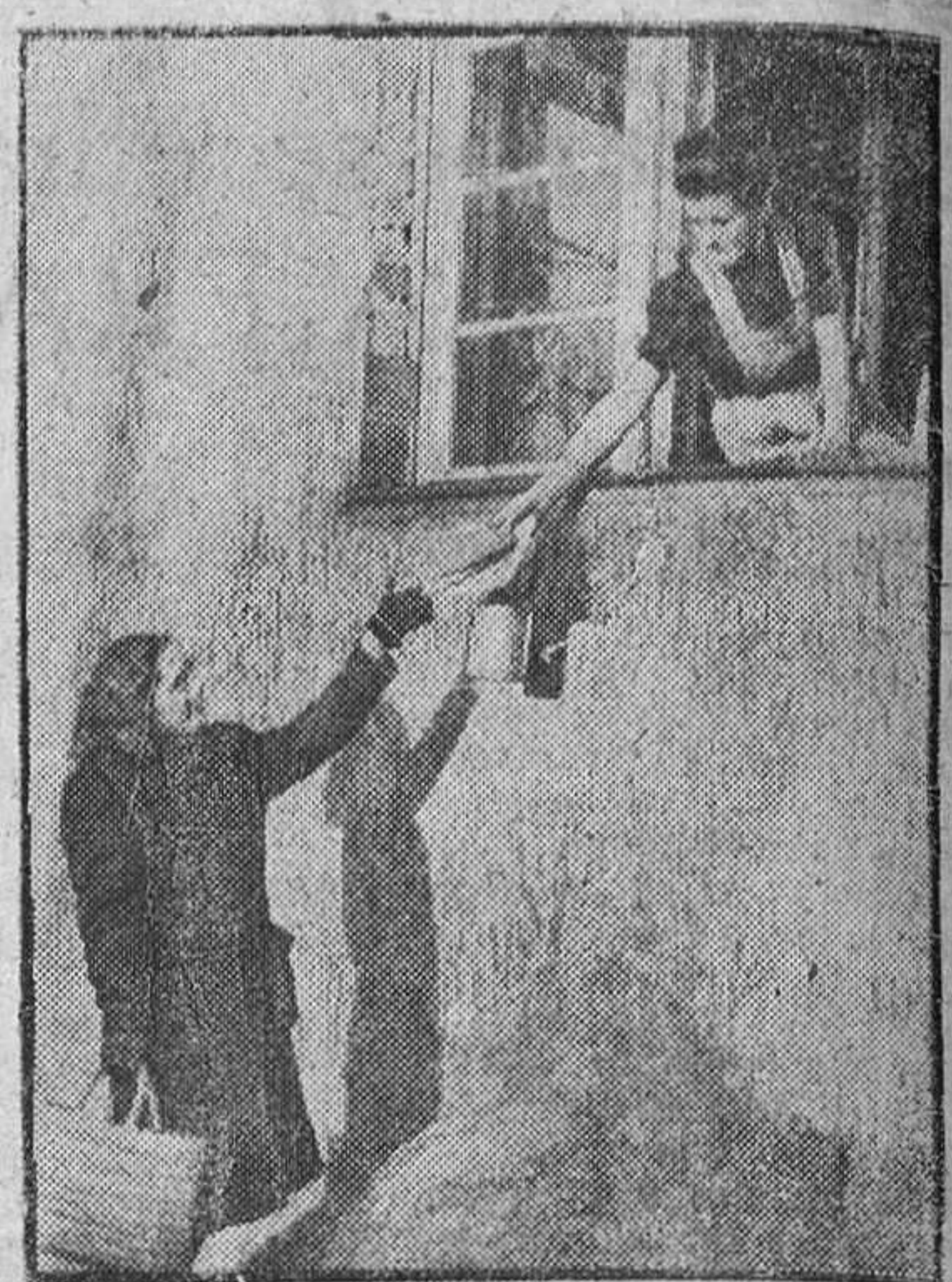
Siempre encuentra la mujer ocasión para cambiar impresiones.

RECUERDO que cuando yo era muchacho los inquilinos de los distintos pisos de una casa generalmente se visitaban con frecuencia y eran amigos. Cuando llegaba un nuevo pasaba tarjeta a los demás y estos pasaban a visitarle.