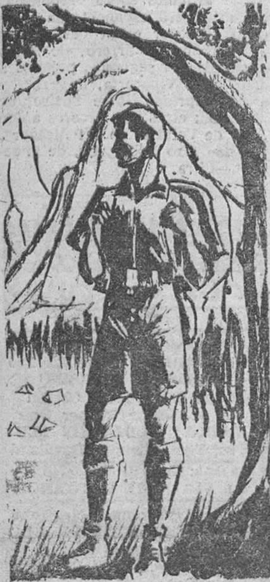
UN REPORTAJE EN SEXTA PAGINA

600 muchachos del F. de J. de Zamora, irán a los Campamentos de Verano. En ellos se forma integralmente la juventud