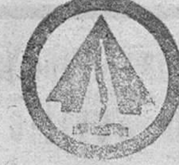
campamento provincial de San Pedro de las Herreñas, donde

El otro, "San Ignacio de Loyola", que recorrerá la región sanabresa. Este campamento llevará profesionalmente la imagen de San Ignacio de Loyola hasta la capilla del campamento provincial de San Pedro de las Herreñas, donde