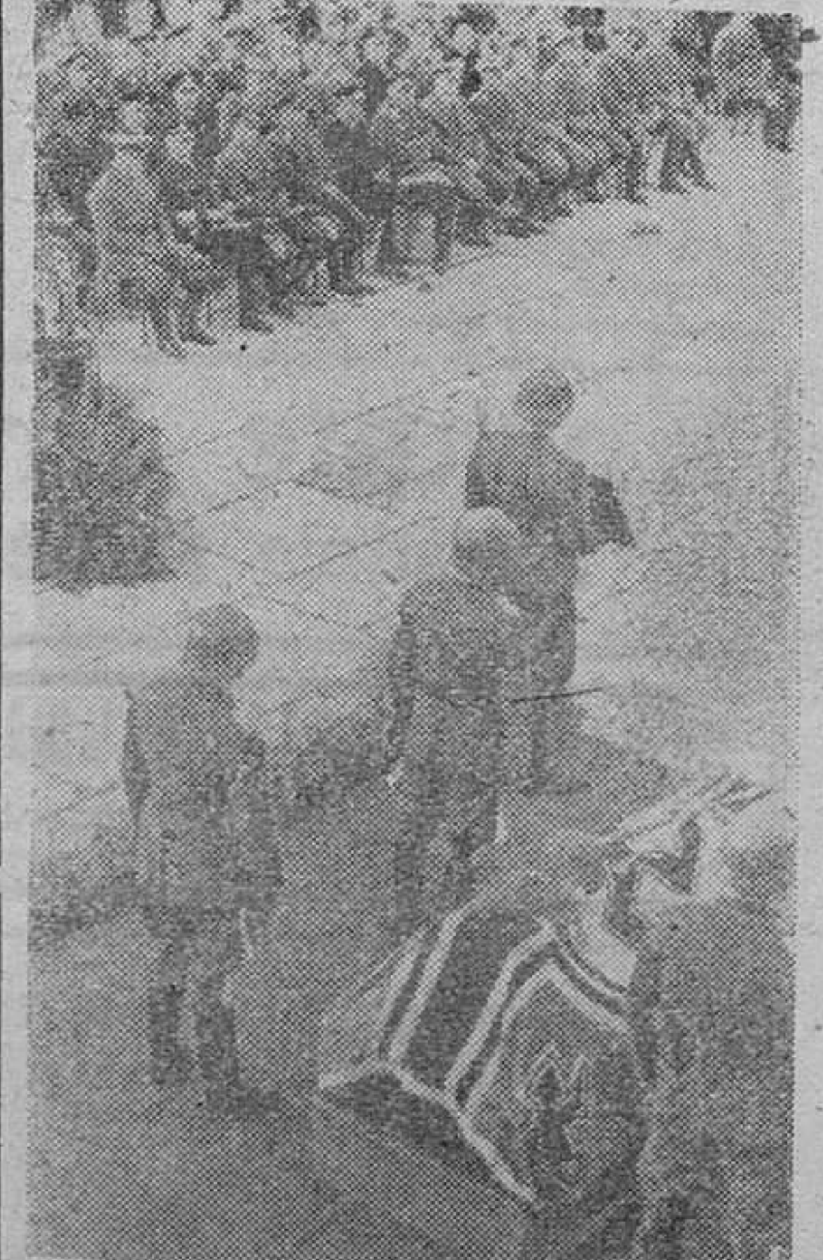
Recientemente tuvo lugar en Alemania un acto en memoria del teniente general alemán Korten, que murió en el atentado contra el Führer