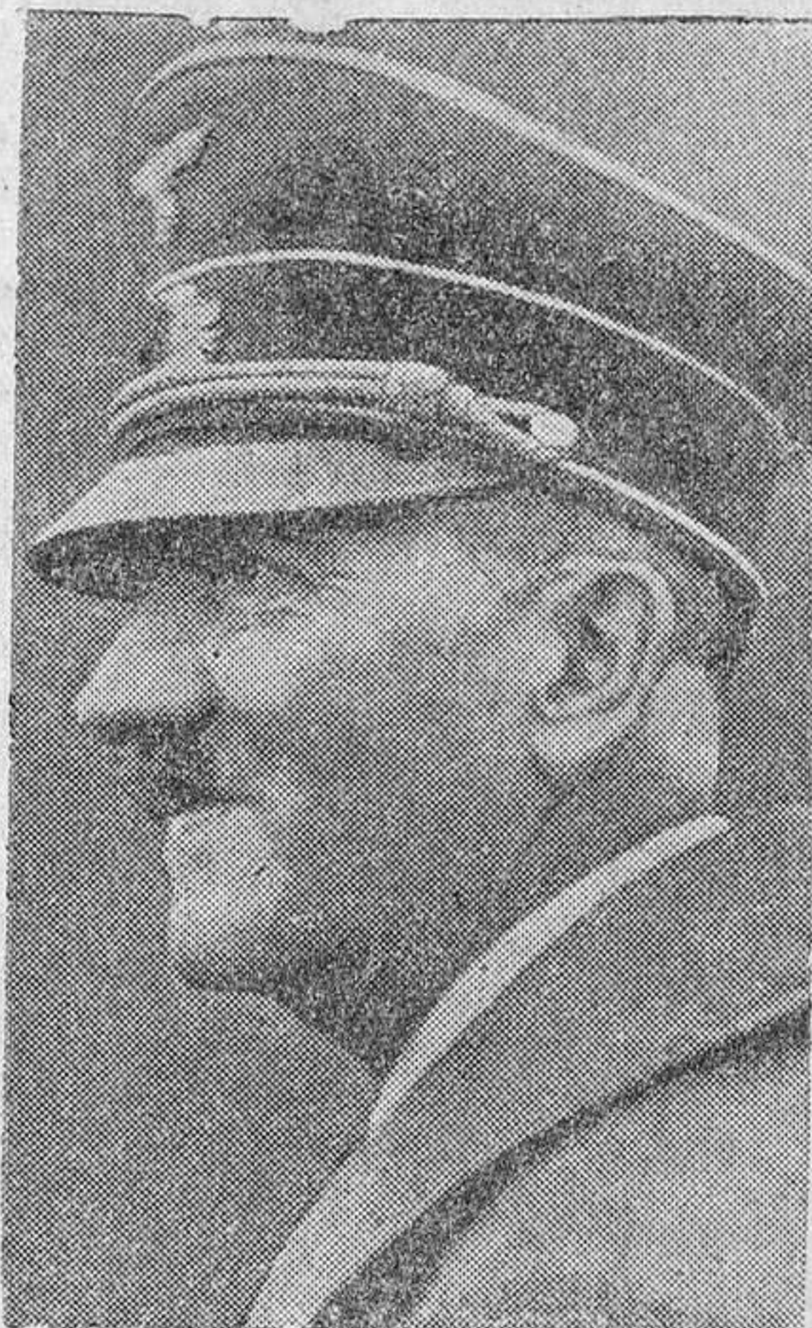
EL JEFE DEL ESTADO MAYOR DEL EJERCITO ALEMAN CON HERIDAS LEVES

Poco después de cometerse el atentado llegó el mariscal del Reich, Hermann Goering, al lado del Führer.—Efe.