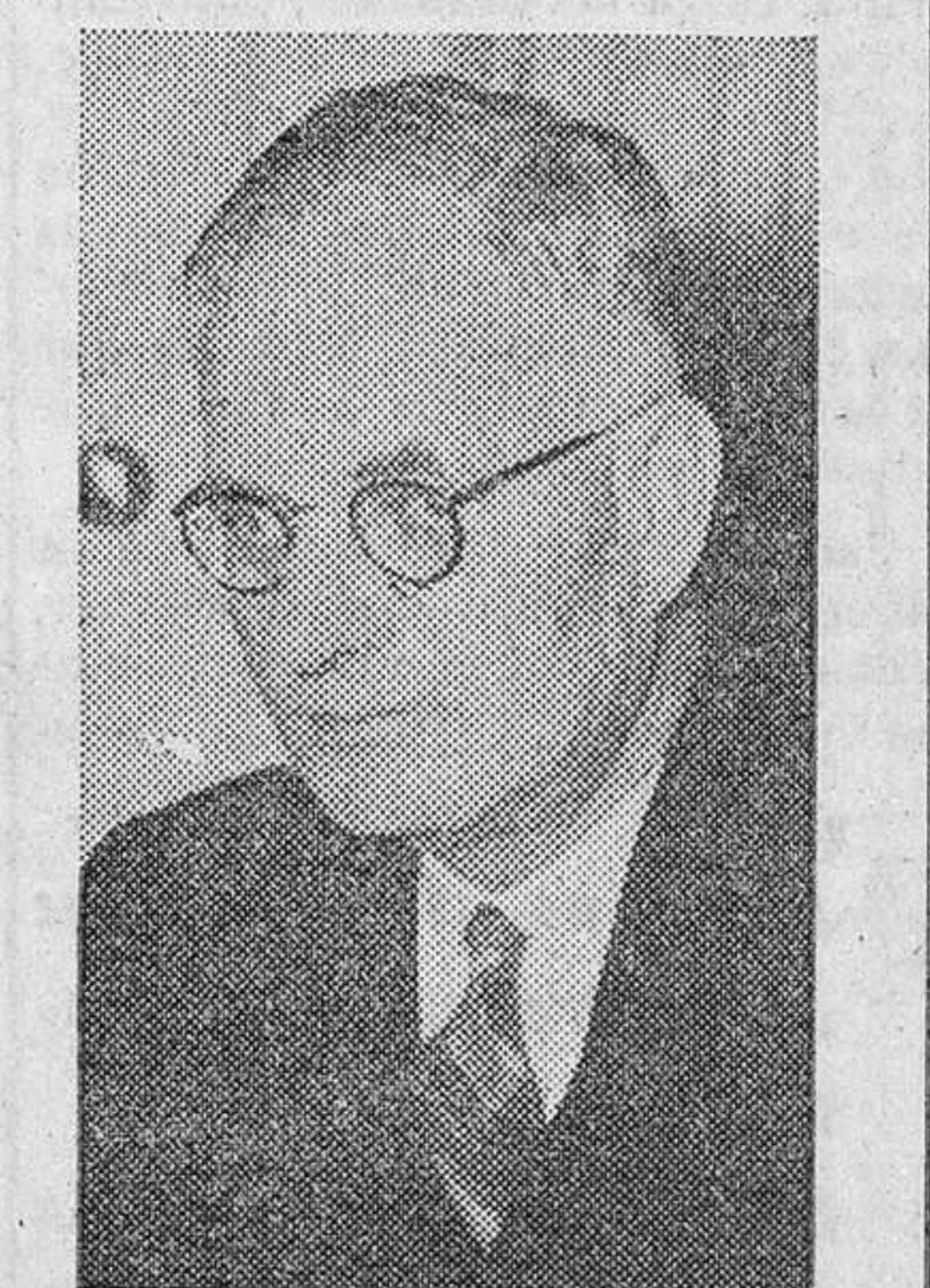
John Curtin, primer ministro de Australia.