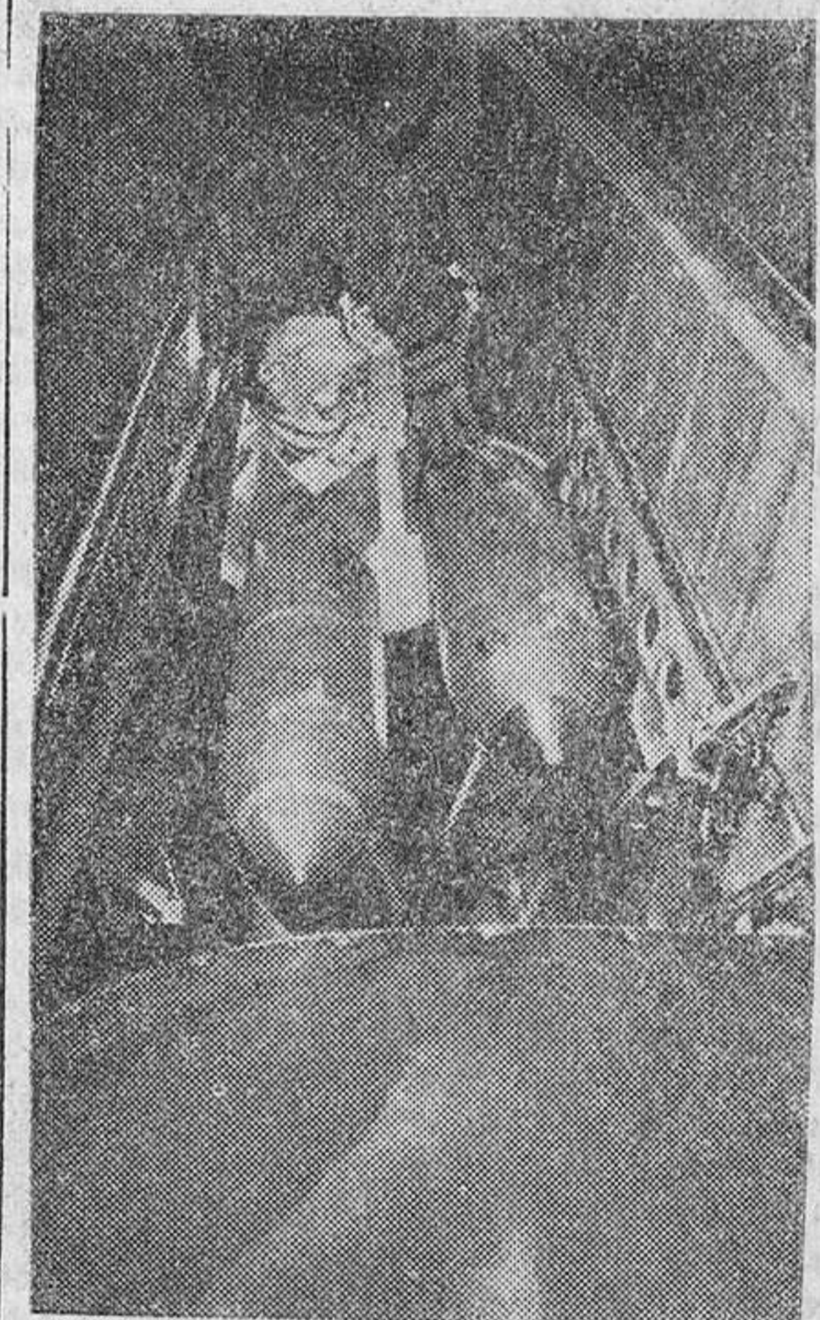
Un avión de combate alemán recibe la carga de bombas que ha de soltar sobre los objetivos enemigos que le han sido señalados