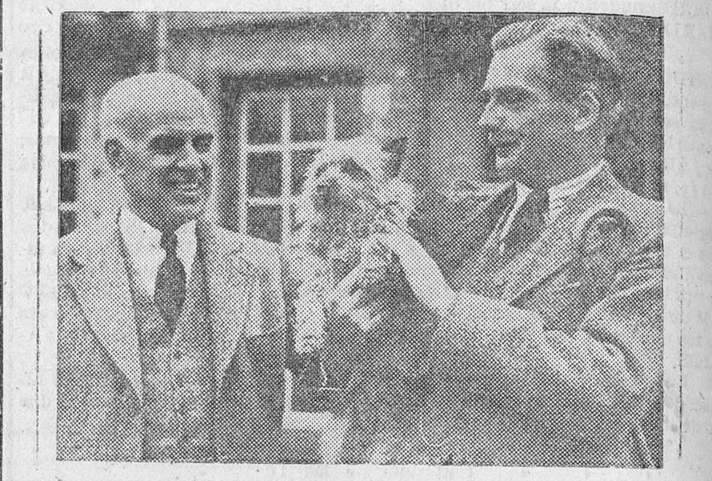
Edward R. Stettinius, subsecretario de Estado de los EE. UU., y Anthony Eden, ministro de Asuntos Extranjeros Inglés, durante la estancia del primero en Inglaterra.