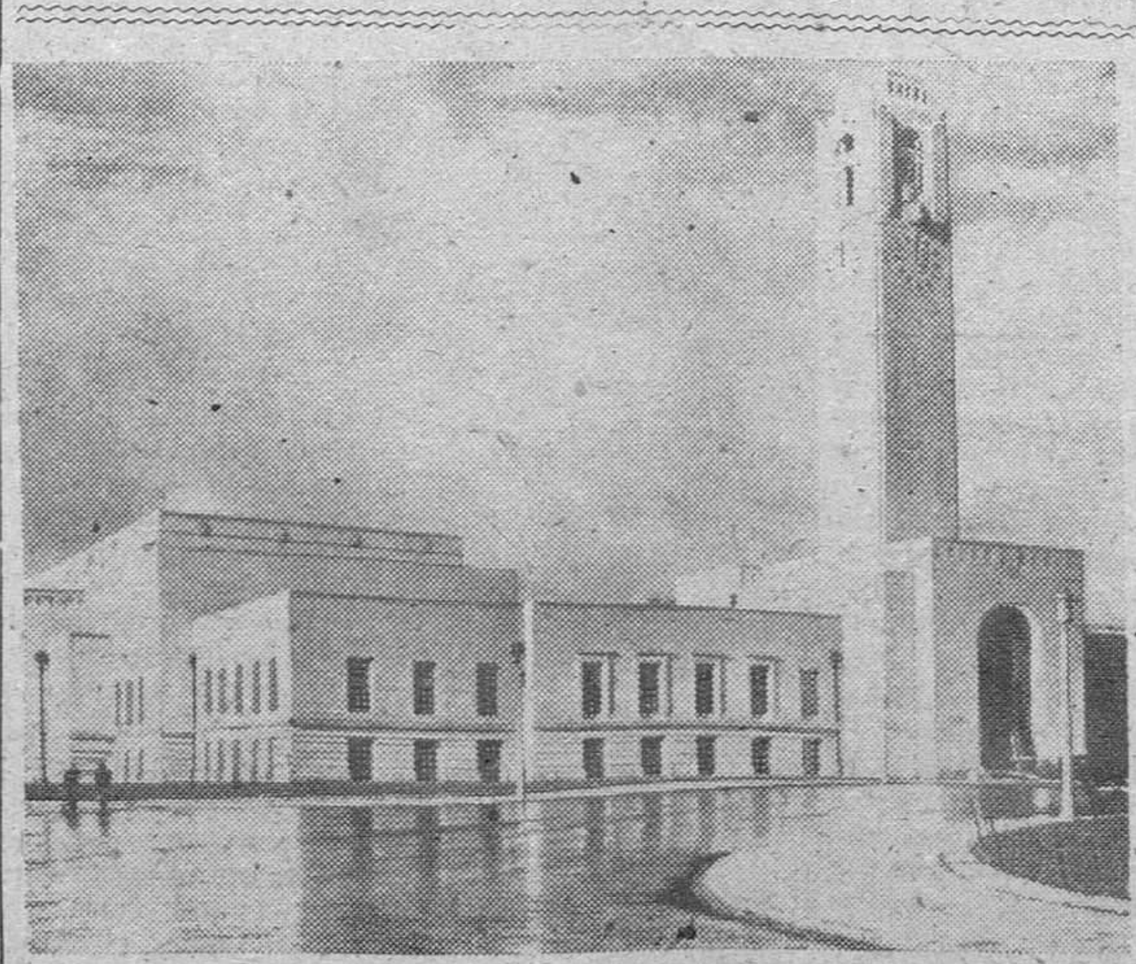
El Ayuntamiento y el Centro Cívico de Swansea, en el Sur de Gales, Inglaterra.