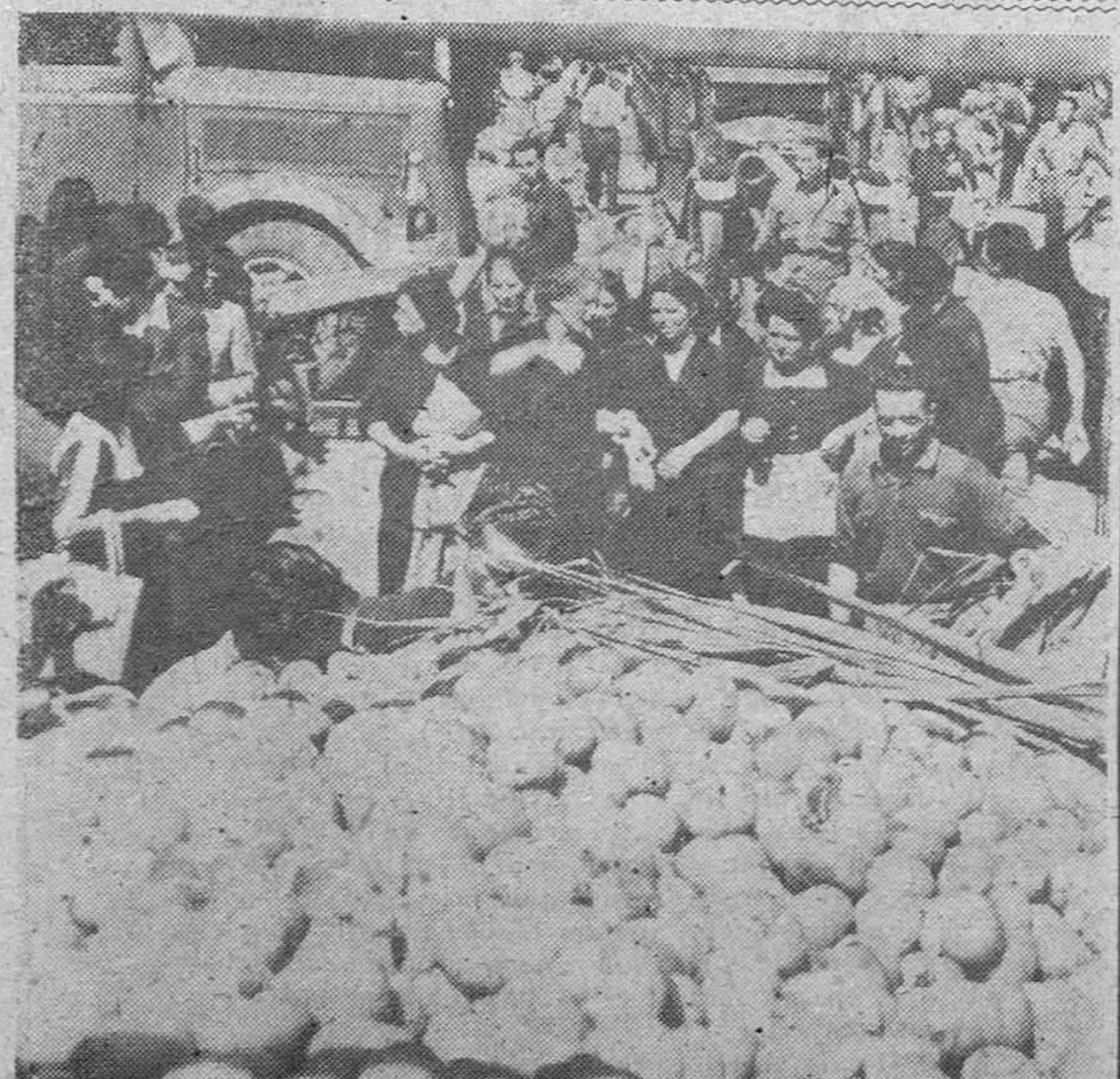
En Roma, como en toda Italia, existe una gran escasez de víveres. En nuestra fotografía grupos de mujeres adquieren en el mercado de la capital italiana las pocas mercancías puestas en venta.