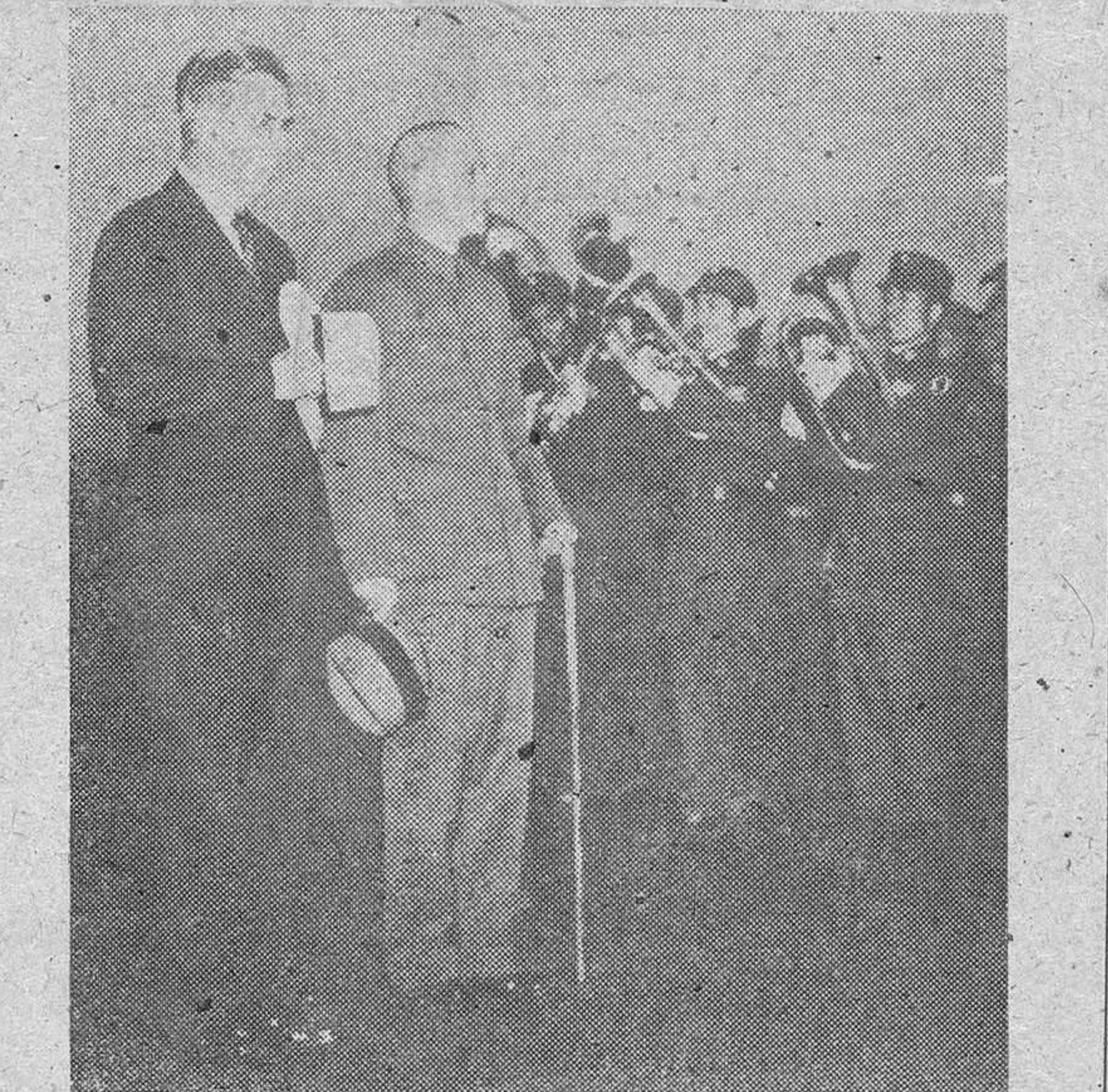
Henry A. Wallace, y el generalísimo Chang Kai-shek, escuchan el Himno Nacional americano interpretado a la llegada del primero a Chunking.