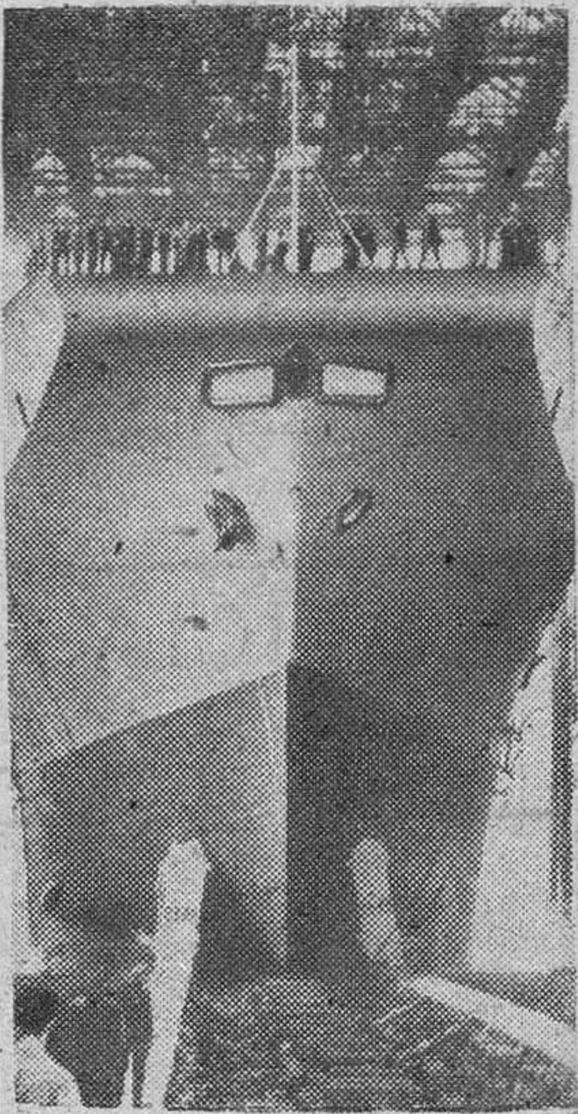
Un nuevo portaaviones británico botado en los astilleros navales británicos de Swan Hunter Neptune Yard en Wallenden-Pard.