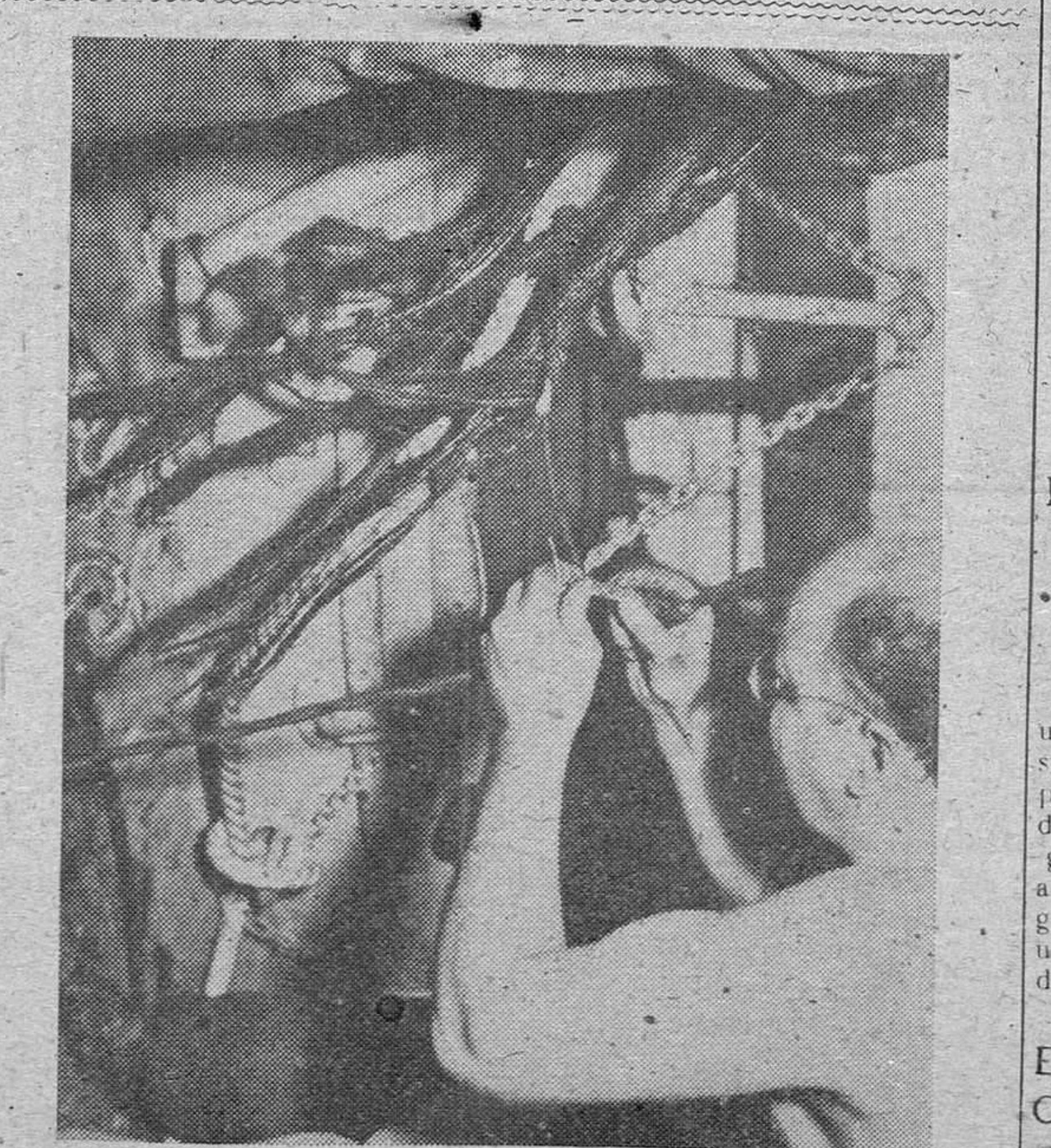
Cuando los japoneses tomaron Guam, se cortó el cable de comunicaciones Guam-Midway. Una vez reconquistada esta base, se procedió a la reposición y revisión del cable. Aquí vemos una sección del cable subido a bordo del «Restorer», para su comprobación y ensayo