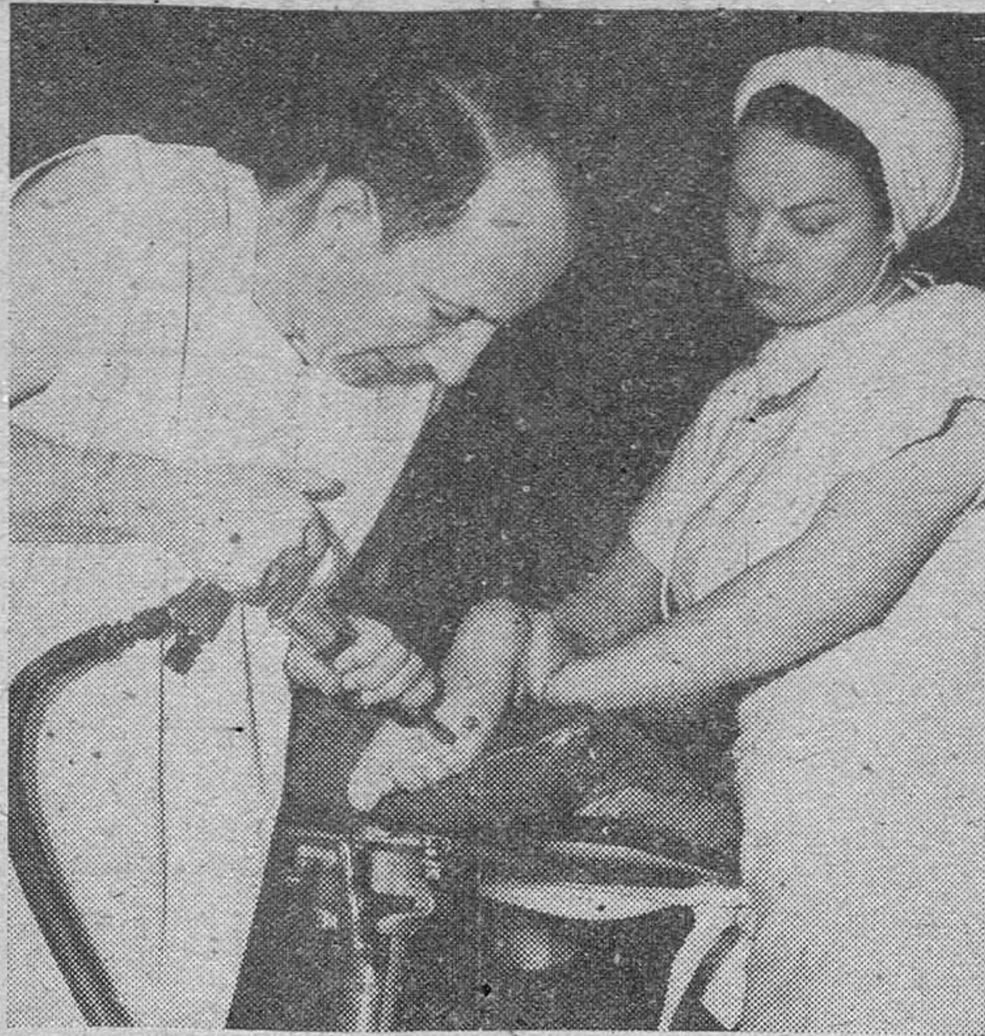
Los médicos norteamericanos utilizan en los convalecientes de parálisis un nuevo método llamado nerotripsia o interrupción nerviosa , para el cual se utilizó una remachadora automática