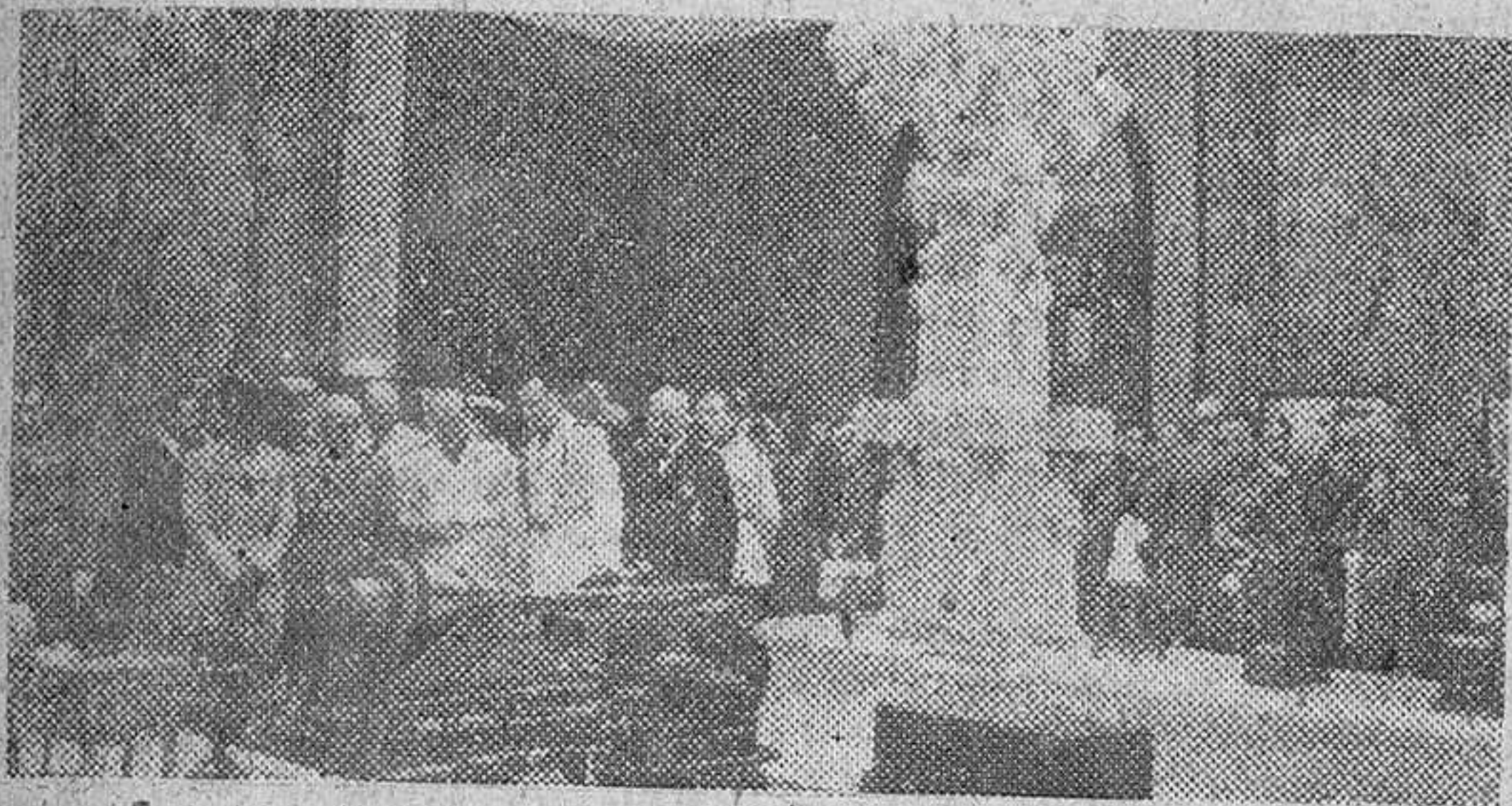
El Caudillo visitando la Exposición Nacional de las Escuelas de Artes y Oficios de España. Se detiene ante algunas elaboraciones artesanas de maquinaria y forja en la sala que preside el magnífico crucero en mármol de la Escuela de Valencia.

De toda España llegaron telegramas de felicitación a la Casa Civil del Caudillo