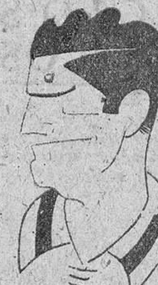
Esta gran figura del balón-pie nacional