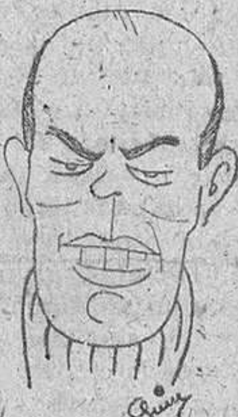
Mesa el gran defensa internacional del equipo español que esta temporada actúa con los colores del Coruña. El equipo gallego confía tener un destacado puesto en la Liga al conseguir la firma de esta gran figura del balón-pie nacional (S. C. R. I. P.)