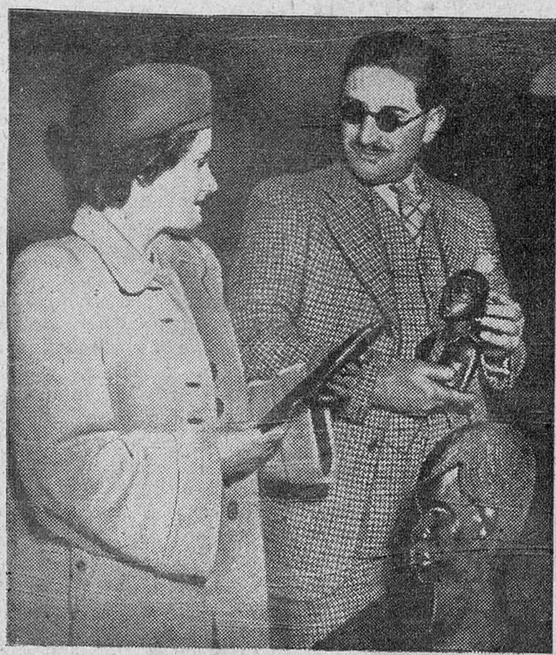
ORGANIZACION PERFECTA.—La Organización Nacional de Ciegos, considerada como la más perfecta del mundo, está sirviendo de modelo para las similares de otros países. Uno de sus más entusiastas admiradores, el inventor británico Mr. Ronald Babon, se dirige al Africa Occidental para tratar de remediar la situación de los privados de la vista en aquella región. En la foto lo vemos acompañado de su esposa, poco antes de embarcar.