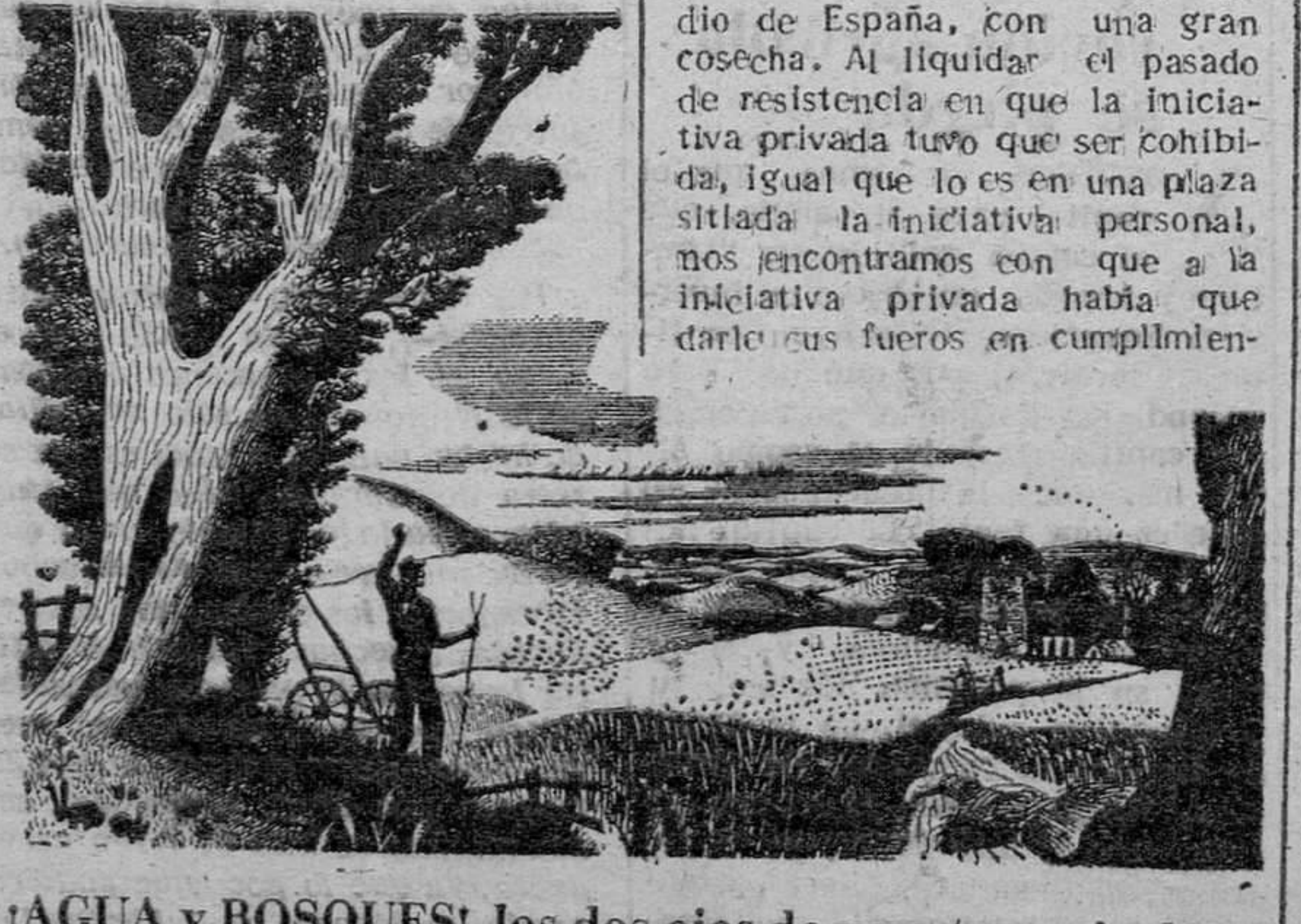
AGUA y BOSQUES, los dos ejes de nuestra agricultura

to de la doctrina del Movimiento, cuya realización había tenido que ser suspendida durante años a causa del estado de sitio en que nos hallábamos. Se ha iniciado la concesión de estos fueros, tan esenciales para el desarrollo total de la vida en el campo. Estos fueros son cristísimos; máximo respeto a la libertad individual, a la propiedad privada, a la libre iniciativa de cada uno de los españoles, siempre que ese respeto no entre en colisión con el otro respeto de superior jerarquía; el respeto a los intereses de la comunidad de españoles en períodos calamitosos o difíciles en que el juego de lo privado puede transformarse de juego limpio en juego traicionero al servicio no del interés privado, sino de la pura y simple justicia.