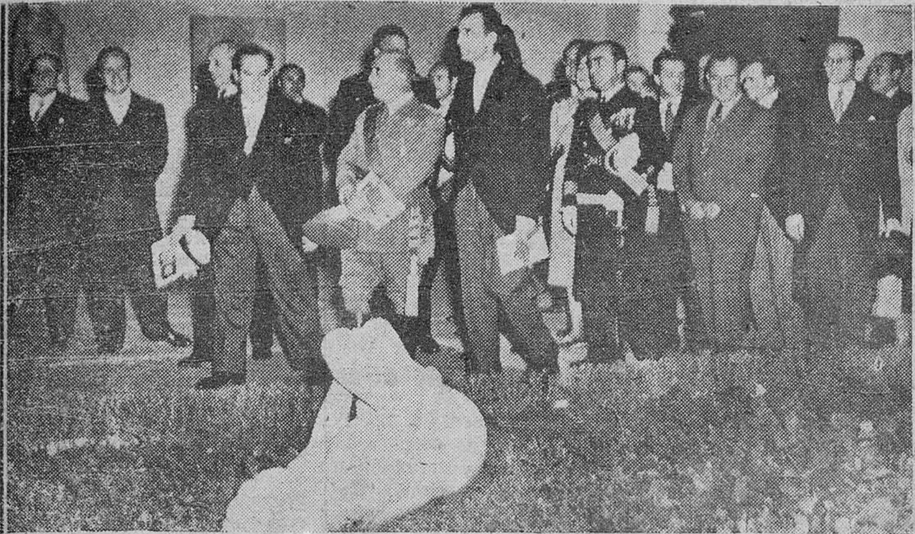
EL CAUDILLO DURANTE SU VISITA A LA BIENAL DE ARTE.