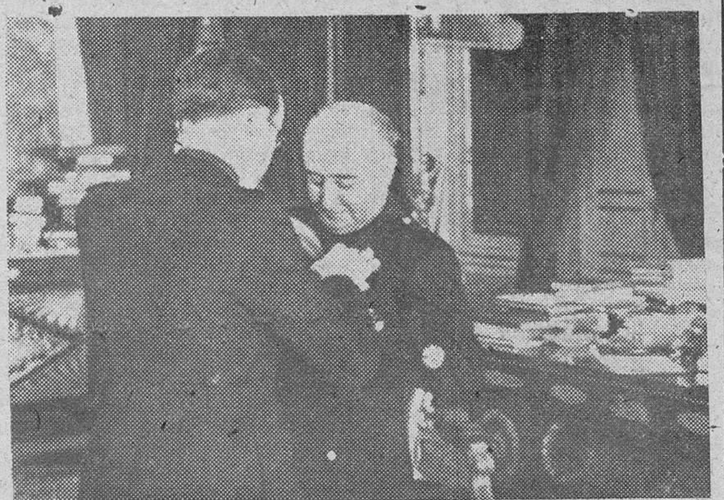
«El Alcalde de Mérida impone la Medalla de Oro de la ciudad al Generalísimo.»

La Medalla de Oro de Mérida para S. E. el Generalísimo