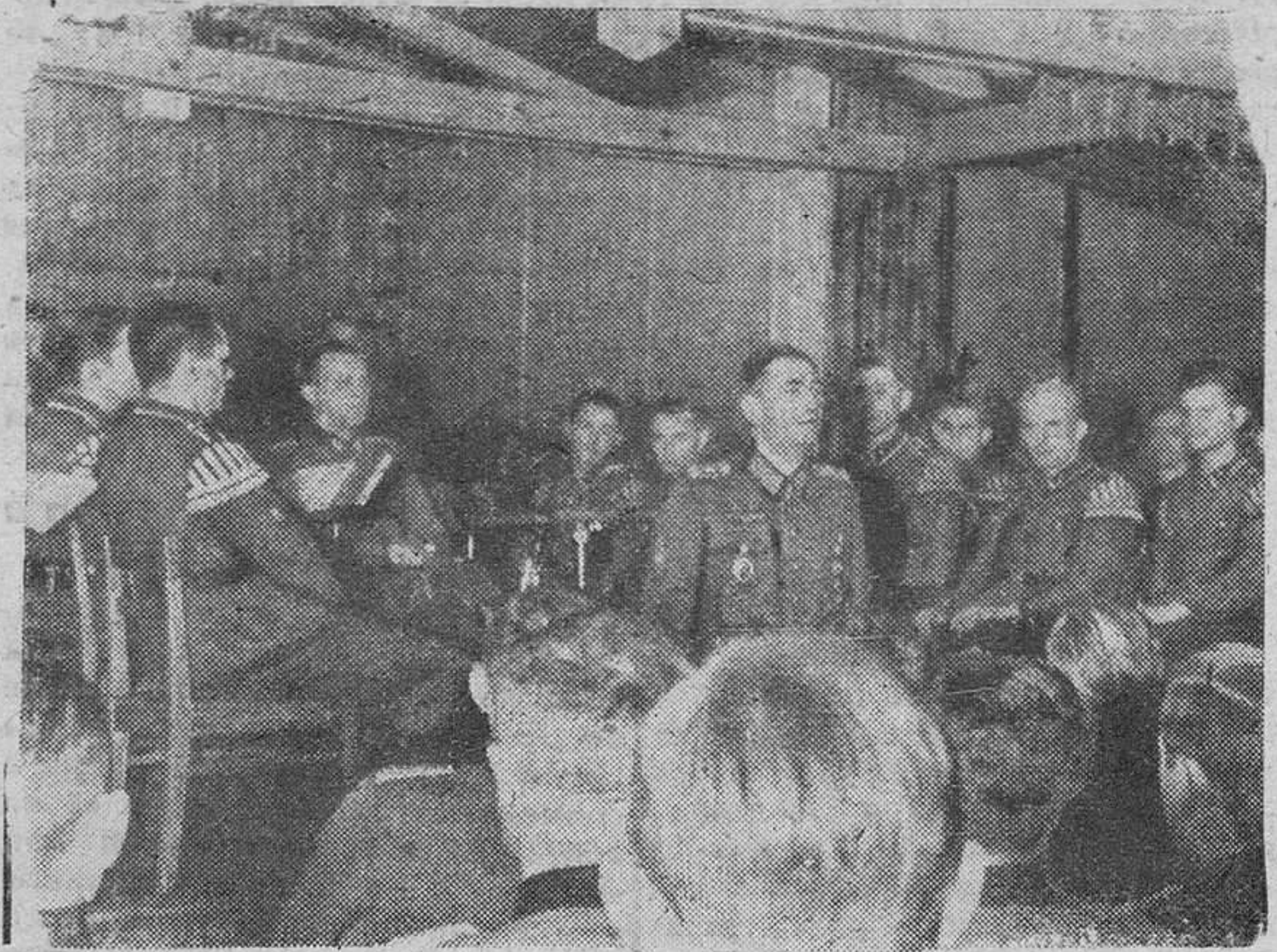
El coronel general Dietl condecorado con las Hojas de Roble a la Cruz de Caballero, visita la S. S. División Alpina «Nord», que se encuentran en las selvas de Carelia. El coronel general durante una breve alocución a los oficiales y hombres de la División.