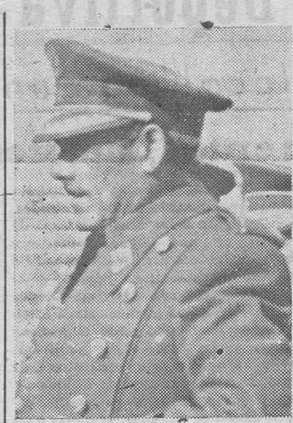
en acto de cortesía para felicitarles la Pascua Militar.—Cifra.

Durante toda la mañana comisiones de los tres Ejércitos visitaron a los ministros de los departamentos