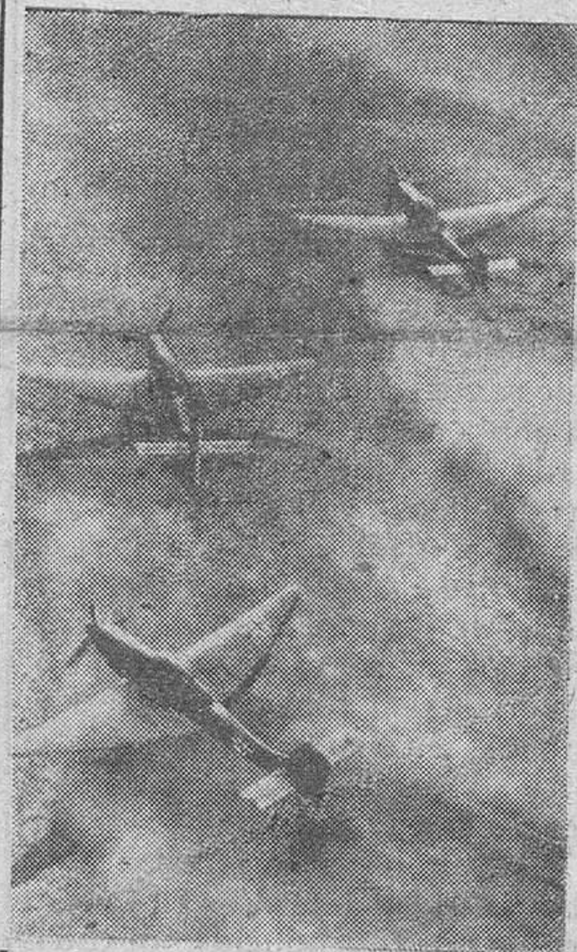
La cámara fotográfica a bordo de un aparato «Cigüeña Fiesseler» ha captado con todo detalle a esta escuadrilla de Stukas dispuesta a actuar