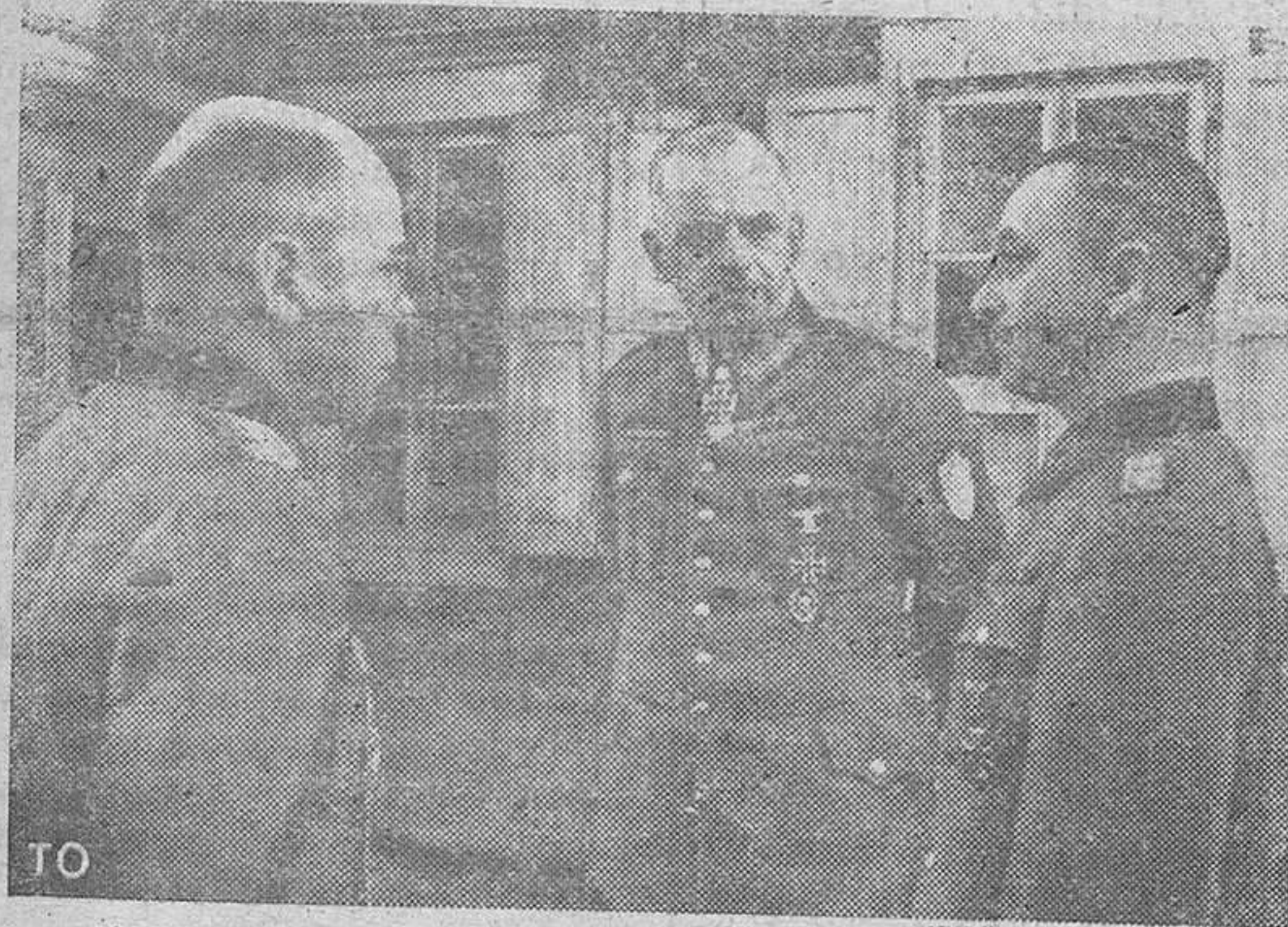
El Mariscal alemán, Busch, cambia impresiones con dos de sus colaboradores.

Su Excelencia el Jefe del Estado la ofreció anoche al Gobierno y Cuerpo Diplomático