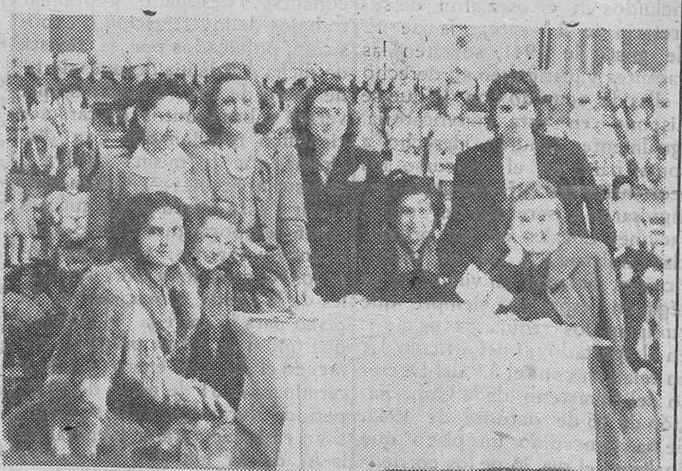
Las hijas de los periodistas preparan la exposición de juguetes de la Asociación de la Prensa.