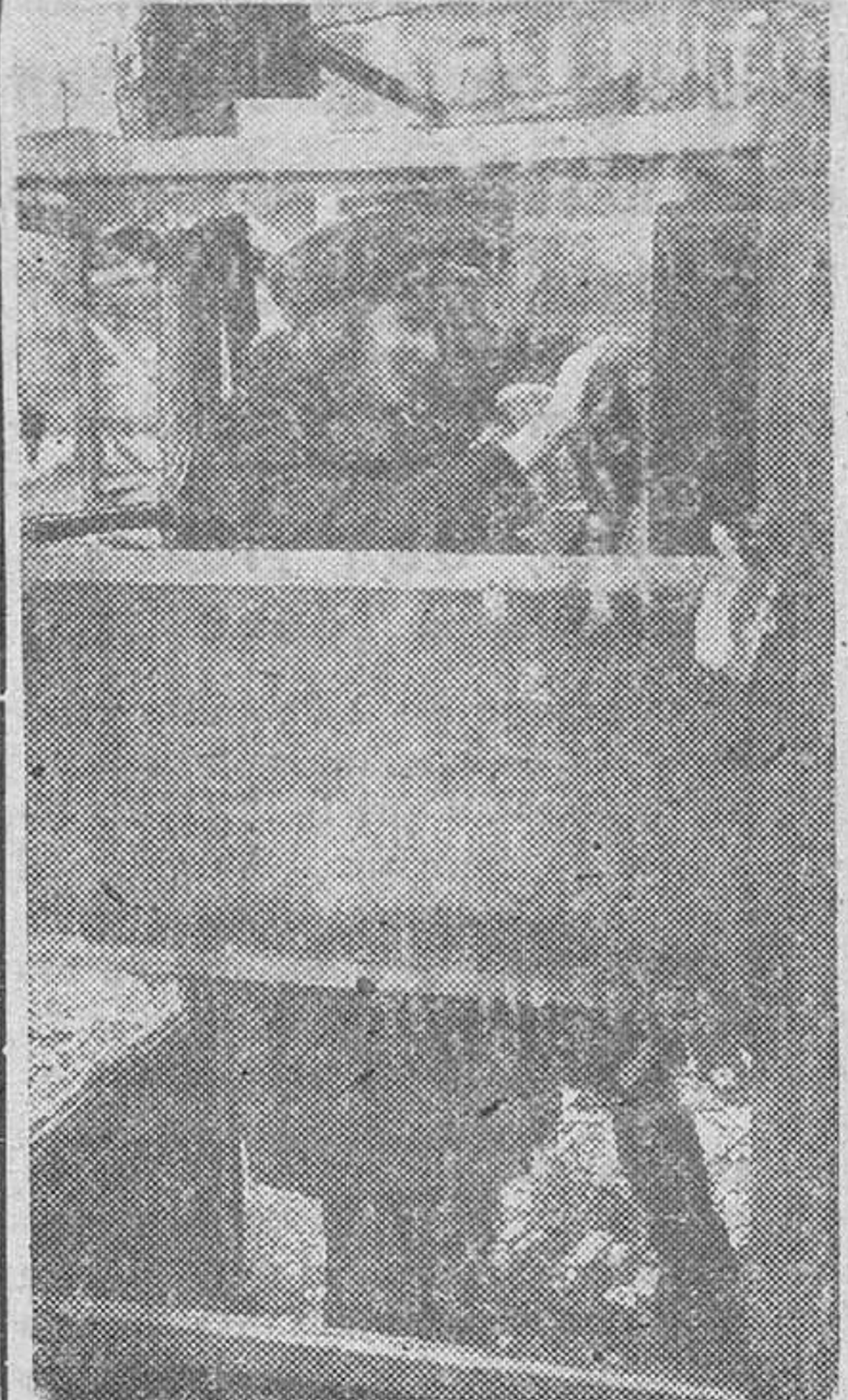
Una muchacha a quien sorprendió el bombardeo en el trabajo, telefona a su familia, para darle y recibir noticias