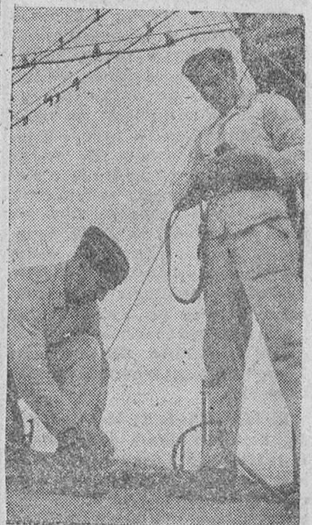
Soldados alemanes del servicio de transmisiones colocan una antena para el servicio de las primeras líneas

Mediante un hábil movimiento envolvente varios potentes grupos aliados han quedado cercados. Es muy elevado el número de prisioneros. Todos los fortines que momentáneamente habían conquistado los aliados están nuevamente en poder de las tropas alemanas. También progresa los combates que se desarrollan en dirección a Sarreouis y ha sido eliminada la cabeza de puente al norte de esta población. Se constata la resistencia alemana al norte de Sarreouis; a emboscadas de Hayersberg contraatacan los alemanes y han logrado reconquistar varias alturas importantes después de duros luchas con fuerzas francesas. En las estribaciones surentales de los altos Vosges continúa la presión de las formaciones francesas. Los carros atacan en dirección de Thénis que hayen logrado hasta ahora éxito alguno. Por tercera vez fracasó el intento de atravesar el bosque de Hart.—Efe.