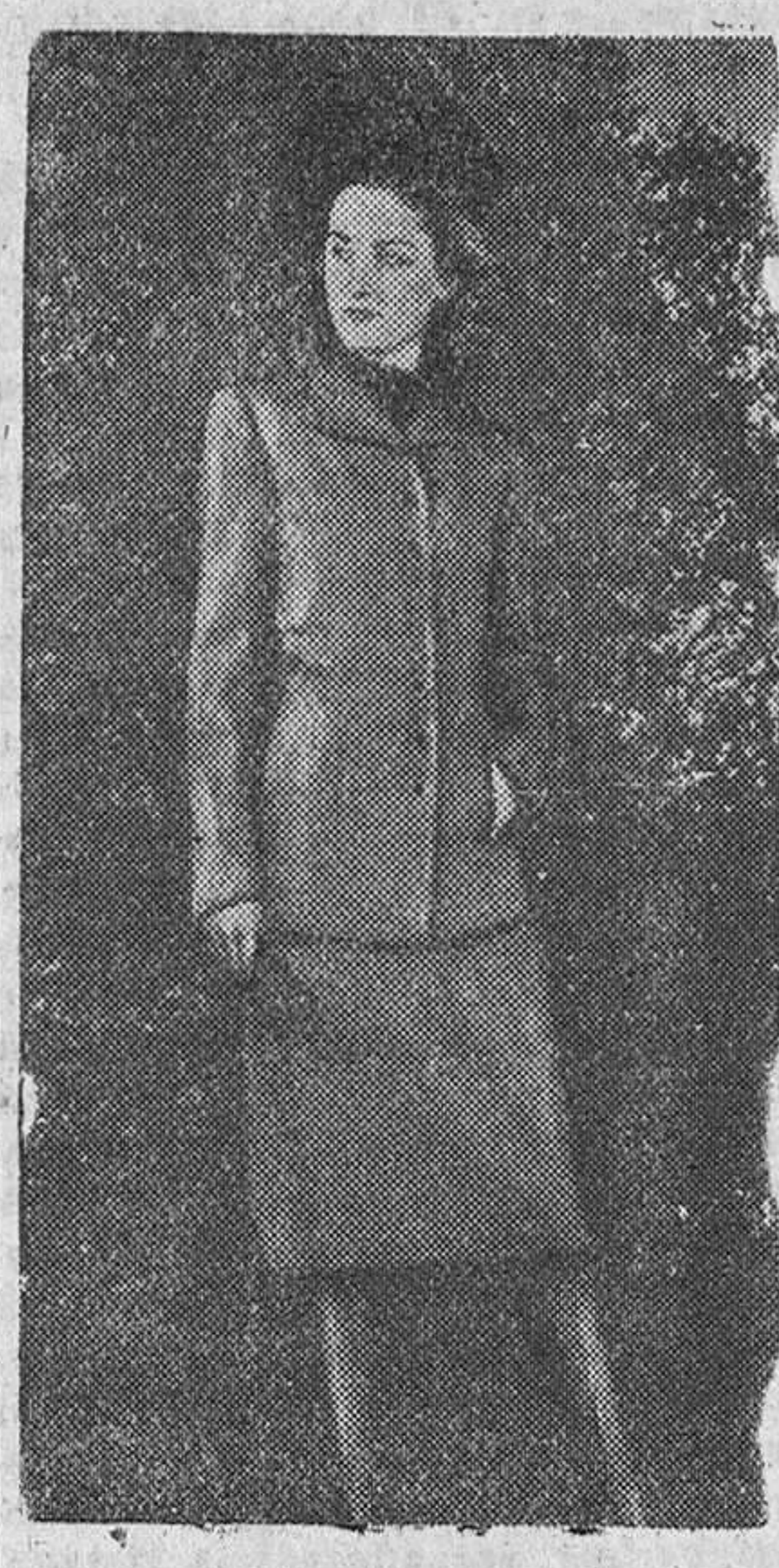
Elegante traje de chaqueta de lana gris a rayas con blusa de color uniforme.