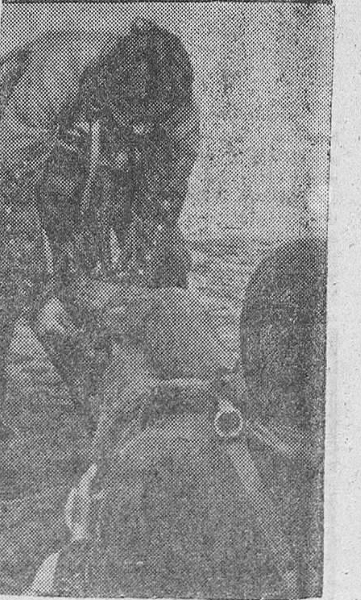
Este nuevo tipo de luchadores individuales da la medida de guerra alemana ha conseguido destacados triunfos en Holanda. En nuestra fotografía vemos a dos de ellos ayudándose mutuamente a ponerse su complicado indumento.