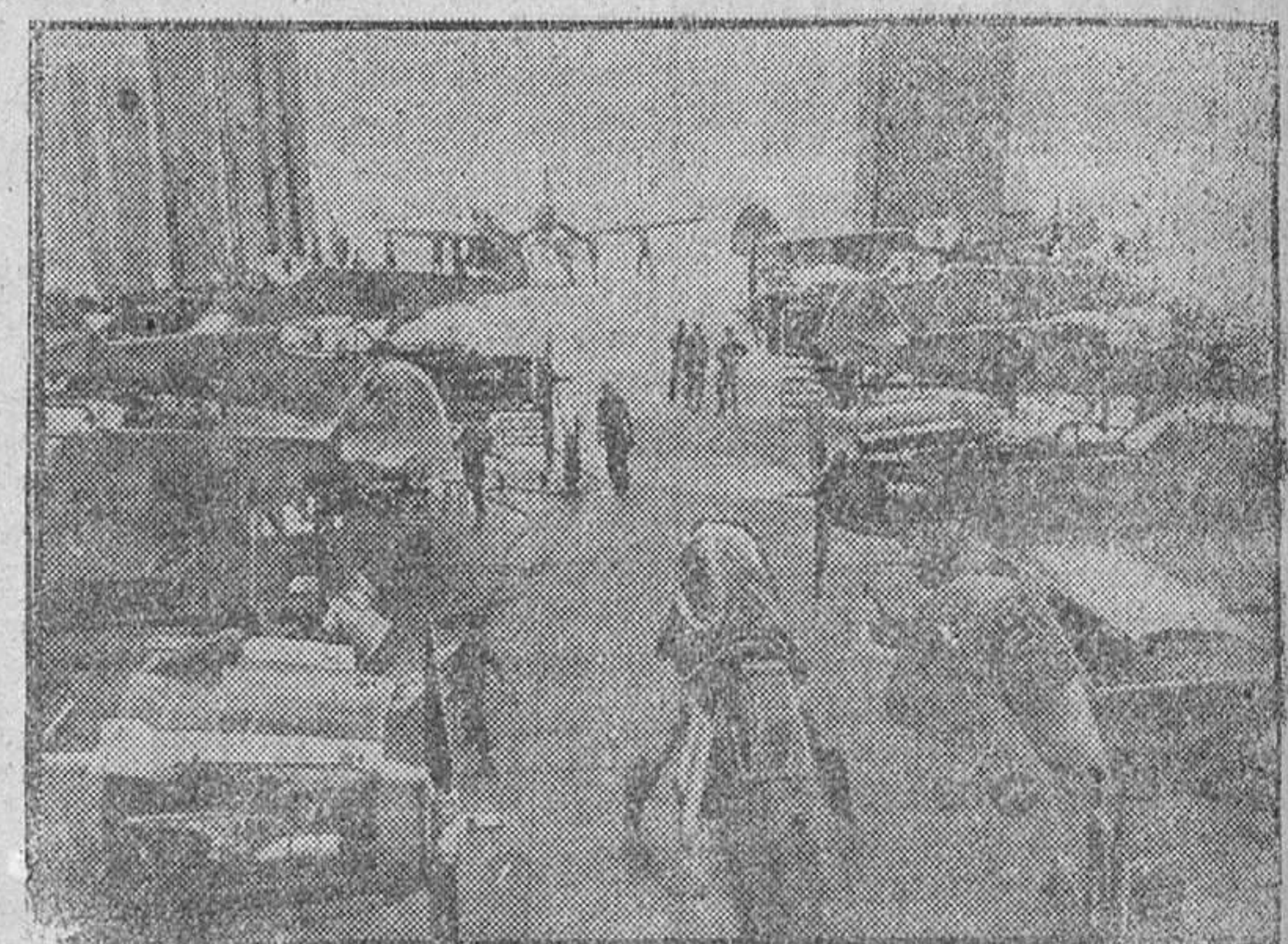
Aspecto de la nave central de una gran fábrica alemana de aviones. Numerosos aparatos de caza preparados para recibir los últimos toques