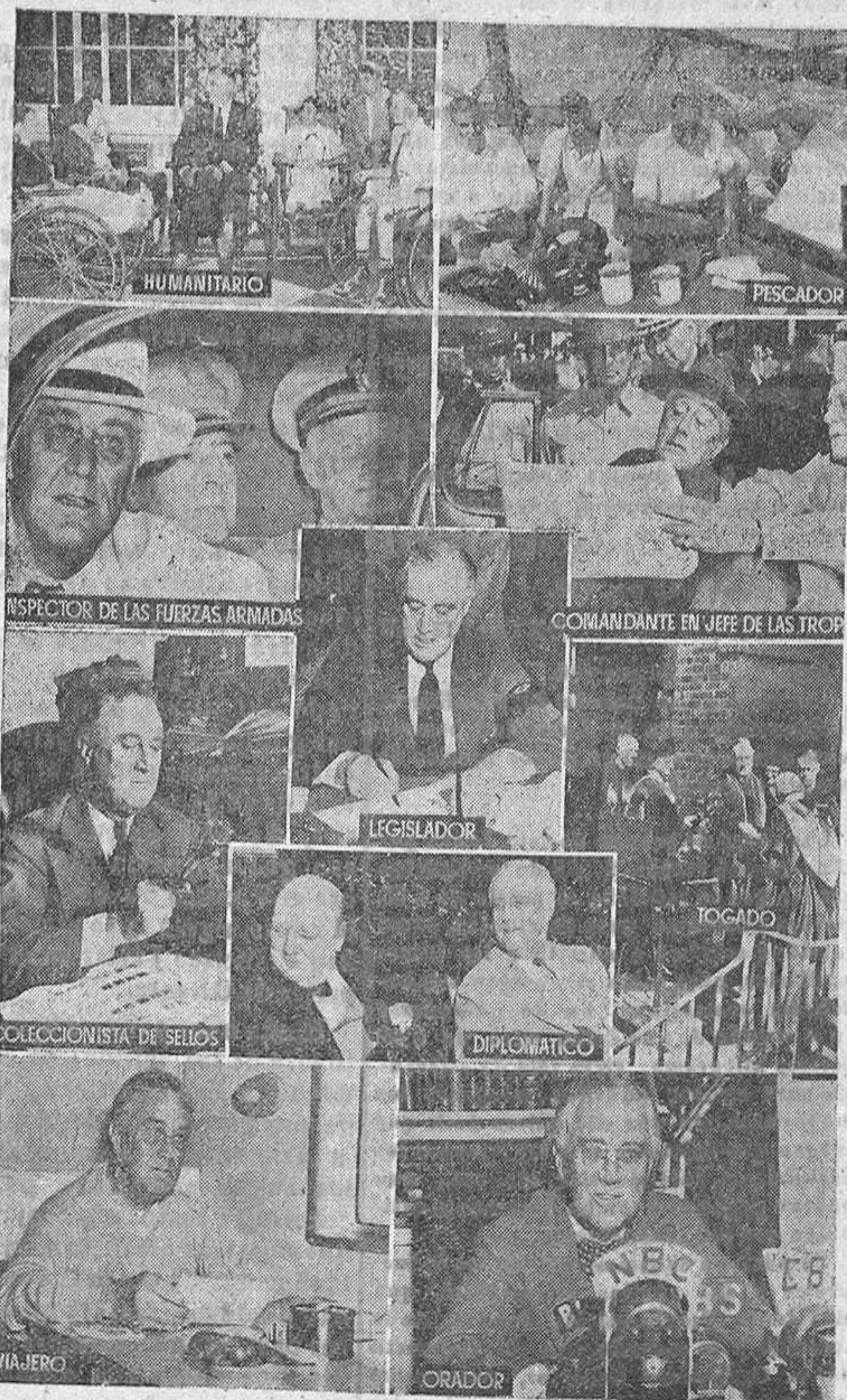
Franklin D. Roosevelt, elegido presidente de los Estados Unidos por cuarta vez, es uno de los conductores de la vida político-administrativa más polifacético y activo en una historia como la de Norteamérica, en la que figuran hombres como Thomas Jefferson, el presidente cuyos inventos se encuentran todavía en muchos hogares del mundo entero.