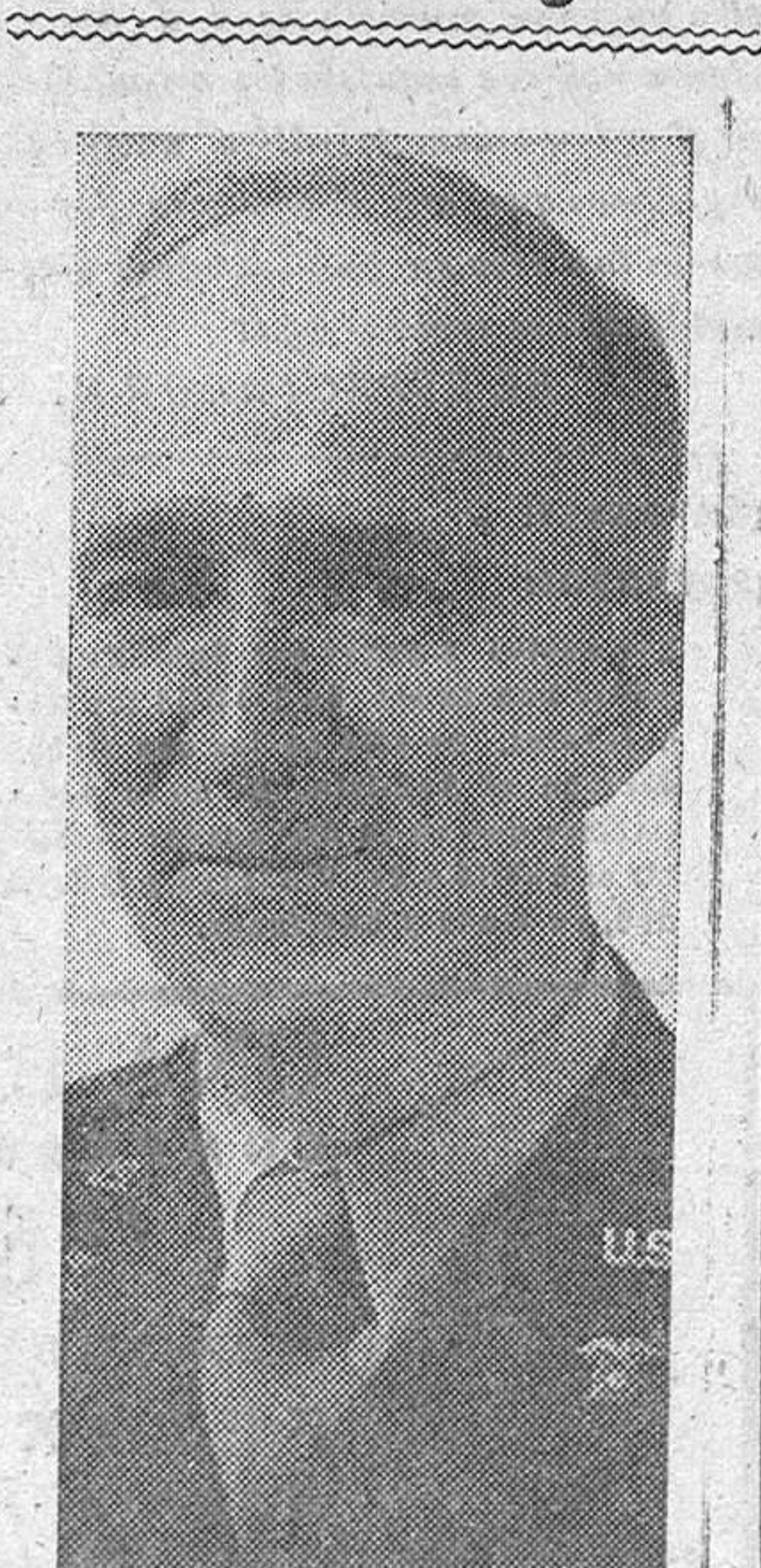
Carl A. Harbig, general de Brigada del Ejército norteamericano