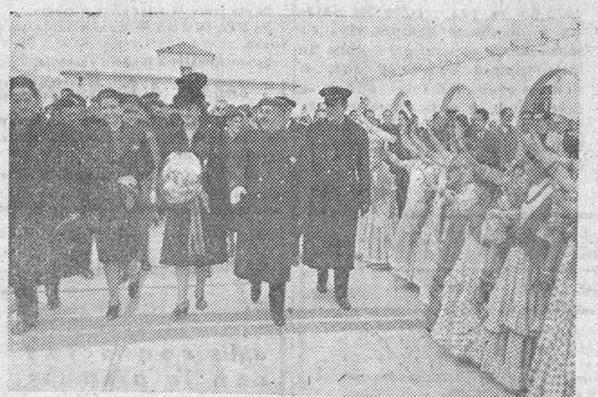
El Generalísimo acompañado de su esposa, del ministro Secretario, de Pilar Primo de Rivera, y otras personalidades, inaugura dos nuevos centros de Auxilio Social con ocasión de su VIII aniversario.