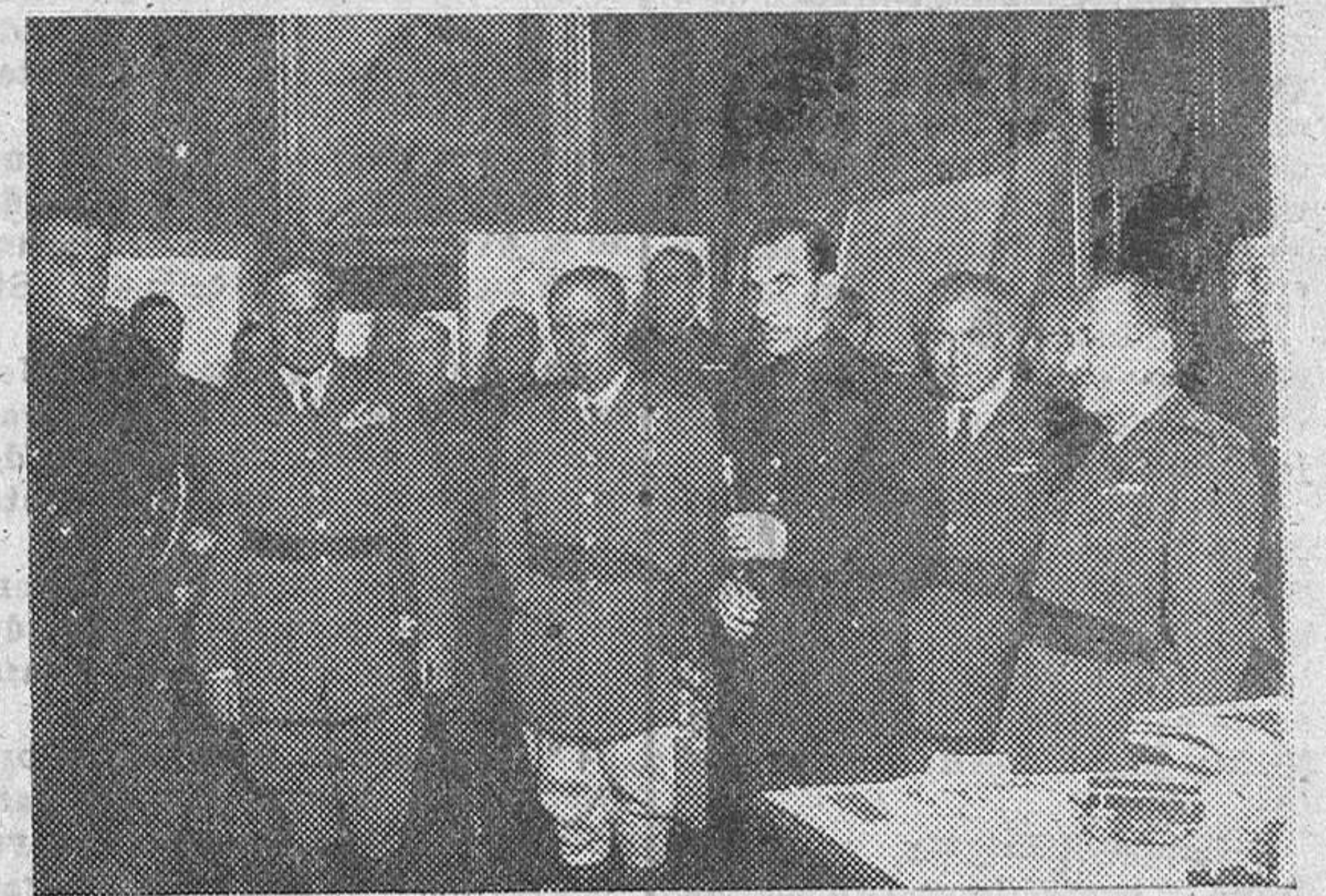
Un momento del acto celebrado en la Capitana General de Valladolid para hacer entrega a D. Tomás Romojaro, gobernador civil y jefe provincial de la capital castellana, de un bastón de mando que la guarnición de aquella plaza le entrega como simbólico homenaje del Ejército a la Falange, en fraternidad de lucha y riesgo.

dades y las clases se completan con demostraciones, películas, documentaciones, etc.