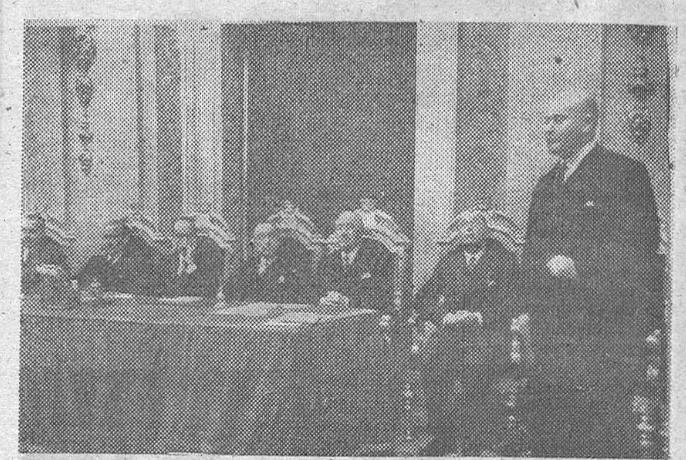
1 Los nuevos vicesecretarios General del Movimiento y Secciones, toman posesión de sus cargos que les da el ministro secretario camarada Arrese con asistencia del ministro de Trabajo, camarada Girón.