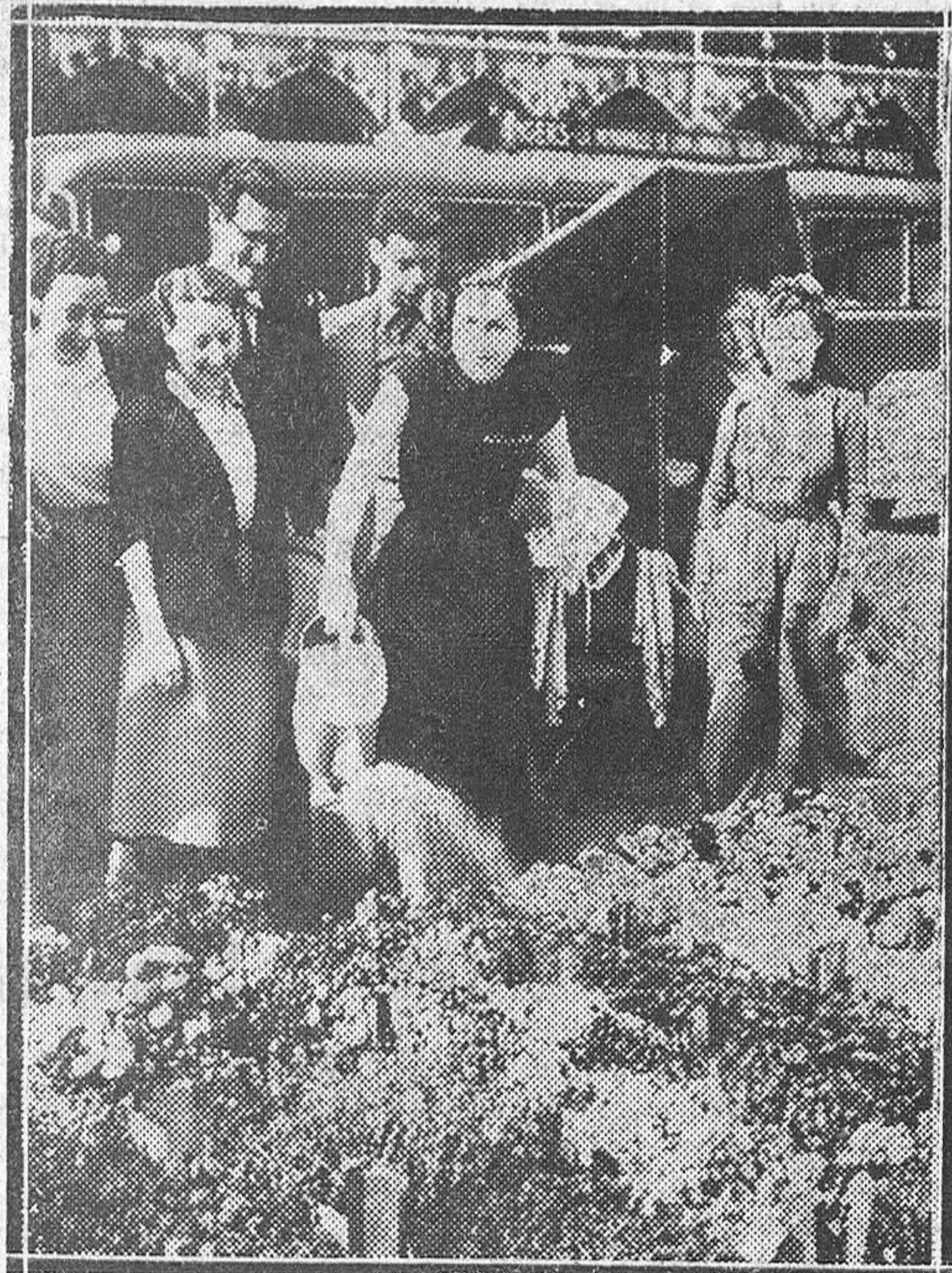
BRUSELAS.—Algunas camaradas de los Coros y Danzas de España se entretienen en el mercado de flores de la Gran Plaza de esta capital, poco después de su llegada.